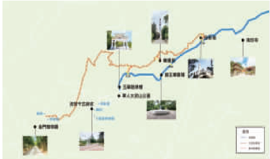
太武山林間步道(大縱走)與玉章路路線圖。

記者高凡洋／綜合報導 內政部國家公園署金門國家公園管理處預計於12月16日至17日分別於斗門、小徑及蔡厝社區活動中心辦理「太武山林間步道系統及可行性評估案」地方說明會，誠摯邀請關心太武山登山步道發展之鄉親與會，並分享寶貴意見。 金管處說明，近年太武山健行登山遊客眾多，已有部分遊客自行尋覓而形成之未開發步道系統，為建置整體步道系統完整、提昇解說及休憩功能、保護登山安全、解決玉章路登山動線單一及部分路幅狹窄等問題，爰辦理地方說明會蒐集在地居民意見，期盼營造金門新亮點。 本次說明會採自由參加，時間及地點如下：112年12月16日(六)上午10時於蔡厝活動中心(金湖鎮小徑村19號)及17日(日)下午3時於斗門社區發展協會2F(金沙鎮斗門5513號2樓)，誠摯邀請鄉親踴躍參加。