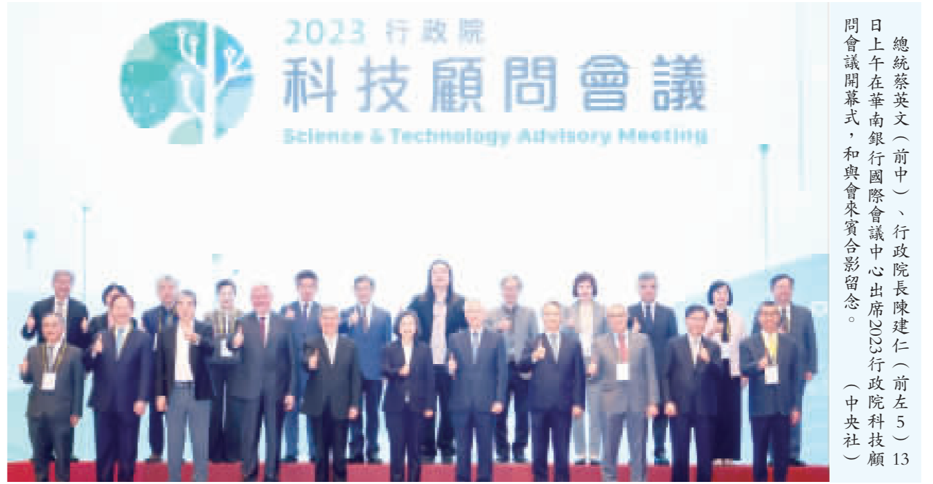
總統蔡英文（前中）、行政院長陳建仁（前左5）13日上午在華南銀行國際會議中心出席2023行政院科技顧問會議開幕式，和與會來賓合影留念。

【中央社記者張瓊台北13日電】睽違10多年，行政院科技顧問會議今天舉行，總統蔡英文表示，如今台灣已擁有完整半導體生態系，更有領先全球的2奈米製程技術，政府將全力協助業者，讓台灣半導體產業，不論是人才或研發量能，都繼續保有領先地位。 行政院今天起至15日重啟科技顧問會議，蔡總統出席開幕典禮致詞時表示，行政院科技顧問會議是台灣最高層級的科技發展策略諮詢會議，她仍記得2006年擔任行政院副院長時，現任行政院長陳建仁是時任國科會主委，現任國科會主委吳政忠則是時任副主委，當時3人與AI、淨零科技，也持續緊密合作。 蔡總統指出，她相信透過這次會議，來自國內外產學研各界人士能交換意見，討論適合台灣未來科技方針，政府也會持續強化全島基礎設施、平衡各地發展，並吸引全球人才到台灣，為台灣注入更多科技發展能量，增強台灣的國際競爭力。 蔡總統也期許，未來能繼續與各界攜手合作，讓台灣在半導體產業、AI以及淨零科技方面，能夠有所突破、站穩腳步，繼續在全球供應鏈中扮演不可或缺的關鍵角色。