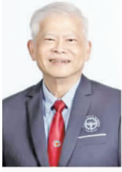
祖籍金門後浦的陳成川在2006年至2008年擔任新加坡工程師學會會長，目前也是新加坡特許工程師專家與技術師認可委員會主席。 (新加坡工程師學會提供)

〔新加坡國際訊〕 〔整理稿：僑訊小組〕 新加坡，2023年11月14日，新加坡工程師學會會長陳成川，當選世界工程組織聯合會（World Federation of Engineering Organizations, 簡稱WFEO）候任會長，將成為首位擔任此國際工程界領導職位的新加坡人。陳成川先生將於2025年正式履新，擔任兩年的任期。 根據新加坡工程師學會於星期二（12月5日）發佈的新聞公告，陳成川先生在今年10月14日於捷克布拉格舉行的世界工程組織聯合會大會中當選候任會長。他將於2025年在中國上海正式就職。 世界工程組織聯合會成立於1988年，是全球工程專業領域中的最高級國際組織，目前擁有約100個成員國，代表全球約3000萬名工程師。 陳成川先生於2006年至2008年擔任新加坡工程師學會會長，目前也是新加坡特許工程師專家與技術師認可委員會主席，並在公用事業局、新加坡理工大學和南洋理工大學擔任要職。他亦曾為多個國際機構服務，包括世界工程組織聯合會、亞細安工程師組織聯合會和國際工程聯盟。 身為工程界的領導者，陳成川先生表示：「在面對全球挑戰時，我將致力於推動工程領域的重要基礎知識，確保我們的專業始終處於前沿，與時俱進。我的首要目標將是提升發展中國家的工程教育水平，加強工程師的職業發展途徑，促進其流動能力，為聯合國可持續發展目標做出貢獻，增強氣候適應能力，改善聯合會的財務狀況，並在全球範圍內進一步推廣聯合會的影響力。」 陳成川先生的當選，將為世界工程組織聯合會帶來新的領導方向，進一步推動國際工程領域的發展。