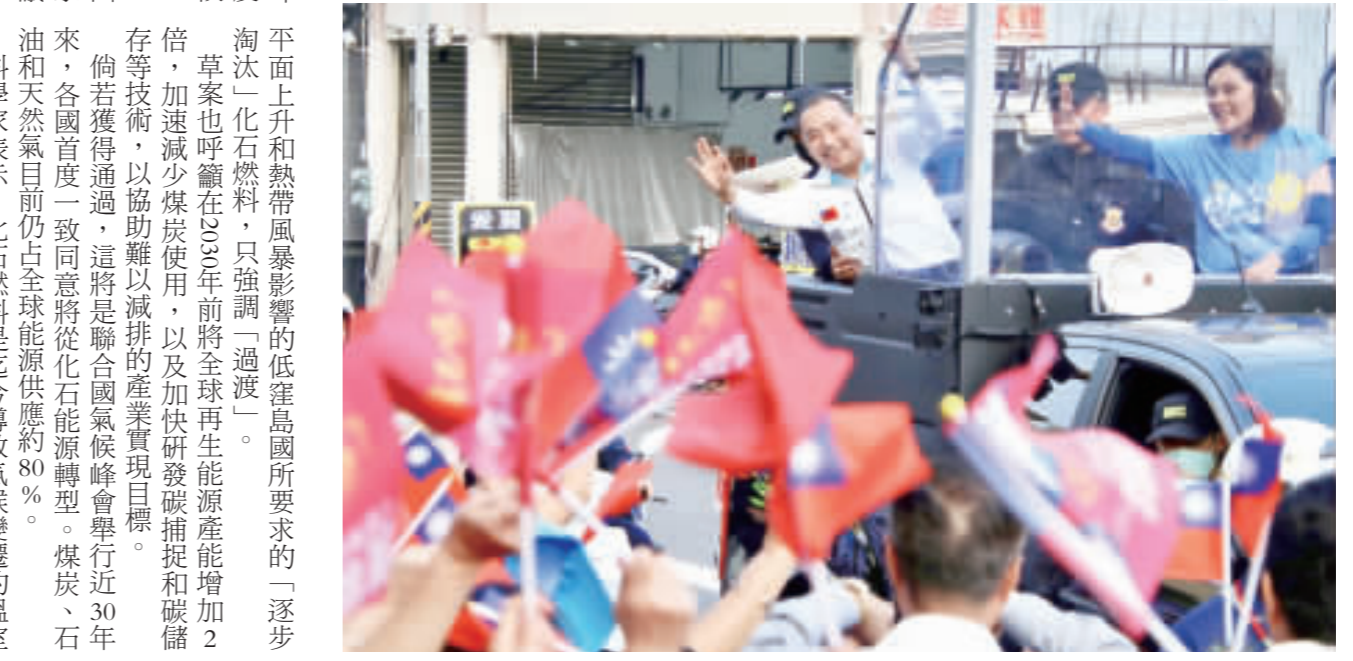
▲國民黨總統參選人侯友宜（車上左）13日南下高雄掃街，與黨籍立委參選人李眉蓁（車上右）進行車掃掃街，沿途向路旁民眾揮手致意，爭取支持。