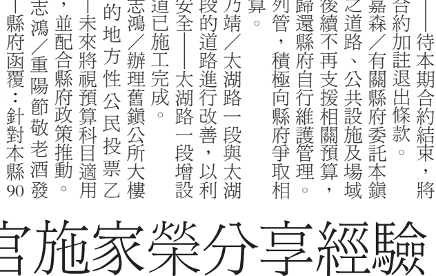
城中邀請地檢署主任檢察官施家榮到校，分享實務經驗。

記者李增江／綜合報導 金湖鎮中積極推廣品德與法治教育活動，並透過與不同單位合作，增進學生在品德教育能有更寬闊的視野，也讓學生透過多元的面向學習品德教育的核心素養。城中日前辦理講座活動，特別邀請金門地檢處主任檢察官施家榮到校，分享他在法務工作的實務經驗。 此次講座，結合了綜合領域中輔導課程的職涯探索，邀請施家榮主任檢察官針對檢察官的養成歷程、工作內容以及地檢署的法律業務，進行實務的分享。中除了讓學生認識檢察官的日常生活，也了解不同檢察官的任務性質，更也破除了學生可能在部份法律劇中對檢察官產生的迷思。 施家榮主任檢察官在講座中，以「現代青少年須具備的法律知識」為題，提醒城中的學生們遵守法律即為品德展現的實踐，而認識法律，除了是一個公民該有的基本素養，更也是在社會中保護自己的重要方式。 講座以深入淺出的方式帶領學生由不同的案件分析中，建構不同類型的法律常識。分享案例包含了網路書店詐騙案、少年車手案、跨越雙黃線的車禍肇責、網路裸照威脅、毒品咖啡包及最近剛通過的跟蹤騷擾防治法宣導。每一個案例分享後，施家榮也引導學生在案件中建立回顧與邏輯思考，並指出該如何去找出違法行為中可能存在的「不尋常」，淺顯易懂的講解方式，讓城中的學生在聆聽的過程頻頻點頭，收穫滿滿。 城中校長謝志偉表示，非常感謝地檢署熱心的協助，法律與生活密不可分，認識法律是每一個學生未來都需具備的核心素養；在這次的講座中，每一個案例都和青少年息息相關，且都緊扣著學生的生活，讓同學都能有感而發的深刻體悟；另外，感謝主任檢察官與學生分享法務經驗，讓學生在未來做職業的選擇時，可以因為多一層的認識，而有多一時的選擇。城中的品德教育持續推動，也將在歲末時結合不同活動，希望引導學生透過不同的方式將品德實踐融入生活，將公民核心素養成為未來的日常。