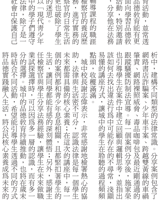
台電公司塔山電廠捐贈1萬5000元慰助金給金門縣身心障礙福利協會。

記者陳冠霖／綜合報導 塔山電廠捐贈1萬5000元的慰助金給金門縣身心障礙福利協會。塔山電廠表示，此次活動不僅是對金門縣身心障礙福利協會的一份鼓勵和支持，也是台電公司不斷致力於社會責任的具體體現。希望這樣的愛心行動能夠發揚更多人投入到關懷弱勢群體的行列。 塔山電廠捐贈1萬5000元慰助金給金門縣身心障礙福利協會。塔山電廠表示，此次活動不僅是對金門縣身心障礙福利協會的一份鼓勵和支持，也是台電公司不斷致力於社會責任的具體體現。希望這樣的愛心行動能夠發揚更多人投入到關懷弱勢群體的行列。