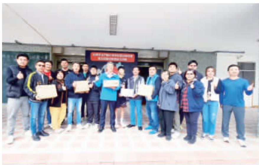
為籃賽選手們打氣，金城鎮公所、代表會致贈運動飲料。

記者陳冠霖／綜合報導 金門縣社會福利服務中心13日召開「112年第4次區域聯繫會議」，由社會處處長陳世保主持，邀請本縣社會處、各鄉鎮公所及金湖鎮公所之村居幹事等單位共同與會，期以促進網絡協同合作。 本中心由金湖社福中心主辦，為促進網絡服務與合作，會議報告本縣金湖社福中心服務，首先為金湖社福中心業務報告，針對脆弱家庭個案執行情形，本年度報告個案服務執行情形，受理各網絡單位轉介、急診、警政、民政、戶政、教育、勞工、司法、民政、戶政、保護專線、社福中心自行發掘及民衆自行求助等新通報計80案，其中新增開案家庭數12案，短期服務17案、福利諮詢18案、不開案27案(含重複通報、無福利需求及轉介其他資源)及開案評估中6案，目前在案量共計60案，其中兒少99人、成人117人，社福中心提供家庭經濟困難、家庭支持系統變化、家庭關係衝突或疏離、兒少發展不利處境、家庭成員有不利處境、和因個人生活適應困難需要接受協助等服務。 本中心由金湖社福中心主辦，為促進網絡服務與合作，會議報告本縣金湖社福中心服務，首先為金湖社福中心業務報告，針對脆弱家庭個案執行情形，本年度報告個案服務執行情形，受理各網絡單位轉介、急診、警政、民政、戶政、教育、勞工、司法、民政、戶政、保護專線、社福中心自行發掘及民衆自行求助等新通報計80案，其中新增開案家庭數12案，短期服務17案、福利諮詢18案、不開案27案(含重複通報、無福利需求及轉介其他資源)及開案評估中6案，目前在案量共計60案，其中兒少99人、成人117人，社福中心提供家庭經濟困難、家庭支持系統變化、家庭關係衝突或疏離、兒少發展不利處境、家庭成員有不利處境、和因個人生活適應困難需要接受協助等服務。