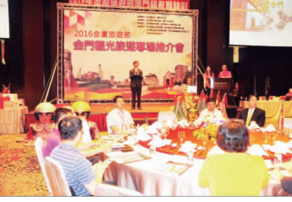
「金廈旅遊節展銷會」金門旅遊展銷會暨觀光產業展銷會昨(6日)晚於昇恆昌金湖大飯店盛大舉行...