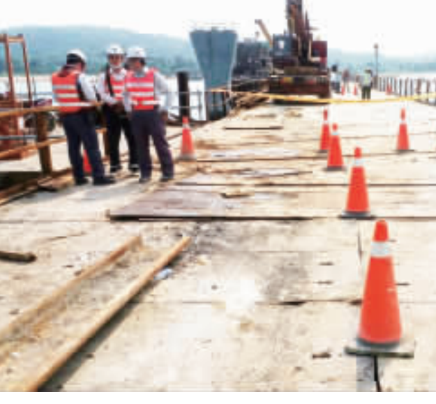
金門大橋新建工程昨日下午發生疑似施工便道崩塌，造成人車落海溺斃的工安意外。