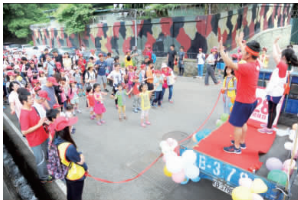
左、右：由財團法人台灣兒童暨家庭扶助基金會金門分事務所主辦的「一〇五年金門家扶「兒保登山趣·親子齊步走」昨日於太武山隆重登場，近千名地區民眾熱情參與，全家把握晨賞春光，渡過一個充實豐富的週休假日。

記者董森堡／金湖報導 登山健走賞春光、家扶活動人氣旺！由財團法人台灣兒童暨家庭扶助基金會金門分事務所主辦的「一〇五年金門家扶「兒保登山趣·親子齊步走」昨日於太武山隆重登場，近千名地區民眾熱情參與，全家把握晨賞春光，渡過一個充實豐富的週休假日。