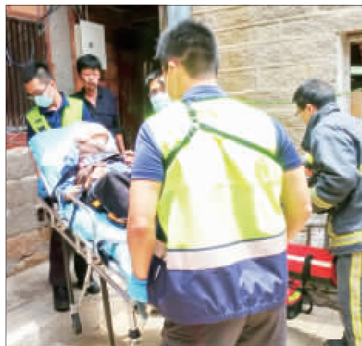
金沙消防分隊利用架梯救援，成功救出跌落床畔的老嫗。

記者董森堡／綜合報導 架梯救老嫗、沙消展戰技！金沙消防分隊昨日利用一架梯成功救出受困於一老嫗之老嫗，並且緊急將該老嫗送往醫院診治，將瀕臨鬼門關的老嫗，挽回寶貴生命。