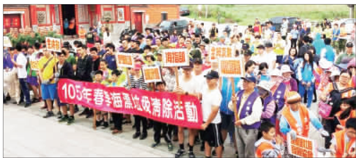
金湖鎮公所於連庵里後峰海濱辦理春季海漂垃圾清除活動，清除海濱一般廢棄物、海漂垃圾。

海濱辦理春季海漂垃圾清除活動，清除海濱一般廢棄物、海漂垃圾，還原海濱清潔的面貌。