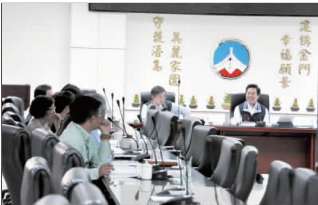
縣府政策小組會議

縣長陳福海在政策小組第四十八次會議中，聽取處局主管意見和建議後，對於有關106年春節環境布置，是期各單位掌握期程，事先規劃，以在年節增加節點有不同面向呈現。