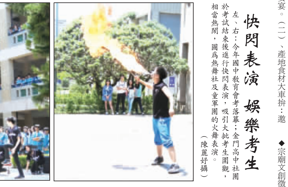
快閃表演 娛樂考生