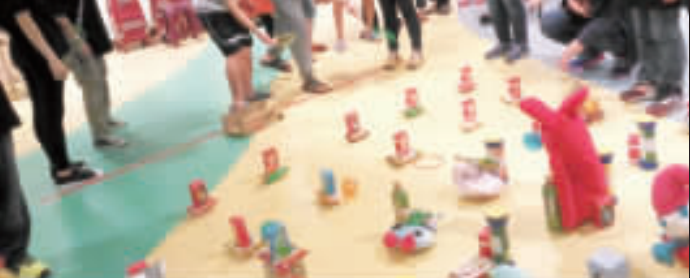
金大社工系學生前往福田家園進行服務學習活動，學生推出夜市套圈遊戲，讓園生玩得不亦樂乎。(許加泰攝)