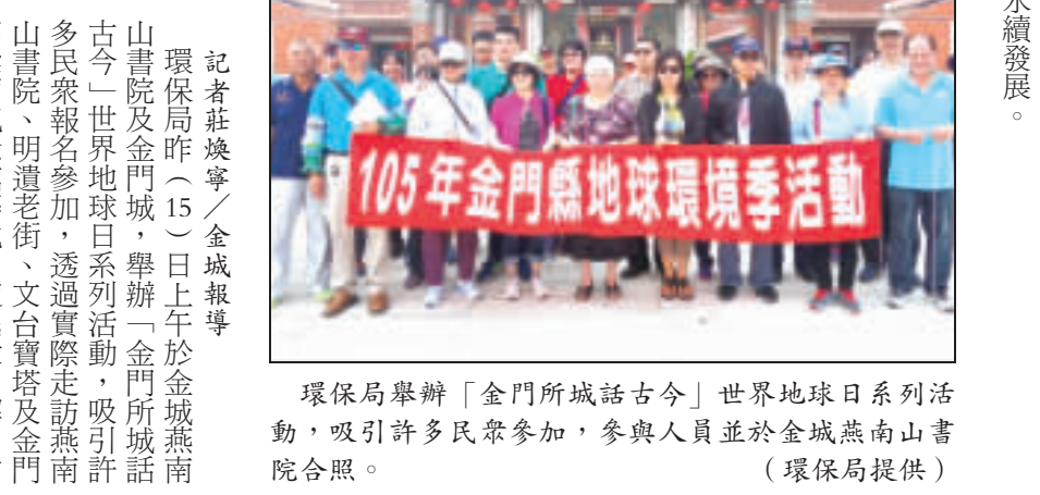
環保局舉辦「金門所城話古今」世界地球日系列活動，吸引許多民眾參加，參與人員並於金城燕南山書院合照。

記者莊煥寧／金城報導 環保局昨（15）日上午於金城燕南山書院及金門城，舉辦「金門所城話古今」世界地球日系列活動，吸引許多民眾參加，透過實際走訪燕南山書院、明道老宅、文台寶塔及金門高粱酒紀念館等地，使民眾了解自古以來，金門城一帶對於金門軍事、歷史文化所帶來的影響。