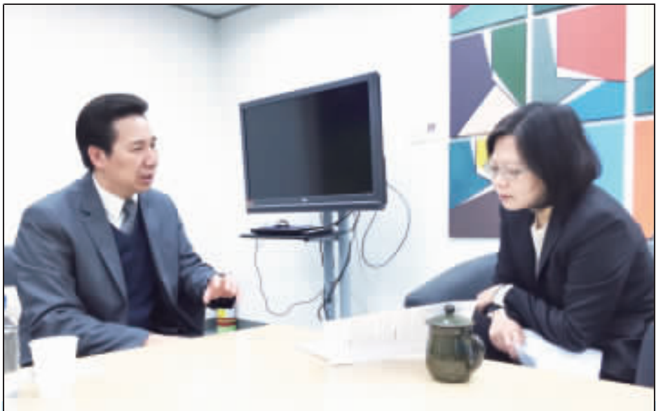
總統蔡英文大選多次前來金門，縣長陳福海與蔡總統見面會談有關金門發展和醫療議題。