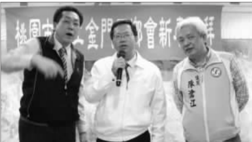
上、桃園市河江金門同鄉會理事長李寧源力促鄭文燦市長同意建立金門館；下、並率該會理事拜會鄭文燦市長。