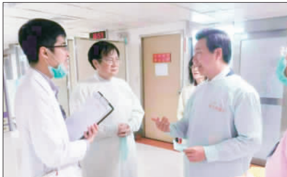
金門縣長陳福海昨日受邀出席總統蔡英文就職典禮，並轉往台北榮民總醫院探慰住院金門鄉親與了解就醫情形。

【本報訊】金門縣長陳福海日前在台北榮民總醫院探慰住院金門鄉親與了解就醫情形。陳縣長在探慰時，並轉往台北榮民總醫院探慰住院金門鄉親與了解就醫情形。 陳縣長認為兩岸領導人均以和平穩定兩岸關係為第一要務，創造兩岸人民福祉為念，而金門自2008年與大陸簽署《兩岸關係和平發展共同宣言》後，兩岸關係進入和平發展的新階段。陳縣長表示，他將繼續致力於兩岸關係的和平發展，並積極推動金門醫療問題的解決。 此外，陳縣長也對蔡總統在任內所展現的領導風采表示欽佩。他認為，蔡總統在處理兩岸關係時，展現了高度的政治智慧和勇氣，為兩岸關係的和平發展奠定了堅實的基礎。他呼籲兩岸人民繼續支持蔡總統的領導，共同為兩岸的繁榮穩定而努力。