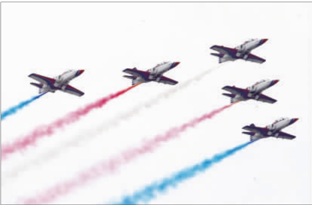
總統蔡英文就職 雷虎衝場

中華民國第14任總統副總統就職慶祝大會20日在總統府前廣場舉行，空軍雷虎小組在凱道衝場，以5機編隊施放紅、藍、白3色彩煙通過總統府前，向新任三軍統帥致敬。