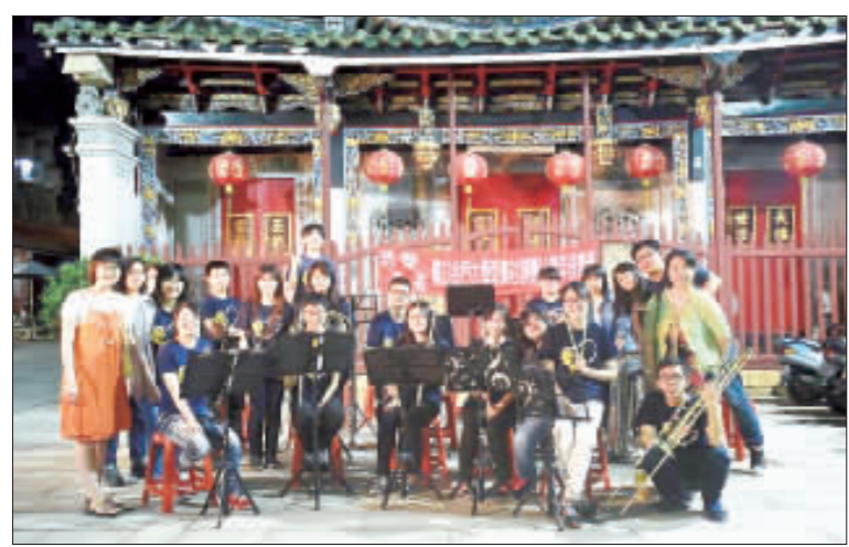
創團十六週年，金大管樂季巡迴演出，最終場將在源民水果餐與鄉親有約。