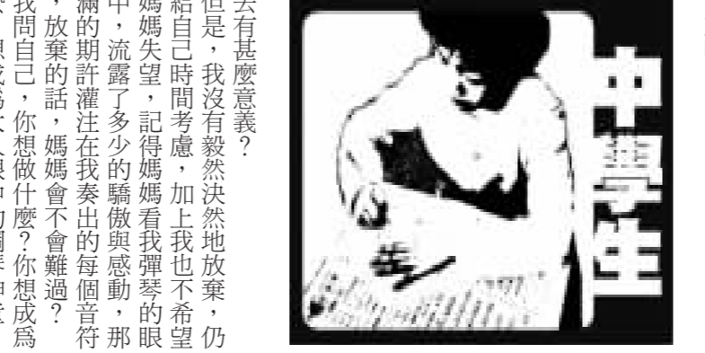
湖中 / 陳雋洋

湖中 / 辛旻諭 「我已經開始了，我不想再這樣下去了，我要結束這一切！」我跟我媽說，「你確定嗎？你不後悔嗎？」 我媽沒有生氣，只是要我問問自己會不會後悔。 我確定嗎？我真的想放棄了嗎？不是應該繼續再撐一下嗎？我既期待又不安的看著媽媽的手，媽媽輕輕推開那扇門，門後傳來美妙的旋律，我第一眼見到那間教室，我無法想像，這是陪了我三年的地方，身材豐腴的黃老師微笑着看著那時才一百三十幾公分的我。 我覺得老師看起來好溫柔，又充滿著音樂人的氣質，環顧早已到教室的同學，沒有半個認識，我也無法想像，那五線譜和旋律，居然將我們牽連在一起，三年。 在小學三年級的時候，我開始學鋼琴，起初，覺得彈鋼琴的男生好帥，想學像偶像鋼琴的男生開始入了這個領域，第一次碰到那白色的琴鍵，我感受到一股強烈的電流，就和初