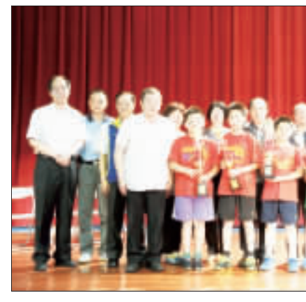
金沙鎮長盃羽球賽昨日舉行閉幕典禮，頒獎表揚優勝選手。

記者董森堡／金沙報導 為期兩天的金沙鎮長盃羽球賽昨日正式閉幕，寶安羽球隊成為此次賽事中的最大贏家，分別拿下男子團體冠軍、女子團體冠軍、男子單打冠軍、女子單打冠軍、男子雙打冠軍、女子雙打冠軍、混合團體冠軍、混合雙打冠軍。