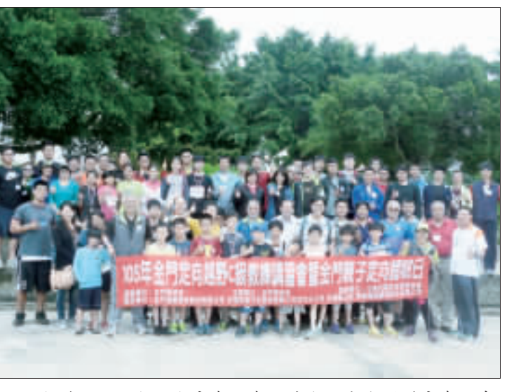
廉能遊戲 學子樂翻

記者許如美／金城報導 中央氣象局政風室在金門氣象站舉辦一場「廉能遊戲」系列活動，特別邀請了「閃電俠」化身「廉能英雄」，以英雄形象帶領學生們突破層層關卡，鼓勵學生們勇於面對挑戰。