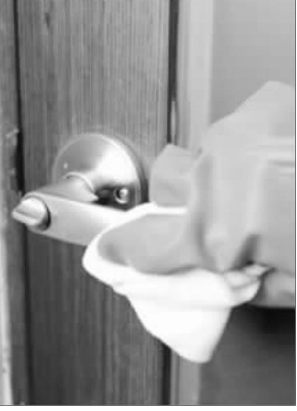
漂白水最具殺菌力 預防腸胃病毒有妙招。台中市政府衛生局表示，濃度500ppm的漂白水，最殺菌效果，在10公升清水中加入100cc漂白水，消毒易觸摸處，可有效消除細菌與病毒。(中央社)

根據臨床試驗結果，兩種幫助免疫系統對抗致命癌症的新藥，比舊療法更有助於病患延壽。醫界應該更有信心，採用腫瘤免疫藥物來對付腫瘤。 路透社報導，默克藥廠(Merk & Co)的Keytruda讓致命皮膚癌(黑色素瘤)晚期患者存活至少3年，必治安施貴公司(Bristol-Myers)的Opdivo，則可讓許多肺癌晚期患者存活至少兩年。 美國臨床腫瘤學會(American Society of Clinical Oncology)11月將在芝加哥開會。Keytruda和Opdivo是首批成功的腫瘤免疫藥物，官方報價一年約15萬美元。這兩種藥物都是透過阻斷蛋白質PD-1發揮作用，因為腫瘤就是靠著這種蛋白質，躲避免疫系統。 研究人員追蹤65名黑色素瘤晚期患者，發現接受Keytruda治療者，4成在開始治療後活了3年。 這些新藥問世前，黑色素瘤並無有效療法。當癌細胞擴散到身體其他部位後，多數患者活不到1年。 另一份研究觀察Keytruda和必治安施免疫療法Yervoy治療黑色素瘤的效用，發現使用Keytruda的患者，5成5接受治療後還存活兩年，接受Yervoy者比率則為4成3。 而在2份肺癌研究中，患者接受Opdivo治療後存活至少兩年，存活率遠高於接受化療者。只有16%接受傳統化療者只有9%存活。 細胞肺癌(NSCLC)病患為對象，接受Opdivo治療者，2成3在開始治療後存活兩年，接受傳統化療者只有8%存活。 另一份研究追蹤52名其他形式的非小細胞肺癌患者，接受Opdivo治療者，2成9存活兩年，接受傳統化療者只有16%存活。 (中央社)