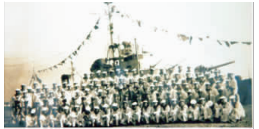
國發會檔案管理局表示，海軍丹陽艦是二戰後，我國從日本接管的驅逐艦，其後因機件老舊而在民國55年除役。圖為丹陽艦官兵當年在除役典禮時的合影。

綠島保育明星龍王鯛(如圖)疑被宰殺案已挖出魚體。林務局表示，研究人員調查，綠島的龍王鯛現在只剩6尾，當地海域看不到小魚，顯示龍王鯛沒有繁殖。 林務局表示，研究人員調查，綠島的龍王鯛現在只剩6尾，當地海域看不到小魚，顯示龍王鯛沒有繁殖。