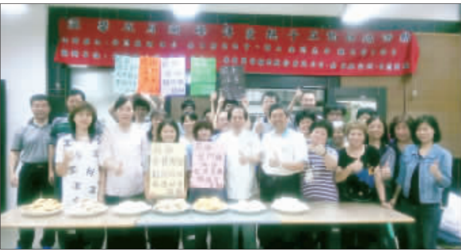
湖峰公共事務協進會昨日舉辦一場「溫馨五月、湖峰傳愛」的感恩活動，端出蛋糕、餅乾、太陽餅及芋頭酥等烘焙點心，讓參與活動的親子寓教於樂。