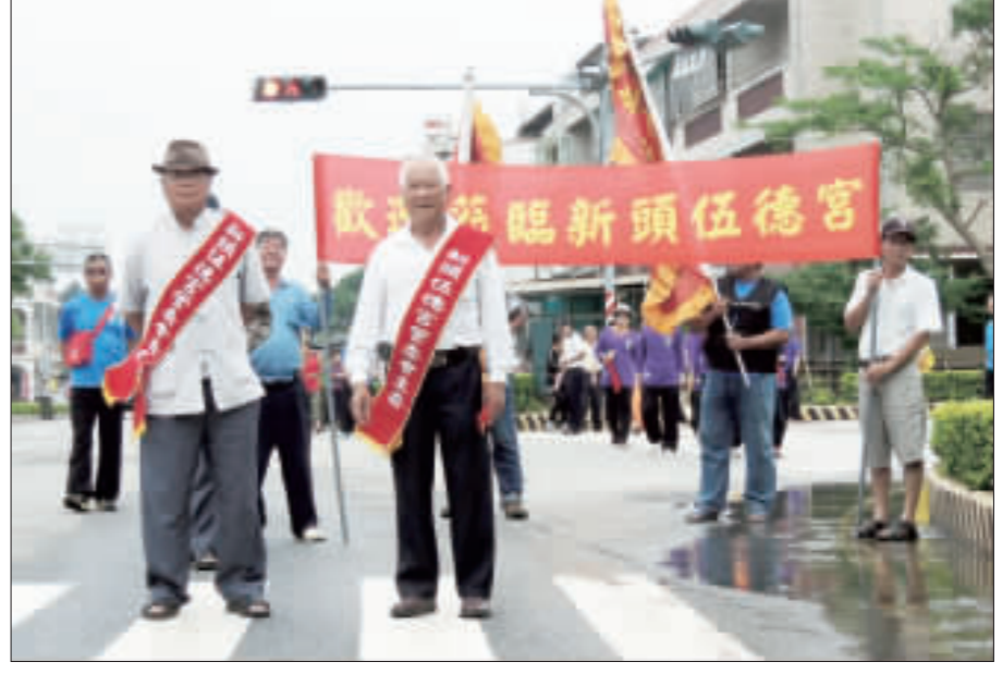
福建省晉江市東石鎮萬德殿昨(23)日來到新頭伍德宮進香。