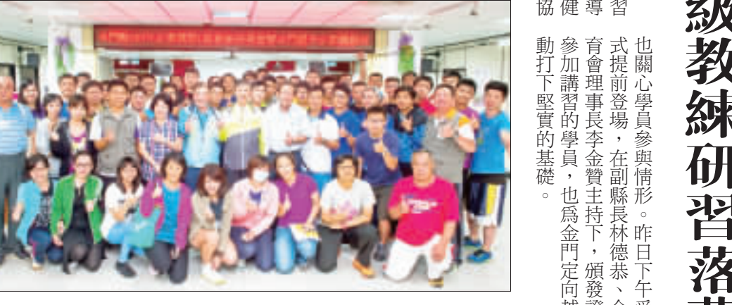
「105年金門定向越野C級教練講習」連三天舉辦，昨日圓滿落幕，內容紮實有趣。

記者陳麗好／金城報導 「105年金門定向越野C級教練講習」，二十一日起連三天假國教輔導團舉辦，由金門縣政府指導，金門縣體育會、金門縣健體領域輔導團、中華民國定向越野協會共同辦理。其中，金門定向越野協會日業已於二十二日辦理；而定向越野C級教練講習，自二十一日起連三天假國教輔導團（體育館）舉辦，共計有六十餘位體育館員參與，包括基層教練及主動報名參與的民眾，並於昨日下午四時圓滿結束。 連日來，活動受到各界重視，包括副縣長林德恭、縣府教育處處長李文良等到場向教練團致謝。