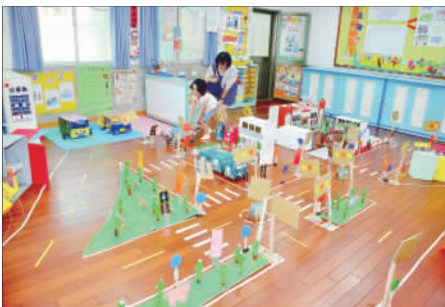
上、中、下：開瑄國小附設幼兒園舉辦成果發表，三個班級的小朋友不但當起老闆賣果汁，還親自做披薩，甚至做出迷你公車和城市街道圖。