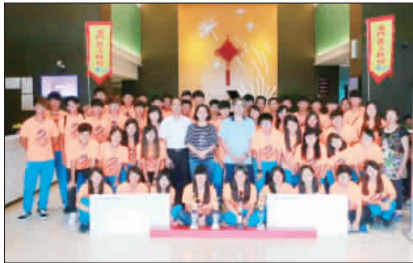
金門農工龍舟隊參加2016年「嘉庚杯」敬賢杯海峽兩岸龍舟賽，榮獲青少年女子組直道賽總成績第2名、女子不分組500米敬賢杯大獎賽第4名等佳績。

成立至今已逾10年，每年成績皆有顯著的進步，仰賴學校大力支持及教練團用心的指導，將龍舟團隊合作的精神傳承下來，學生每天早上進行辛苦的體能訓練，下午進行實際划槳訓練，日復一日，苦練接近半年才能有如此佳績。 金門農工校長劉湘金表示，金門與廈門僅隔隔一道水城，半個小時的船程，往來很方便，每個年度來參賽，結交很多朋友，做了很多方面的交流，尤其兩岸年輕同學彼此之間交朋友，帶隊老師也相互切磋開展社團活動，尤其在民族體育方面，開展非常好的交流，劉湘金說，組織學生前來參賽，有一個很重要的目的，就是通過龍舟賽，讓我們的學生懂得這樣的文化，瞭解中華文化博大精深的一面，而且能更好發揮團隊的精神。同時也肯定教練團的辛苦及學生認真投入的艱苦訓練。 另外，金門農工科際龍舟賽將於今日在大湖水域舉行，為響應端午節氣氛及強化本校特色及培養團隊精神，歡迎地區各界前往觀賞比賽。