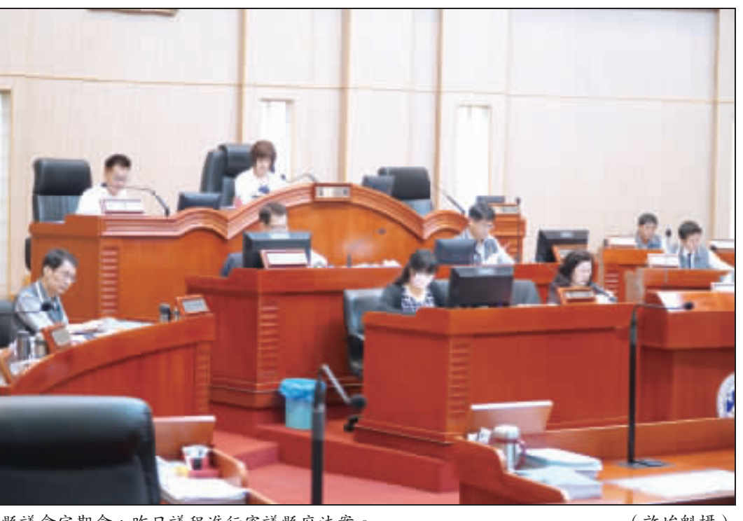
縣議會定期會，昨日議程進行審議縣府法案。