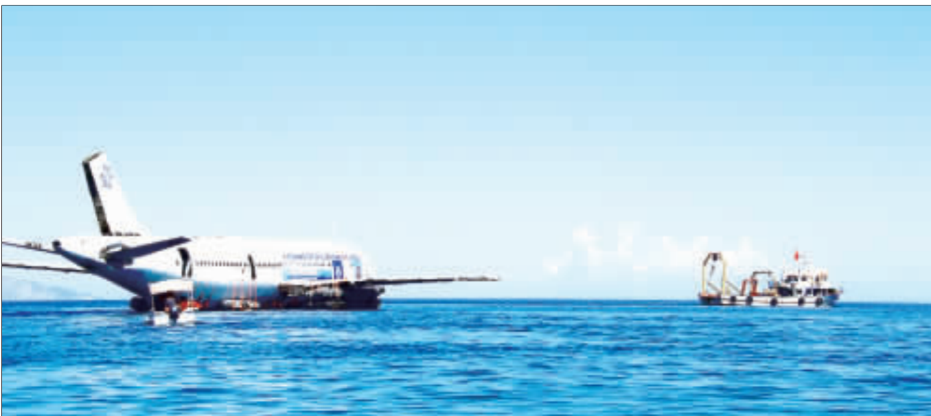
空巴客機沉海底 吸引觀光客新招

土耳其當局為吸引觀光業回籠，將1架空中巴士A300客機沉入庫達達瑟(Kusadasi)外的愛琴海。照片攝於6月4日。