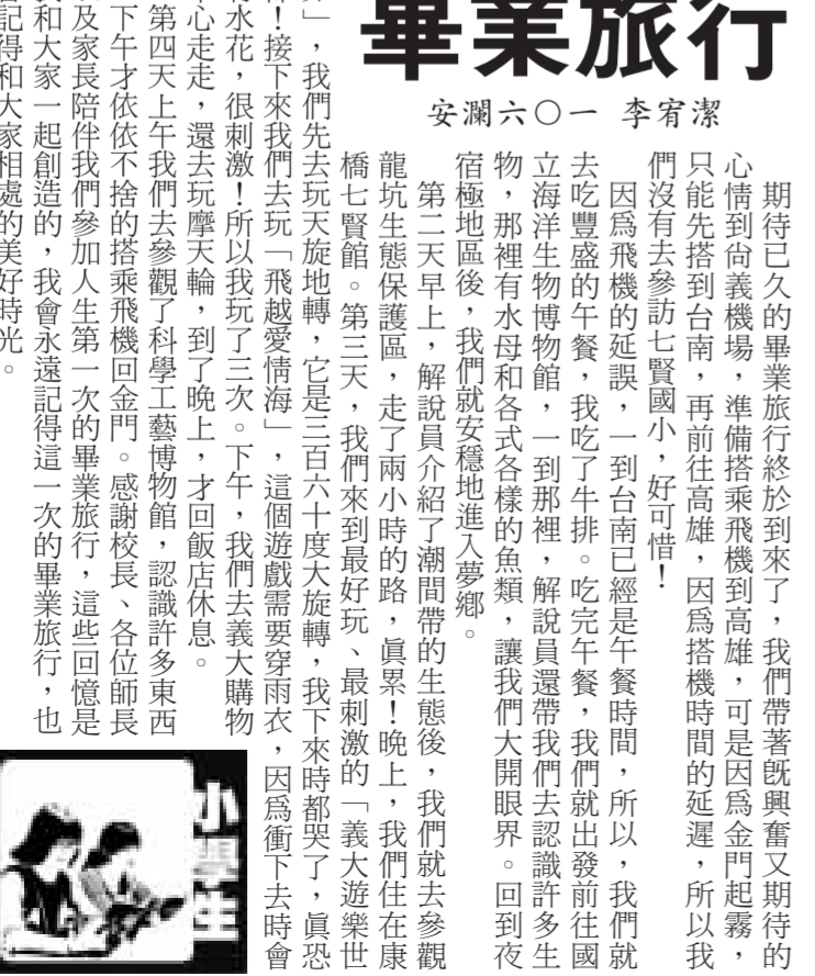
小學生投稿信箱 primary.kmdn@gmail.com, 來稿請以word格式, 並書明學校、姓名、班級。