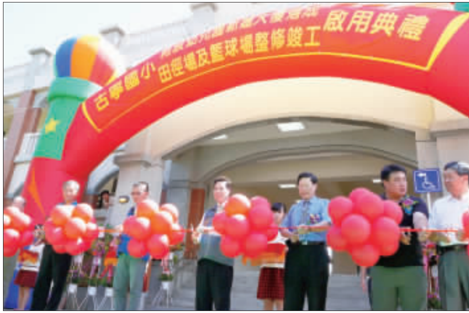
古寧國小附設幼兒園新建大樓落成暨田徑場及籃球場整修竣工啓用典禮，縣長陳福海、鄉長陳成勇等率領各界人士剪綵。

記者李金銓／金寧報導 金門縣政府地政事務所五十五歲至六十四歲105年端節慰助金業經金門縣政府地政事務所審核作業，符合申請資格之鄉親，慰助金款項新臺幣2100元已於105年6月7日匯入鄉親申請時所提供之郵局(土銀)帳戶內，不符合申請資格之鄉親，民政處亦將另行函請各鄉鎮公所協助轉知，敬請鄉親密切注意。 金門縣政府地政處長王中聖表示，陳