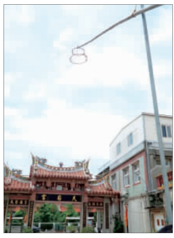
南濱王聖誕慶活動，現場設有擲炮台，歡迎民眾參加。

早期的南門是重要的港埠地點，現在天后宮的牌樓前方道路，在以前就是海岸港口所在，因此相當的繁華熱鬧，楊耀雲說，當時廟方也會找附近的商家贊助獎品，不僅如此，早些時候由於黃金價格較低，通報核