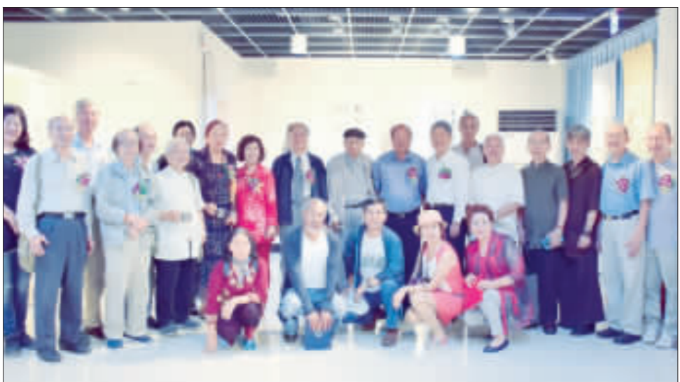
「2016台灣書畫名家活島交流展」在烈嶼文化館展覽，鄉長洪成發歡迎金兩地藝術家們共聚烈嶼，以文會友。

記者許加泰／烈嶼報導 烈嶼籍退將吳國勝邀請台灣多位書畫名家到烈嶼舉辦書畫展，並與金門書畫界同好交流，鄉長洪成發與藝術家共聚烈嶼，為鄉民帶來藝術的饗宴，也讓烈嶼充滿濃濃的藝術氣息。洪成發歡迎軍民、學生把握這一次參展的機會，到文化館感受藝術家相互交流、擊出璀璨的藝術火花。 吳國勝是著名的將軍書法家，結合同好成立了中華藝術學會，成員很多是退役將領，共遊於書畫世界，無論教學或聯展均成果斐然。在烈嶼鄉長洪成發的邀約下，吳國勝促成這一趟「2016台灣書畫名家活島交流展」的活動，邀請該會成員來金交流，並展出國畫、書法約30幅的作品，展期至6月14日止。來金交流的訪問團成員，包括：國防部前總政戰部主任陳邦治(訪問團團長)、中華藝術學會常務理事潘碧英、中華藝術學會會長吳國勝(訪問團團長)、中華藝術學會會長楊長年、中華藝術學會會長陶曉山、中國美術協會顧問陳飛、中國水彩畫研究會會長舒曾子、基隆書道會會長蔣夢龍、中華藝術學會常