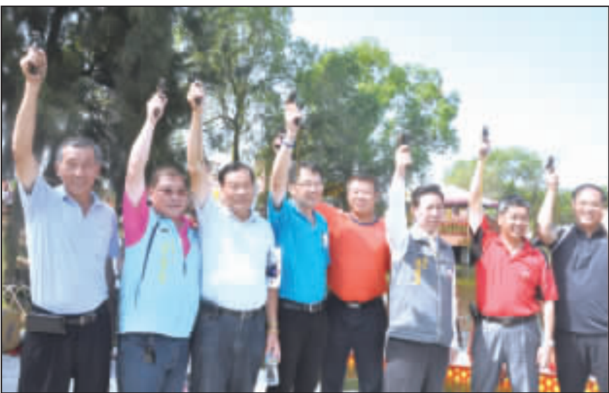
左、右：金門縣第八屆端午節龍舟賽昨日在古寧頭雙湖舉行，縣長陳福海為龍舟點睛，與來賓共同鳴槍下展開競賽。