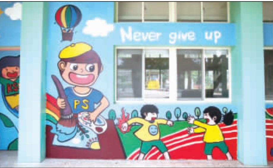
開瑄國小小別開生面的邀請畢業生彩繪校園，將校園生活、學習點滴彩繪在壁畫上，爲畢業留下永難忘的回憶。

記者董森堡／綜合報導 種植高產作物的農友們有福了！金門農試所表示，該所創新成大作伴服務農友，本所辦理契作申報服務，更提供農民快捷申報服務，更能提供農民申報服務及農業相關諮詢，來所申報並完成申報程序者(攜帶完整證明文件)將贈送宣導品沖泡茶壺一件，歡迎各位農友至本所辦理秋季高產申報作業。 金門農試所指出，該所推廣地區申報秋季高產契作農戶至農試所進行申報作業，不僅能加快申報流程，更能提供農民快捷申報服務，更能提供農民申報服務及農業相關諮詢，來所申報並完成申報程序者(攜帶完整證明文件)將贈送宣導品沖泡茶壺一件，歡迎各位農友至本所辦理秋季高產申報作業。