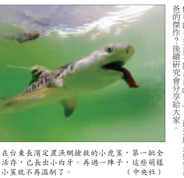
在台東長濱定置漁網撿獲的小虎鯊，第一批全部活存，已長出小白牙。再過一陣子，這些萌樣的小鯊就不再溫馴了。

為換川普 共和黨鬧分裂 【中央社記者鄭崇生華盛頓十七日專電】儘管共和黨總統提名川普已在初選中獲得足夠代表票數，但共和黨內部仍起「只要不是川普就好的」換人運動，在僅剩1個月就將舉行黨代表大會前，浮上檯面。 「華盛頓郵報」指出，這次行動由有經驗的共和黨遊說團體的數十名全國黨代表發起，至少來自15個州、約30名共和黨代表組成「最有組織的」反川普運動。但已拿到包括超額黨代表在內、共154張黨代表票的川普，早已拿到包括超額黨代表在內、共154張黨代表票的川普，早遠遠超越提名的27張黨代表票，換川普真能成事？ 報導指出，以共和黨科羅拉多州黨代表恩魯(Kendal Church)為首的反川普陣營，打算尋求共和黨全國黨代表大會(RNC)章程委員會(Kules Committee)的支持。 【中央社記者台東十八日電】日前在台東長濱定置漁網撿獲的小虎鯊，第一批38隻全部活存，且生命力旺盛，已長出小白牙。水試所說，再過一陣子這些萌樣的小鯊就不再溫馴了。 這個月13、14日在台東縣長濱鄉定置漁網分別捕獲已懷孕的母虎鯊，剖腹救出38和37隻小虎鯊，送到水試所東部海洋生物研究中心。 經過多日搶救，東部海洋生物研究中心主任何源興在臉書上發布「好消息」和「壞消息」。 何源興表示，第一批38尾的虎鯊仔體長80至90公分，在水試所東部海洋生物研究中心努力下，全部活存。 另外，第二批37尾虎鯊仔命運坎坷，當初捕獲母鯊懷孕尚未足月，虎鯊仔體長在60至65公分，足足比第一批少20公分，且呈現缺氧狀況，這幾天攝食情況不佳，陸續死亡，目前只活存4尾。 何源興表示，這些虎鯊仔不會白犧牲，目前已進行肌肉採樣及所有形質測量進行相關研究。虎鯊在發情時會有多個雌性伴侶，因此這批虎鯊仔可能「來自不同爸爸哦！」，而到底是幾隻爸爸的傑作？後續研究會分享给大家。