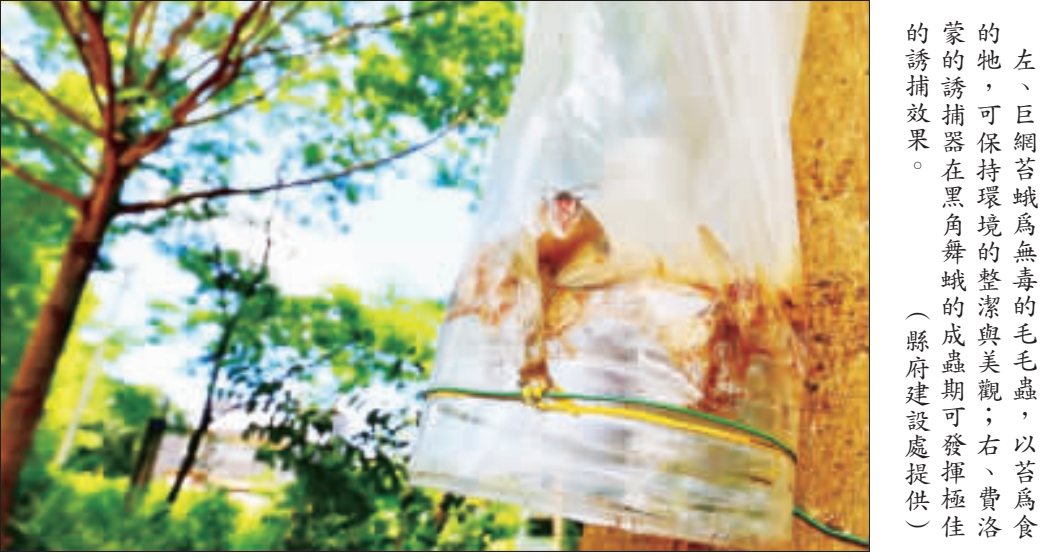
活動多年來一直是國內外游泳愛好者口耳相傳的經典賽事，游泳距離爲300公尺，在50公尺時折返，週邊有救生艇與救生員戒護，是夏天最棒的戶外運動之一。而爲了提供給泳士們最佳的環境及服務品質，限額50名，即日起至6月20日，凡愛好游泳者，年滿10歲以上，75歲以下，身體健康並具長泳能力，均以機關團體名義3人以上組隊報名，但爲安全起見，不接受個人報名。 至於金廈泳渡則於7月31日上午鳴槍出發，適逢雙年，今年路線由金門游向廈門椰風賽海灘，全程約7公里，預計參賽人數爲100隊200人，總獎金達30萬人名幣(約150萬新台幣)。去年比賽最佳成績爲來自中國的翁煒煒、韓傑雙子組，他們以1小時36分取得冠軍。另大會於上周末也選拔出台灣80位最佳選手，其中男選手莊子賢、卓承齊，女選手廖雨兒、曾婕娟也出席了這場記者會。 目前就讀新北市林口高中二年級的卓承齊，2年前第一次參加金廈泳渡，當年這位國內男子500公尺自由式紀錄保持人只獲得第5名，今年捲土重來，他自信說：「目標是第一！」 暑假後就要升上高三的卓承齊，也是備戰明年台北世大運公開水域項目，國內重點培訓的選手之一，他說，參與金廈泳渡算是暖身並提前爲台北世大運做準備。 同樣是奧特選手的女將曾婕娟也在這次台灣選拔中脫穎而出，記者會當天她和今年全大運摘下公開女50公尺自由式、100公尺自由式雙料金牌的墨俐兒一同出席。 墨俐兒主項是短距離，參加金廈泳渡要和搭檔一起完成7公里，她說笑說：「志在參加第一次參賽就當經驗，不給自己壓力，先以完賽當目標。」 責任編輯/陳清木