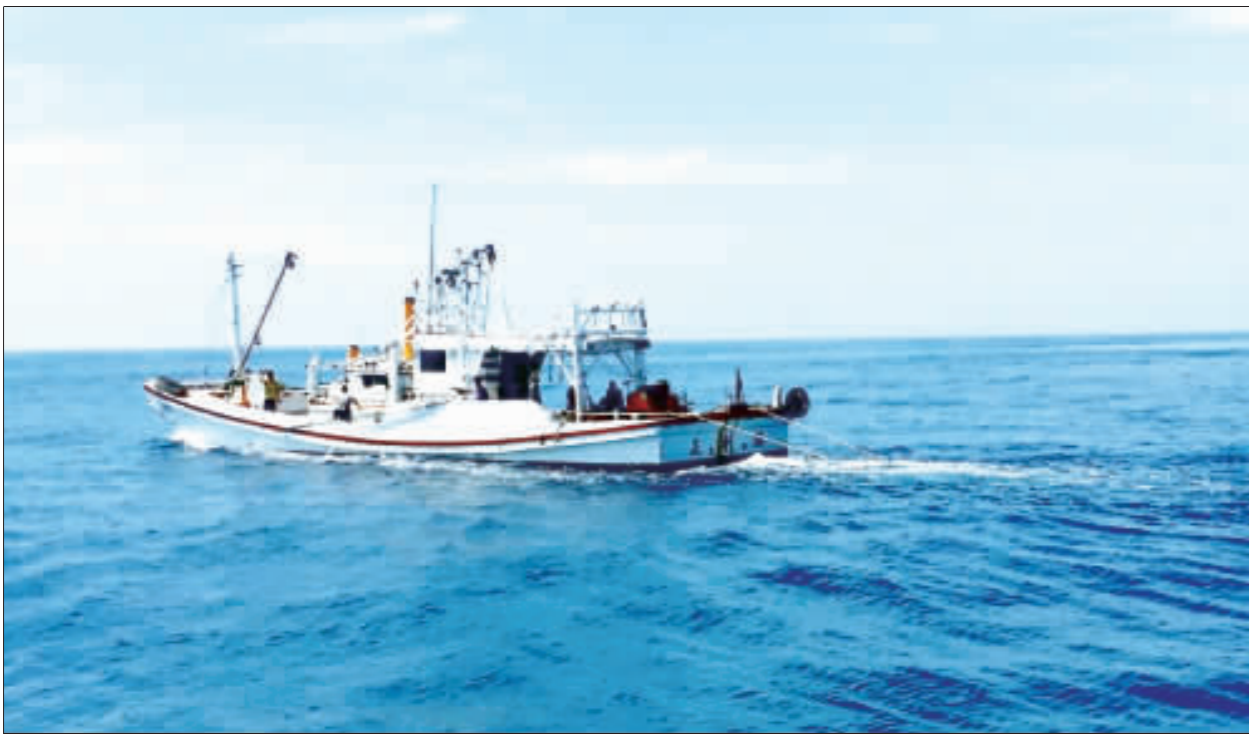
澎湖海域船難 台南海巡馳援 高雄籍翔利昇漁船1日在澎湖海域發生意外，台南海巡隊出動前往救援。

【中央社記者呂欣德台北1日電】海軍金江軍艦今天上午實施演習，在飛彈擊海附近海域有漁船發生船難。國防部證實，雄三飛彈造成漁船中間位置有貫穿現象，造成本國籍黃姓船長不幸身亡。 海軍金江軍艦上午8時15分實施雄三飛彈系統檢查測試時發生誤射，高雄籍翔利昇漁船在澎湖海域發生船難，造成傷亡，地點就在海軍誤射雄三飛彈擊海附近海域。 海軍司令部上午舉行記者會說明狀況，國防部下午再舉行記者會，國防發言人陳中吉表示，初步查證，造成本國籍翔利昇號黃姓船長不幸身亡，傷者經送往台南市立醫院治療後，都是輕傷，並已出院。 陳中吉表示，國防部對於不幸身亡的船長及受傷的船員，表達十二萬分歉意，並要求海軍司令部及相關單位全力做好慰問家屬及協助後續相關事宜。 海軍參謀長梅家樹表示，船中位置有貫穿現象，是雄三飛彈發射導引致誤射。