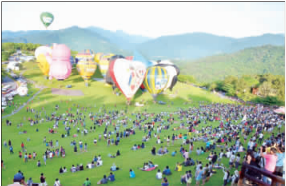
熱氣球升空 揭開璀璨夏日之旅 台東熱氣球嘉年華會1日正式登場，晨曦下，28顆熱氣球在遊客驚呼聲中，冉冉升空，將台東縱谷點綴的五彩繽紛，揭開璀璨的夏日之旅。(中央社)

【中央社華盛頓30日電】包含谷歌和亞洲多家公司的聯合集團宣布，由他們出資鋪設的一條海底電纜今天啓用，以加速太平洋洋寬頻網路。 這條5600英里(9000公里)長的「FASTER電纜系統」(FASTER Cable System)，目的在滿足北美和亞洲之間日增的寬頻網路需求。 FASTER管理委員會主席富斯浩克(Honorable Tadokoro，譯音)在聲明中說：「從計畫最開始，我們就不斷地告訴彼此『要更快、更快、再更快』。」 後來乾脆就將計畫命名為「FASTER」，今天它果然成真。 該計畫由中國移動、中國電信、馬來西亞Global Trunk、谷歌、日本行動電信業者(KDDI)和亞洲其他電信公司。 NEC公司(NEC Corporation)負責鋪設。 NEC海底網路部計畫經理米山謙一(Kenichi Yonayama，譯音)指出：「這條劃時代的電纜不只讓美國和日本受惠，整個亞太地區也雨露均霑。」 新加坡電信公司副總裁黃森傑(Or Sang Keat)說，這條新電纜一為雲端、影音串流、分析器和互聯網提供不間斷的連結和充足的高效能，有助刺激太平洋兩端數位經濟成長。 2017年公布設計計畫時，經費估計3億美元。這條海底電纜一頭在美國俄勒岡州(Oregon)，它也連結多個中心，以加速美國和亞洲其他地區的連結。