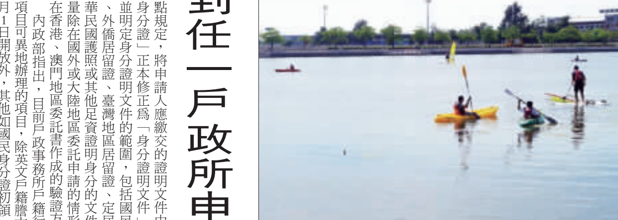
本縣國中小海洋教育資源中心推出國中小教師海洋教育增能風帆水域活動。

根據內政部表示，現行民眾申請英文戶籍謄本可至現戶籍地所在之直轄市、縣(市)政府所屬的任一戶政事務所辦理，為持續提供全國民眾更便利的服務，自7月1日起，新增開放「英文戶籍謄本」，可向任一戶政事務所辦理，並可修正「核發英文戶籍謄本作業要點」第5點規定。