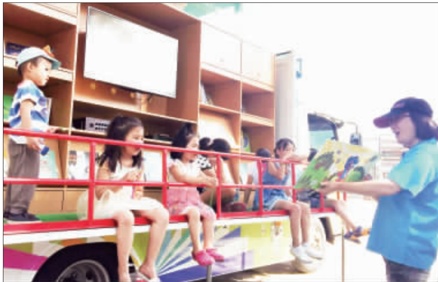
▲文化局圖書巡迴車金城站開跑，昨前往金水里及古城里辦公處舉辦，吸引民眾前往參與，孩童聽故事、讀繪本、有獎徵答獲精美小禮物，十分滿足。

記者陳麗好／金城報導 推廣閱讀，金門縣文化局今年新購圖書巡迴車，六月二十日起展開社區巡迴服務，將圖書資源、說故事的能量帶往社區，首站假烈嶼鄉舉辦，吸引三十餘位民眾踴躍參加，並借閱三百多本書。昨該巡迴車開始在金城鎮及古城里辦公處舉辦，不少孩童、親子或三五好友一起前往，聽故事、看書、借書，還將精美禮物帶回家，收穫滿滿。