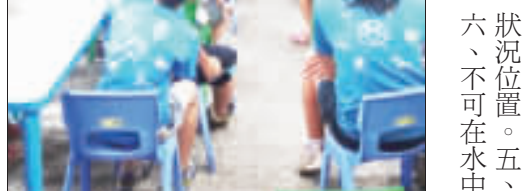
消防局金寧分隊日前前往轄區各學校向學子們宣講防溺，教導同學們如何正確使用救生圈。

記者許峻魁／金城報導 由沙美基督長老教會舉辦，為期三天的「錢進金銀島」兒童夏令營活動，順利結訓，昨(三)日上午在金寧福音中心舉辦一場別開生面的小小市集擺攤活動，也讓孩子們體認到，金錢不是憑空出現的，而是父母親們用汗水所賺取的。