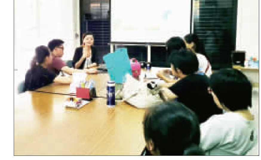
美心工作坊日前舉辦庇護性身心障礙員工之教育訓練及安全講習。

記者許峻堯/綜合報導 由社團法人金門縣康復之友協會所附設的「美心工作坊」日前辦理一場「庇護性身心障礙員工之教育訓練及安全講習」活動，針對員工的職能進行加強。