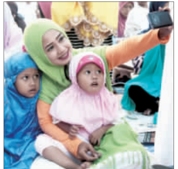
印尼開齋節6日登場，許多穆斯林一大早就扶老攜幼前往清真寺禮拜，並記錄這難得的一刻。(中央社)

【中央社記者郭正瑄屏東報導】屏東小琉球保育的綠海龜常因人為因素死於非命，包括纏到漁網及吃進塑膠袋等，大鵬灣國家風景區管理處製作「沒有煩惱的小島」小琉球海龜MV，不到1週，突破百萬人次觀看。 影片主要講述海龜們現在因為塑膠大量使用、海中垃圾增加所遇到的生存挑戰，間接傳達友善環境的旅遊方式，藉由1名都市女孩騎著電動腳踏車賞遊小琉球，並下海撿拾海中垃圾，最後一片垃圾時，遇見大海龜跟她道謝，整部片由一首輕快歌曲「這是一首沒有煩惱的小島」串連並講述故事。 影片6月30日上线，不到1週，在各新聞媒體平台上看，突破百萬人次觀看，多個臉書粉絲團專頁貼文分享，逼近1萬次轉分享，也讓不少網友留言表示，「這是要留了會讓人掉淚的影片」、「我們要當一個有品的觀光客，用塑膠袋」等。 管理處表示，「沒有煩惱的小島」MV是大鵬灣國家風景區管理處特別委託「看不見電影工作室」製作，希望藉由故事與音樂向國人喊話，「來到小琉球進行一趟低碳減塑(速)的旅行！」