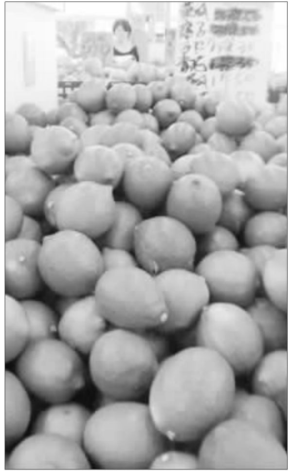
6月水果貴3成5 逾10年最大漲幅 主計總處公布6月CPI，年增0.3%，但食物類漲幅逐漸縮小，物價仍算平穩。其中，水果漲幅0.8%，為12個月來最大漲幅，等於平均每家戶家庭在6月，單單水果消費就多出49元。 (中央社)

中央銀行發行的「傑出女性」系列特展，本特展以傑出女性為主題，共展出56張國外鈔券。央行發行的「傑出女性」系列特展，本特展以傑出女性為主題，共展出56張國外鈔券。央行發行的「傑出女性」系列特展，本特展以傑出女性為主題，共展出56張國外鈔券。