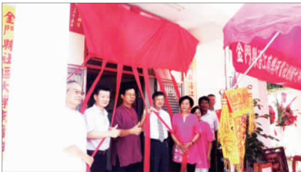
「浯江南樂研習社」正式於金沙鎮公所舊址進行揭牌儀式，並辦理創社十周年慶祝活動，現場並進行兩岸南音交流大會唱。