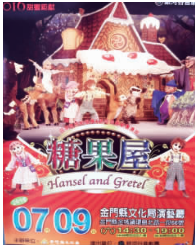
銀河谷音劇團「糖果屋」七月九日假文化局演藝廳連演兩場，文化局歡迎民眾踴躍到場參與。

記者陳煥好／金城報導 銀河谷音劇團「糖果屋」七月九日假文化局演藝廳連演兩場，文化局歡迎民眾踴躍到場參與。