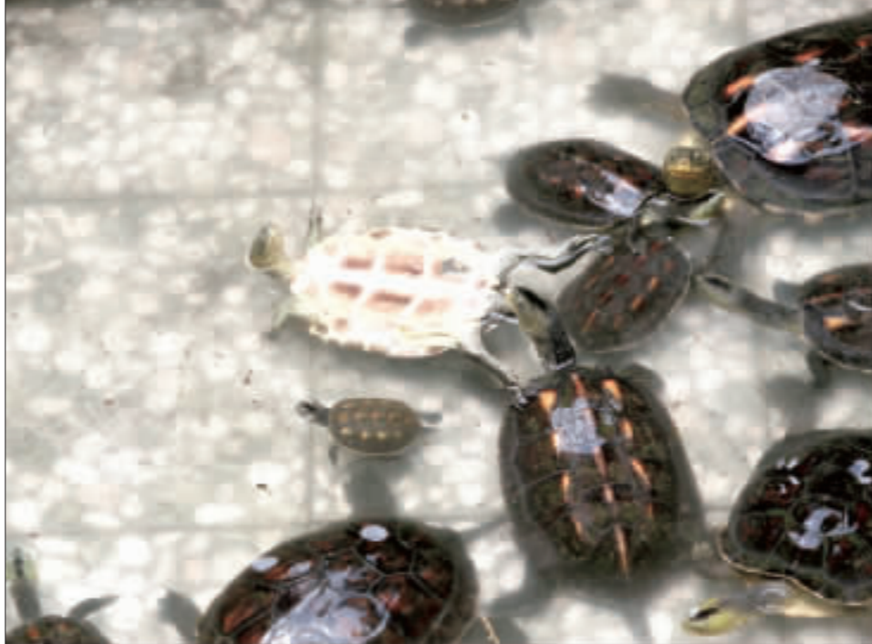
仰式烏龜是跳水失敗，無法翻身。

【中央社記者張榮祥台南12日電】「你看，烏龜游仰式。」台南南門廟水池中，一隻烏龜被發現「背腹上」游泳，遊客搞不清楚為何會這樣，直到有些烏龜跳水池，才知道仰式烏龜是跳水失敗，無法翻身。 【中央社記者張榮祥台南12日電】「你看，烏龜游仰式。」台南南門廟水池中，一隻烏龜被發現「背腹上」游泳，遊客搞不清楚為何會這樣，直到有些烏龜跳水池，才知道仰式烏龜是跳水失敗，無法翻身。