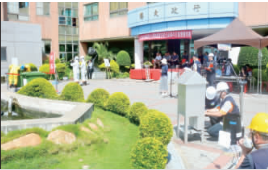
左、右：環保局在金門縣自來水廠辦理「化學物質暨空氣污染事件災害應變演練」過程相當逼真。

他也表示，發生化學物質災害時，應立即通報，並採取必要之緊急處理措施，以減少對環境及人體健康的影響。 環保局長陳博東在演練時指出，演練各單位間的協調與合作均能確實完成救災的任務，於災害發生第一時間立即搶救，防止污染擴大大面積。此外，演練化學物質暨空氣污染事件處理作業程序時，各相關單位之互相聯繫及支援管道皆非常確實，強化了整體救災的能力。