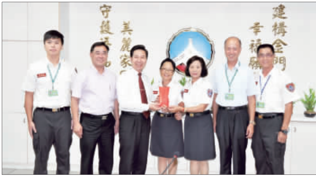
105年第3次公共安全督導會報昨召開，縣長陳福海並頒發獎金二萬元予榮獲105年全國婦宣評鑑「特優」的金沙婦宣分隊。