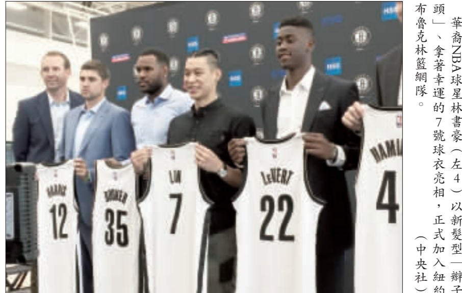
華裔NBA球星林書豪(左4)以新髮型「辮子頭」，拿著幸運的7號球衣亮相，正式加入紐約布魯克林籃網隊。

林書豪加盟籃網 魅力四射再現林來瘋 【中央社記者黃兆平紐約20日專電】就像襲擊紐約的熱浪一般，NBA布魯克林籃網今天介紹6名新球季新書，加盟籃網的華裔球星林書豪正式亮相，受到的矚目也是最多，讓人感覺「林來瘋」熱情再回到紐約！ 籃網下午在布魯克林「日落公園」(Sunset Park)的EUS訓練中心舉行記者會，6名新球季正式加入籃網的球員，林書豪以新髮型「辮子頭」，拿著象徵幸運的「7號」球衣亮相，格外醒目。 不同於2013年球季在尼克隊的板凳選手，27歲的林書豪加入籃網將擔任先發主控，可望為他及上球季聯盟倒數第3的布魯克林籃網帶來嶄新氣象。 籃網給予林書豪3年3600萬美元報價，平均年薪2000萬美元，算是相當豐厚，讓拒絕其他球隊邀約的林書豪也坦言充分感受到籃網的誠意。 籃網總教練亞特金森(Kenny Atkinson)強調，「將借重林書豪的領導氣質與能力帶動球隊士氣」，他將擔任先發主控，得分後衛。 林書豪則說，以前在尼克隊是「為工作而戰」，這次回來是「為工作而戰」，已做好心理準備，心理素質更勝之前，在場上的壓力已不再困擾他。4年之後，從尼克隊出走，到休士頓火箭隊、洛杉磯湖人隊、夏洛特黃蜂隊，再回到紐約，加盟尼克隊死對頭籃網，林書豪已非吳下阿蒙，更在華裔社區引起高度關注。 林書豪說，「不管是華人、亞裔美國人或亞裔，在我心中都有特殊地位」，這次回到紐約，希望激勵鼓舞下一代華裔青年，同時要走向社區。 根據美人人口普查2010年記錄，大紐約地區擁有57萬多名華裔人口，是除了亞洲之外最大的華裔人口都會。布魯克林籃網主場距離紐約華埠只有一橋之隔，預期未來將吸引大批亞裔及華裔球迷湧進。