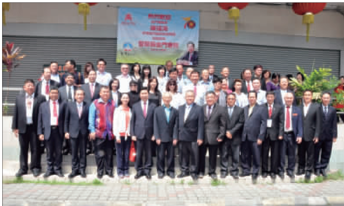
金門鄉親·鄉情永固 上、金門縣長陳福海昨率縣政府東南亞宣慰社訪問團拜會雪蘭莪金門會館，時值會館建館七十週年，陳縣長致贈匾額致賀，祝會務昌隆；下、金門縣長陳福海率縣政府東南亞宣慰社訪問團與雪蘭莪金門會館人員合影。

記者楊水詠／雪蘭莪報導 金門縣政府東南亞宣慰社訪問團昨(廿四)日來到雪蘭莪，在縣長陳福海率領拜會當地金門會館，受到僑親熱忱歡迎，並以濃厚的鄉情味道，時值雪蘭莪金門會館創館七十週年，陳縣長致贈一方匾額致賀，並說金門家鄉正處於最佳發展時機，歡迎僑領和僑親返鄉投資金門、建設金門，共促此項。 陳縣長說他自就任縣長一年半，感謝鄉親給他機會為地方做一點事，也為海內外鄉親服務；從政有二、三十年，對於金門未來發展了解發展方向在那裡，並期許自己是百萬金門人的縣長，也會全力來建設和發展金門，讓金門家鄉明天更美好！ 陳縣長表示此次到東南亞僑社訪問，主要是了解僑社發展狀況和連結鄉親，而僑親對家鄉的貢獻，也是為了進一步鞏固金門。