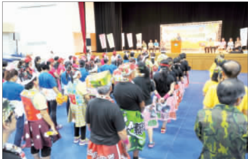
左、右：環保局昨日假金湖體育館舉行105年金門縣環保志(義)工知識競賽地方初賽，下午並辦理「低碳永續家園認證評等計畫」頒發證書，將環境知識以寓教於樂的方式傳達至志工心中、推展環保運動。