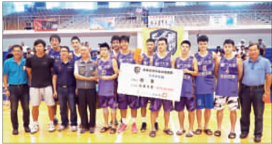
「金城盃籃球賽」，菁英組冠軍廈門大學。

菁英組：1.廈門大學2.金酒3.臺師大 社會組：1.金一建設2.中州科大3.料羅