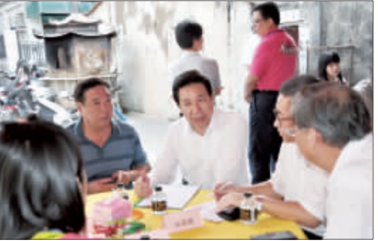
縣長陳福海在親民日中受理親鄉情土地相關事宜。

「防救災緊急通訊系統維護與考評」成績出爐，金門縣政團隊滿分一百，名列冠軍。這是繼民國101至103下半年度全國第一名之後，第四年獨占鰲頭，消息傳來，縣長陳福海深表嘉許，團隊成員同感振奮。 根據了解，內政部針對中央各機關、直轄市、縣市政府及所屬機關、鄉鎮市區公所補助配置防救災專用緊急通訊設備，透過自檢測試、教育訓練，促使各機關熟悉相關設備，藉以定期測試及故障報修之紀錄，藉由不定期實施之訪視，據以檢測各機關之工作績效與檢討策進，作為整合現有防救災緊急通訊資源，強化防救災緊急通訊應變制變能力，政策正確，頗有好評。 本縣目前擁有防救災緊急通訊設備配置者，計有消防局、警察局、衛生局、環保局及各鄉鎮公所，相互密切配合，構成防救災安全網，除由內政部消防署每年定期辦理縣轄單位自主測試，保持縱橫通訊暢通，對於保養維護事宜，不厭其煩，要求從嚴，由上而下實施逐級考評，意義重大，影響深遠，縣政團隊考評中脫穎而出，蟬聯全國四年第一，難能可貴，實至名歸。 科技進步，日新月異。政府基於消防工作之需求，全面建立靈敏暢通快速通訊體制，訂定完整可行作業程序，通貫貫徹實施，有其核心價值。金門雖然位處離島，各項資源不豐，然而各級單位承辦防救災業務工作同仁，無論編內編外，深知責任所在，夙夜匪懈，堅守崗位，敬業樂群，無怨無悔，平日各盡其職，遇有災害意外狀況，莫不火速動員趕赴現場，分秒必爭，冒險犯難，赴湯蹈火，救人第一，消災為先，犧牲奉獻，義無反顧，以期確保人民生命財產安全。緣此警政與消防機關，分隸而不同家，所負責任之任務，皆與民眾平日生存與生活關係密切，哪裡有需要，就往哪裡去，盡忠職守，勇於擔當，「人民保衛」，「打火弟兄」，既信賴又放心。 此次中央年度考評金門榜上獲名，其中點點滴滴，有血有淚，由於消防袍澤同心，一本初衷，落實執行，具體成效，立竿見影，各級核心幹部領軍得法，將士用命，守法重紀，責任感榮譽感兼而有之，益見一個團隊行政工作效率是否達標，上下同心同德，群策群力，公而無私，合作無間，實事求是，凡此乃係關鍵。 金門雖小，聲名在外，長期以來，屢在中央考評序列有「一」有「譽」者，不勝枚舉，如在全國各縣市施政滿意度調查，金門創下「五星級」新紀錄，而警政、環保、社安、社會福利等更是辦得有聲有色，領先群倫。最近首獲推動「親民日」，定期傾聽基層心聲，解決民瘼，強化服務績效深度，與評及反應良好，有耕耘就有收穫，有深度即有高度。 金門縣政團隊失動失勇，與全民站在一起，為他山之石，可以攻錯。「見賢思齊，有助長進。至盼大家相互學習，再接再厲，繼續邁步向前，讓金門發光發亮。