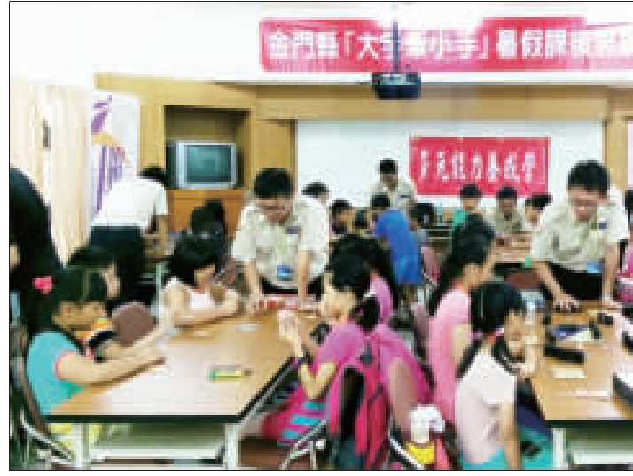
上、下：救國團、校外會兩梯次「多元能力養成營」-大手牽小手課後照顧活動圓滿落幕，今年推出城市規劃師、分齡桌遊體驗，深獲好評。