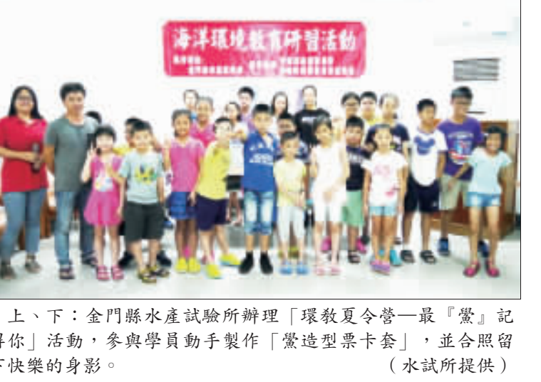
上、下：金門縣水產試驗所辦理「環教夏令營」第一屆「記得你」活動，參與學員動手製作「製造型票卡套」，並合照留下快樂的身影。