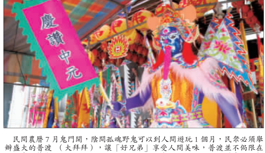
民間農曆7月鬼門開，陰間孤魂野鬼可以到人間遊玩1個月，民眾必須舉辦盛大的普渡(大拜拜)，讓「好兄弟」享受人間美味，普渡並不侷限在15日中元節當天，從7月1日至30日任何一天都可以。

【中央社曼谷12日綜合外電報導】泰國警方今天表示，在南部觀光重鎮造成4人喪命的連環爆炸案，是當地破壞分子所為，本質上不是「恐怖份子」。 法新社報導，國家警察局發言人皮雅潘 (Piyapan Pringnang) 在曼谷告訴記者：「那不是恐怖攻擊，只是侷限在有限區域和省份的破壞分子。」 他表示，過去24小時泰南5省至少發生11起爆炸，其中許多是同時發生兩處爆炸，造成4人死亡、數十人受傷，包括外國人。