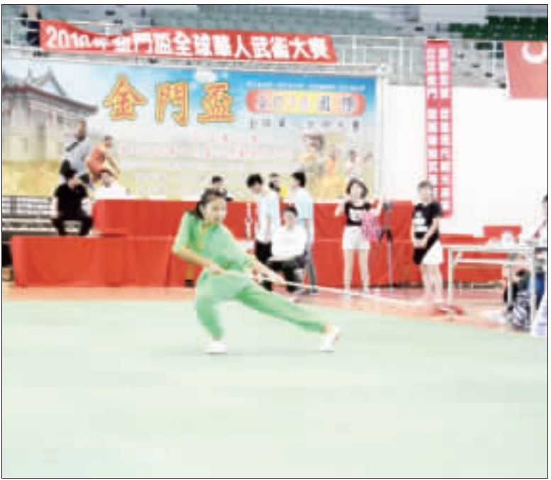
以「金門盃」全球華人武術大賽一連二天在金門縣立體育館盛大舉行，來自兩岸及世界各地的武術代表團齊聚金門以武會友，角逐武術盟主，並於昨日下午圓滿落幕，由「北京武術文化交流團」勇奪技擊武術盟主，「香港中國武術海外訓練學院」拿下傳統武術盟主，印度中華武術團榮獲中年男子太極武術盟主，加拿大大陸武術隊勇奪太極武術盟主，而地主隊金門體育會太極拳委員會則保住內家武術盟主的寶座。