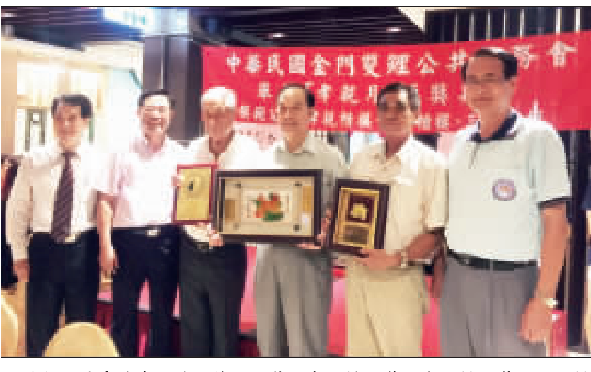
雙鯉公共事務會頒發模範父親獎、孝親楷模獎、志工楷模獎、三好楷模等四個獎項，副縣長吳成典(左二)也到場祝賀。

記者許加泰／金城報導 中華民國金門雙鯉公共事務會孝親月活動，辦理關懷弱勢族群、老人長照研習活動(暨「孝親月」頒獎典禮)等一系列活動，金門縣副縣長吳成典也帶來縣長陳福海的心意，並應邀頒獎，鼓勵和關懷。