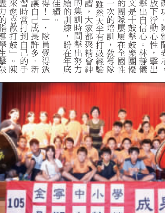
寧中小學暑期太鼓營結訓展成果。

金寧中小學擊鼓隊在十鼓擊鼓樂團專業人士的授課下，隊員於昨日暑期結訓，展現了精湛的打擊技藝。隊員們在舞台上展現了精湛的打擊技藝，展現了精湛的打擊技藝。