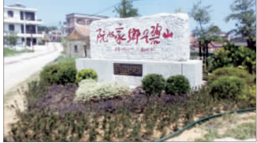
碧山詩碑經過美化後，詩碑周邊已呈現出與之前全然不一樣的景觀和面貌。