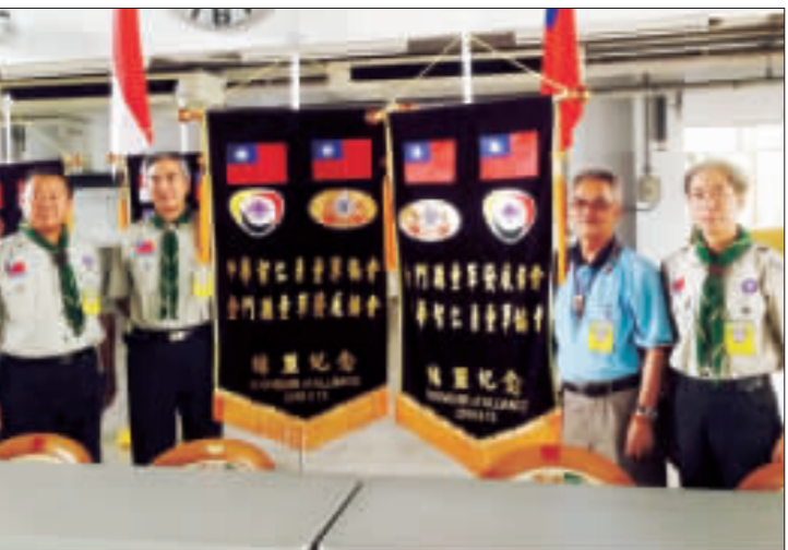
上、下：金門縣童軍發展協會與中華勇軍協會代表完成簽約儀式並合影留念。