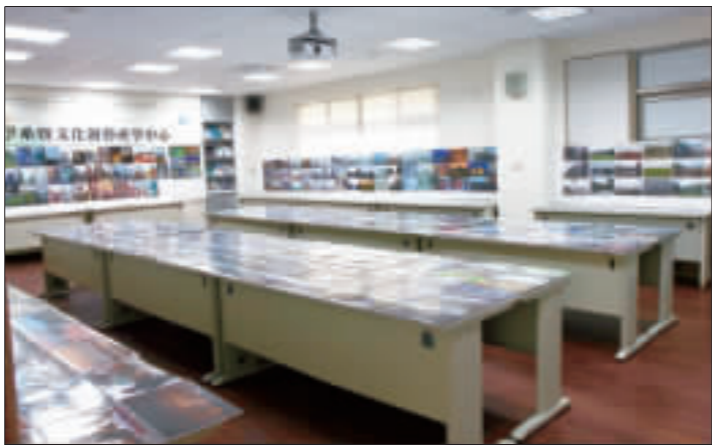
文化局「霧裡金門攝影比賽」，入圍名單揭曉，可至官網查閱，名次定於頒獎典禮現場公布。

金門縣文化局表示，辦理「霧裡金門攝影比賽」，希望以「霧」展現出金門人文、活動、風情的景觀。現出圍名單將於十月三十日頒獎典禮現場公布。 金門縣文化局表示，辦理「霧裡金門攝影比賽」，希望以「霧」展現出金門人文、活動、風情的景觀。現出圍名單將於十月三十日頒獎典禮現場公布。