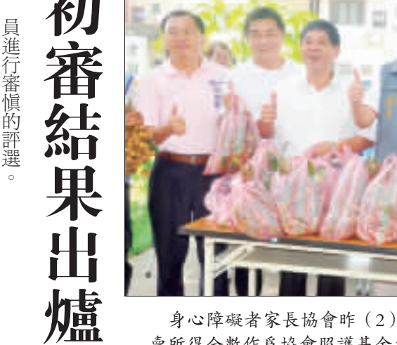
身心障礙者家長協會昨(2)日舉辦「愛心龍眼義賣活動」，義賣所得全數作為協會照護基金之用。

記者陳冠霖／金湖報導 身心障礙者家長協會昨(2)日在協會外廣場舉辦「愛心龍眼義賣活動」，義賣所得全數作為協會照護基金之用。代表元給協會，愛心不吝落人後。身心障礙者家長協會也說，最近志工短缺，呼籲有興趣的鄉親可以到協會來幫忙當志願服務。