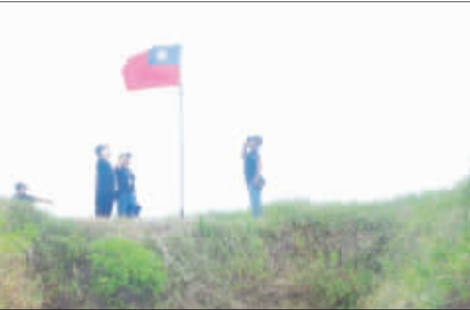
左、大叔們在當年當兵的老營舍前合影；右、大叔們為老營舍插上嶄新國旗，並行舉手禮。

記者陳冠霖／金湖報導 「男兒立志在沙場，馬革裹屍屍莫壯」，今天是九三軍人節，一群20多年前在金門當兵的大叔們，昨(2)日從台灣飛到金門來，回到位於峰上的當年老營舍，在連集合場上整隊、踏步、唱軍歌，重溫當年當兵情景。大家也幫老營舍整理環境，並換上嶄新的國旗。