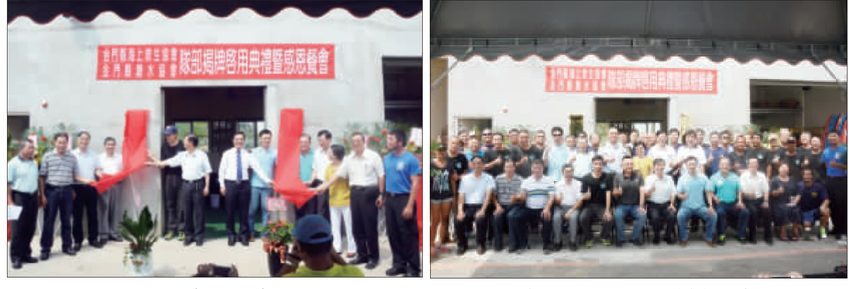
左、右：金門縣海上救生協會暨潛水協會隊部揭牌啟用典禮，副縣長吳成典、縣府秘書長林德恭、立委楊鎮浩等貴賓到場參與揭牌典禮並合照。

吳成典、林德恭、楊鎮浩等貴賓到場祝賀 肯定對於金門發展海域觀光活動 安全上更有保障