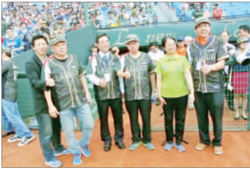
左、右：桃園市金門日職棒嘉年華金門鄉親與觀眾湧入青埔球場，活動盛大圓滿。