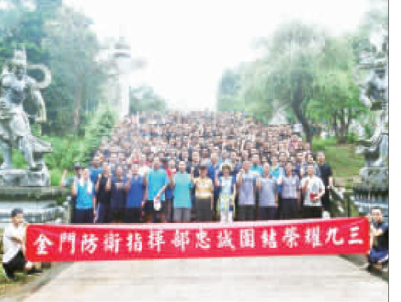
九三軍人節，金防部舉辦登大武山健行活動，近百位官兵兄弟共同登大武山，強身健體。

記者陳冠霖／金湖報導 昨天是九三軍人節，金防部一大早舉辦登大武山健行活動，出動防區近百位官兵兄弟共同登大武山，強身健體，甚至邊登山邊唱軍歌，聲勢浩大。 金防部中將指揮官郝以知表示，國軍來自民間，軍隊的戰鬥需要民力軍力的支持，人民的生活需要國防武力的保護，軍隊與人民是不可分割的。國軍是保衛國家、安定社會、造福百姓的忠誠勁旅，每位官兵都抱持「與人民在一起」的信念，充分踐履「軍愛民、民擁軍」的責任，在崗位上兢兢業業，人人秉持一股為國家犧牲奉獻的熱忱，期藉「己之力，讓民眾安居樂業」。 郝以知強調，提升軍人尊嚴的第一步，就是落實「軍愛民、民敬軍」，「敬軍」不必拘泥於形式與時空的限制，一句加油、一聲謝謝，就是足以振奮官兵兄弟姊妹們的內心，讓他們以身為軍人為榮，以穿上軍服為傲，堅守崗位，捍衛國家。 金防部指出，九三軍人節，象徵抗戰勝利的光榮意義，更是先賢前輩用血淚，甚至是生命換來的國家生存與發展，金門在32戰役砲火無情的摧殘下，靠著軍民同心共同守護中華民國，軍民情感血濃於水；金門縣長陳福海在各鄉鎮首長陪同下，特別在軍人節前夕，拜訪金門地區防衛指揮部，受到官兵熱烈歡迎，充分展現「軍愛民、民敬軍」的精神，陳縣長特別表達民眾非常感謝國軍長期在金門地區守護。 活動獎項將擇特優、名獎金新台幣8000元、優等一名獎金新台幣3000元、優選一名獎金新台幣2000元，佳作10名獎金新台幣1000元。(各項獎金需依中華民國所得稅法扣繳所得稅) 得獎名單將於近日內親臨或由委託人至該所領獎，逾期視為棄權，棄權者不得異議。 在評審及公布方面，農試所將聘請專家組成評審委員會評選，得獎者以電話通知並於該所網站公布，得獎人於領獎日未能親自到場者，請於領獎日起十日內親臨或由委託人至該所領獎，逾期視為棄權，棄權者不得異議。