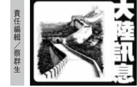
大陸訊息 責任編輯/蔡祥生

萬里長城保存狀況堪憂，其中明長城已有1/3完全消失。大陸的中國文物保護基金會發動網路募資（群眾募資），集合大眾力量修長城。 中國青年報報導，「長城保護2015」活動一啟動，在騰訊公益樂捐平台進行網路募資。這是文物保護領域第一次採用「互聯網+公益」方式進行募資。 中國長城學會常務副會長董耀會在記者會上說，世界遺產萬里長城保存狀況堪憂。以距今最近的明長城為例，人工牆體長度僅剩20%左右，保存較好的只有8%，保存一般的近30%，已消失的占22%。