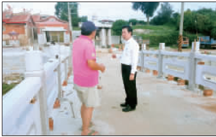
縣定古蹟官澳龍鳳宮將於國曆11月29日、30日舉辦重修莫安典禮，縣長陳福海昨日下午特別前往視察龍鳳宮週邊環境整建一期工程進行情形。