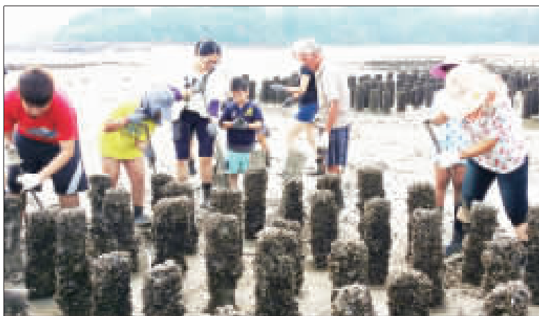
水試所舉辦採蚵體驗活動昨假古寧頭北山石蚵養殖區展開開蚵體驗。

另為提升小朋友對環境保護之概念，特別結合環保公園低碳教育館場域以資源回收物製作玩具及遊戲，學童們熱情參與課程，現場充滿了歡笑與掌聲。活動最後以創意繪圖及心得分享，帶領環保小尖兵們省思生活週遭的環境問題，並填寫學習單及立下碳中和承諾，從日常生活中的小地方處處留意，由這些小動作達到節能減碳之目的。 為鼓勵小朋友成為富有環境保護及節能減碳素養之環保小尖兵，課程完結後並頒發環保小尖兵證書，讓這些小環保尖兵們在學習中互相成長，並加緊對我們生活環境、土地情感及愛國關懷，以達到深耕金門樂活低碳島之目標。 環保局辦理二梯次「環保小尖兵、低碳社區生活智慧營」活動，吸引國小學童踴躍參與，加深對生活環境的關懷以及環保知識的提昇。