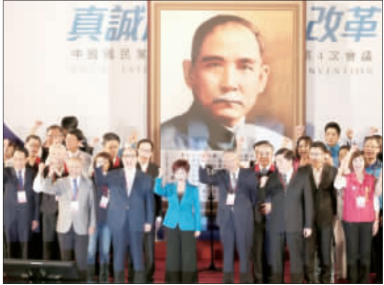
國民黨第19次全國代表大會第4次會議4日在陽明山中山樓舉行，這是國民黨在野後首度全配大會。國民黨主席洪秀柱在4位副主席、全體中常委、黨籍立委陪同下，走進會場，展現團結氣勢，現場高喊「國民黨加油」，氣氛熱烈。

【中央社記者謝佳珍台北4日電】中國國民黨主席洪秀柱今天表示，將對縣、市黨部主委直選提案成立專案小組，擬定全配後配套推動；但改革非一蹴可幾，民進黨地方黨部主委直選，有無偏差，可做為國民黨參考。 國民黨第19次全國代表大會第4次會議今天在陽明山中山樓舉行，這是國民黨成黨後在野黨首度全配大會。 洪秀柱在閉幕典禮致詞時說，國民黨今日局面，比2008年首度失去政權還要艱苦百倍，但不管民進黨如何趕盡殺絕，國民黨絕不會被消滅，因為邪不勝正，因為正義無罪，因為歷史必有公正的裁判。 對於通過地方黨部主委直選提案，洪秀柱說，任何方案，只要能擴大參與、扎根基層、強化改革，她都會大參與、大力支持。事實上，這會使國民黨走向更開放、更民主。 洪秀柱表示，她上任以來，對黨部主委採取在地用人、用在地人的原則，希望藉此強化中央和地方的連結，讓國民黨組織更能落地生根。 她說，為廣納人才新血，同時降低未來黨產被清算、鬥爭的衝擊，也致力將黨的組織朝扁平化、年輕化與志士化，以利未來國民黨能與地方密切結合，並且發揮黨務的功能，強化基層黨員參與黨務一直是國民黨追求的目標。 洪秀柱指出，會針對落實黨部直選提案內容，成立專案小組，研擬周全配套，例如直選出的主委資格、任期、對黨員及中央的權利義務、黨務經費等，等研擬妥當後，會盡速推動。 她認為，任何改革都非一蹴可幾，許多黨員也曾指出黨部直選的利弊得失，尤其民進黨的地方黨部主委也是由黨員直選，但是有無偏差與缺失，也是黨員直選，但是有無偏差與缺失，社會的觀感、評價如何？不言而喻，也可做為國民黨的參考。 洪秀柱說，對國民黨同志很有信心，身為國民黨主席，更有責任把直選制度設計完善，以免黨在廢案中重建且正厲行改革之際，結果未蒙其利先受其害。就像過去某些地方初選，因為競選激烈，導致地方派系紛爭，反而可能造成黨內衝突與混亂。