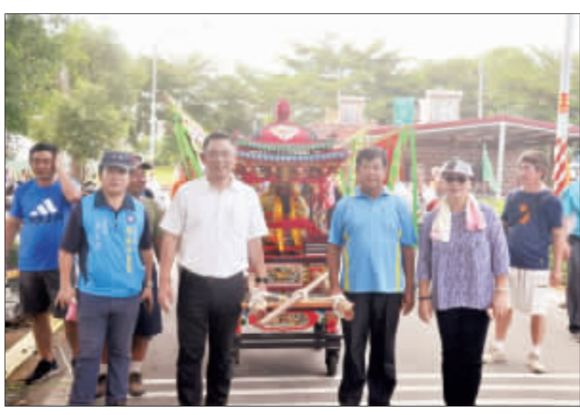
榜林村宏濟殿醮慶典與朱府王爺祝壽，立委楊鎮浩扶著轎轎參與巡境。

、雨漏，鄉紳耆老咸議重修，為昭慎重，經推派代表赴頂后按請祀王爺駕臨開示而訂議，經由下堡爐下鄉88年先緣捐發起勸募，四方信眾熱烈響應捐款襄贊，於88年10月7日動土興建，經二年後落成，90年為迎神賽會所需，於旁加建一棟釋仔寺。宏濟殿奉祀神明有朱王爺、金王爺、李王爺、溫王爺、殿官爺、太子爺等等神駕，如今信眾雲集，香火鼎盛，為地區鄉親信仰中心及精神庇祐之所。