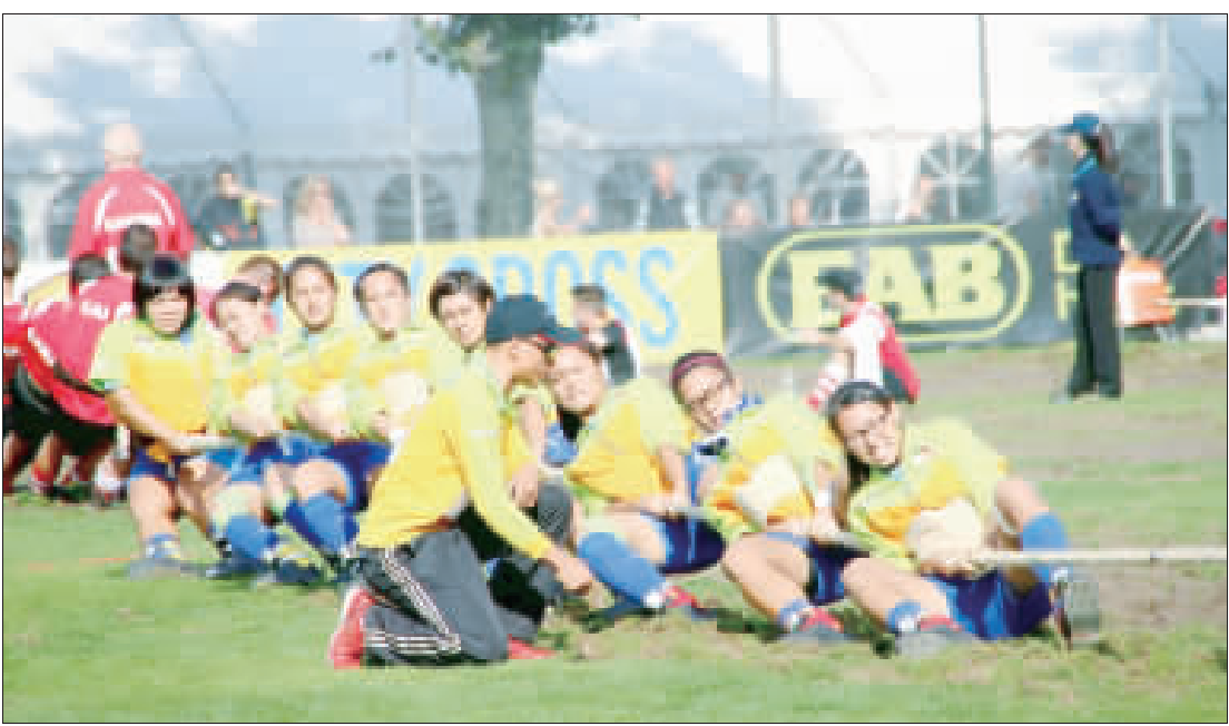
景美台師大拔河隊遠征瑞典2016世界盃室內拔河錦標賽，11日奪下女子540公斤組錦標賽金牌，不僅是台灣參賽4屆以來，首次在該項目奪金，本屆更是一舉包辦女子組6面金牌。(中央社)

【中央社記者顧萃台北12日電】景美台師大拔河隊遠征瑞典2016世界盃室內拔河錦標賽，11日奪下女子540公斤組錦標賽金牌，不僅是台灣參賽4屆以來，首次在該項目奪金，本屆更是一舉包辦女子組6面金牌。世界盃室內拔河錦標賽每2年舉辦一次，今年在瑞典馬爾摩(Malmö)舉行。