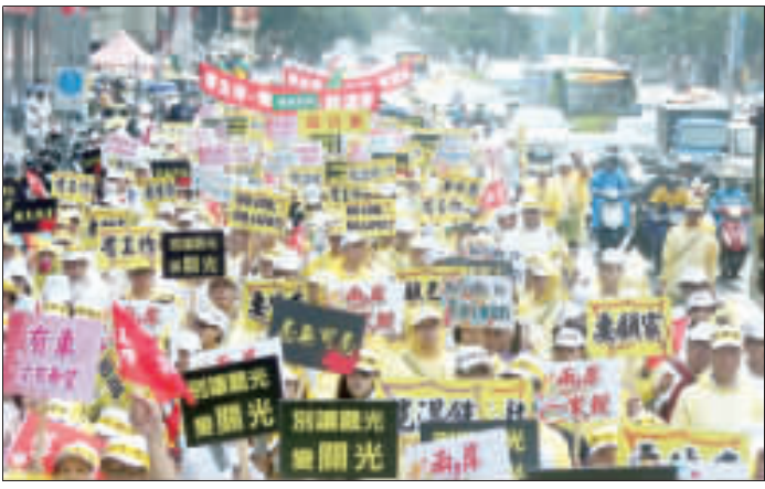
受陸客縮減影響，觀光業12日首次集結遊行，隊伍下午在華山文創園區集合，由忠孝東路、仁愛路往凱道出發，訴求「要生存、有工作、能溫飽」，約有2萬人上街。(中央社)

自教會言人李奇斌說，觀光產業已到了危急存亡之秋。20至今，陸客來台旅遊人數的減少，摧毀了觀光產業的生存、從業人員的安身立命。