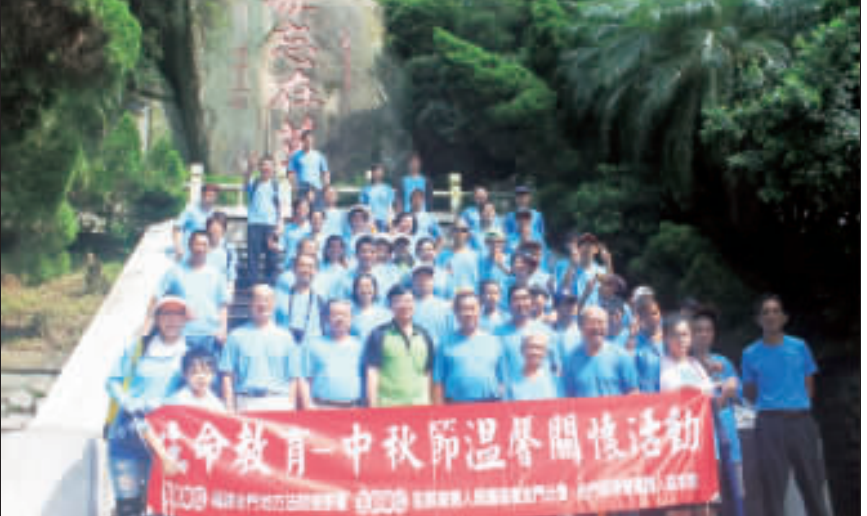
中秋節前夕，金門地檢署結合犯罪金門分會舉辦中秋節太武山登山關懷活動。

記者莊煥寧／綜合報導 為了對保護個案、警生人及其家庭表達關懷之意，並彰顯司法保護精神，福建金門地方法院檢察署特結合財團法人犯罪被害人保護協會福建金門分會於11日上午(中秋節前)舉辦中秋節太武山登山關懷活動，活動中地檢處也邀請金門國家公園管理處導覽解說人員介紹太武山十二奇景自然文化景觀，而各個參與活動的家庭大家起大拉小手提前慶祝中秋，增進家人間的情誼。 檢察長徐錫祥指出，犯罪金門分會自民國88年起在金門地區耕 及志工們長期以來的熱心付出。犯罪金門分會表示，犯罪被害人需求相當多元，包括經濟、就業、政府機關與民間資源的通力合作，自105年起起保協會也增加推辦重傷被害人照顧服務，補助被害人長期照顧費用，及與中華民國壽險公會合作推辦生人微型保險。犯罪被害人保護協會金門分會服務宗旨為「保護心、關懷情」，秉持服務已滿精神，有關被害人保護服務之相關問題，歡迎洽詢保護專線：082-373735。