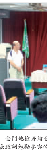
金門地檢署結合金城國中舉辦「社區生活營-築夢少年課業輔導活動」，徐錫祥檢察長致詞勉勵參與的青少年學子。

「芋見烈嶼 芋約幸福」，烈嶼鄉公所為增進在地觀光產業發展，結合金門縣政府「一鄉鎮、一特色」觀光策略，每年配合芋頭盛產期擴大舉辦「烈嶼鄉芋頭季」一系列的行銷活動，多年來廣受好評，包含如前副總統蕭萬長親自蒞臨烈嶼芋頭「代言」、遊客挖芋體驗活動、攝影比賽、創意芋頭料理、芋頭饗宴及透過美食或旅遊節目錄影播放，以增加知名度，吸引更多的遊客到烈嶼。