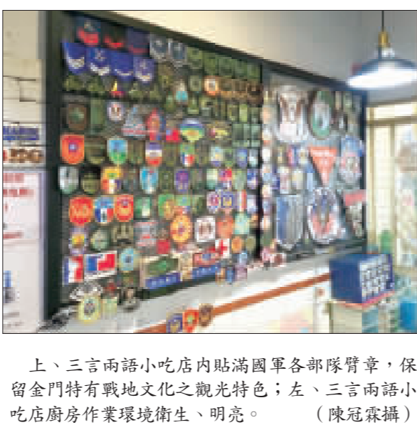
上、三言兩語小吃店內貼滿國軍各部隊臂章，保留金門特有戰地文化之觀光特色；左、三言兩語小吃店廚房作業環境衛生、明亮。

建設處表示，自民國101年度起推動「金門餐飲業輔導及品質提升計畫」，「標記小吃」(105)年度將持續推動，凡依法登記之餐飲業者，歡迎報名「金盾計畫」金盾獎！活動，將由專業顧問團隊給予輔導建議、經費補助(大型餐廳上限10萬元，小型餐廳上限5萬元)等，歡迎報名諮詢洽詢財團法人中衛發展中心會，電話：29113684131、Email: c1281@ccw.org.tw 或金門縣政府建設處陳小姐(082-326204#2389)。