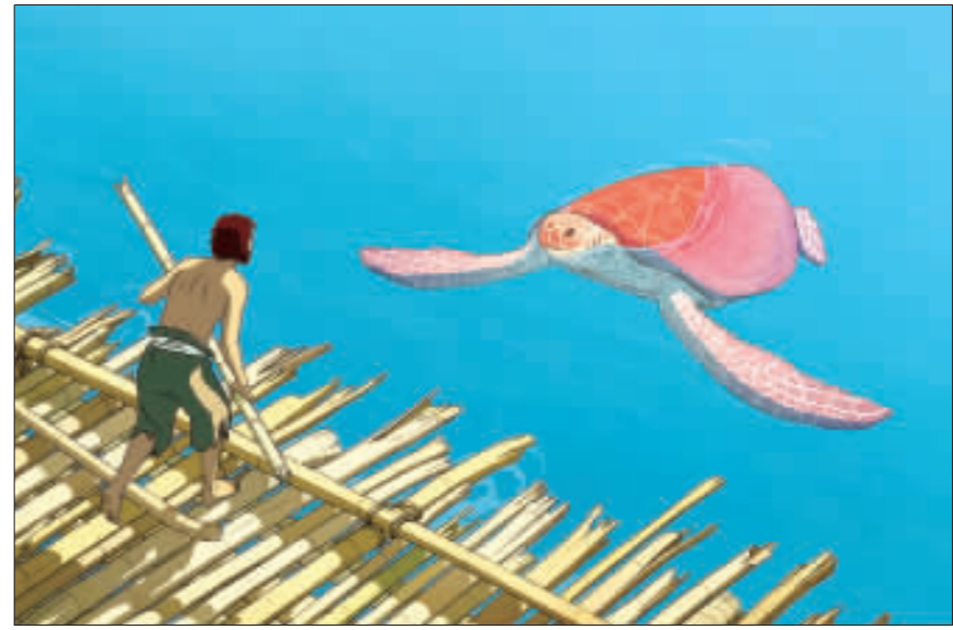
台中國際動畫影展 售票開放就秒殺 2016台中國際動畫影展15日中午12時開始在全台售票,開幕片「酷瓜人生」、閉幕片「紅鳥龜:小島物語」(圖)及「屍速列車」前傳「起源:首爾車站」熱門片就被秒殺。

在這樣的背景下,美軍官員對美俄將在日內瓦設立「聯合行動中心」的反應從審慎提防,到全然的懷疑,可謂不一而足。