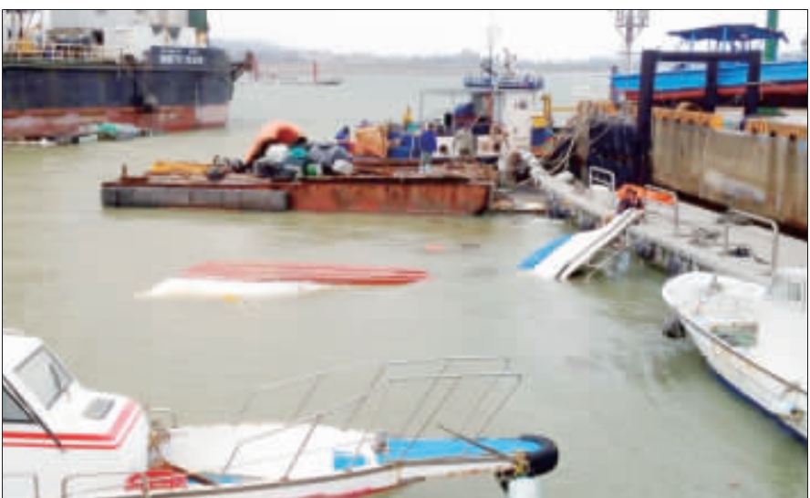
數十艘停於水頭碼頭港區的一隻釣魚船，昨日疑受到國登公司混泥土運補船撞擊的影響，沈沒破損在水頭港區內。

沒破損在水頭港區內，漁民們不排除提出集體訴訟，要求國登公司賠償損失。 這艘國登公司混泥土運補船原繫於水頭港區南堤，疑因船上繩索未繫緊加上昨日風雨過大，竟沒破損在水頭港區內，漁民們不排除提出集體訴訟，要求國登公司賠償損失。 沒繫好固定繩索以致於船隻漂流到北堤破壞、撞沉漁船，這種狀況讓他們實在無法接受。 受苦的漁民表示，將透過相關管道爭取國登公司賠償損失，爭取自己的權益。