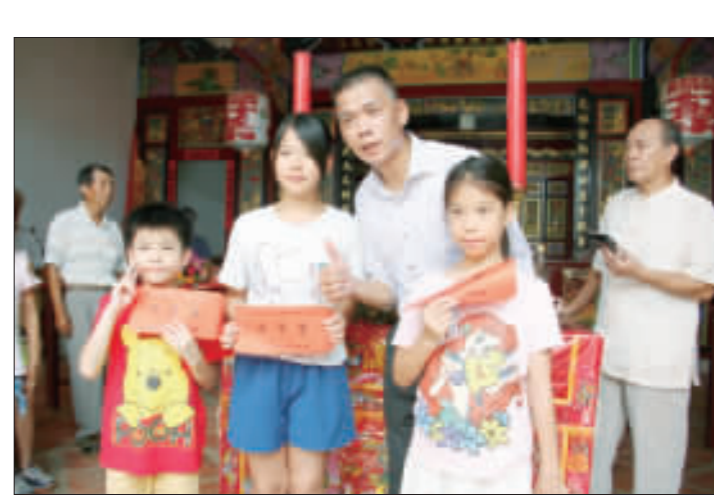
金門蔡氏宗親會舉行秋季祭祖活動，並頒發蔡氏宗親會獎學金，展現慎終追遠的情懷。

建設處表示，自民國101年度起推動「金門餐飲業輔導及品質提升計畫」，「標記小吃」(105)年度將持續推動，凡依法登記之餐飲業者，歡迎報名「金盾計畫」金盾獎！活動，將由專業顧問團隊給予輔導建議、經費補助(大型餐廳上限10萬元，小型餐廳上限5萬元)等，歡迎報名諮詢洽詢財團法人中衛發展中心會，電話：29113684131、Email: c1281@ccw.org.tw 或金門縣政府建設處陳小姐(082-326204#2389)。