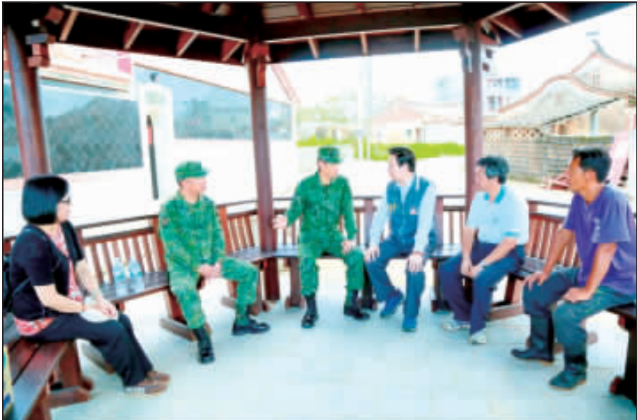
上、下：陳縣長向參謀總長嚴德發表達國軍協助金門災後復原的感謝之意，同時請託希望未來金門長久重建之路，國軍能繼續支援。

參謀總長嚴德發表示，「金門的事就是金防部的事」，災後復原工作「做到好為止」。 強颶莫蘭蒂重創金門，金防部官兵投入救災，卻傳出缺水狀況，參謀總長嚴德發上將望未來金門長久重建之路，國軍能繼續支援；對此，嚴德發表示，「金門的事就是金防部的事」，災後復原工作「做到好為止」。 縣長陳福海特別感謝參謀總長嚴德發蒞臨，他說，感謝行政院長林全、參謀總長等人，都這麼關心金門，在災後很短的時間內就親自抵達金門來關心救災及復原狀況，陳縣長代表金門的鄉親表達感謝之意；另外，經理裝備、內衣褲等物資，可將物資轉贈給更有需要的單位。 金防部也指出，防區服役官兵金門籍的比例相當高，參與救災的弟兄姊妹們對於能盡一份心力，與地方民眾一同恢復家園，由衷感到榮耀與驕傲，自15日風災發生起，每日將持續派派派派約20名官兵戮力投入災後復原工作，協助地方民眾儘早恢復正常生活。