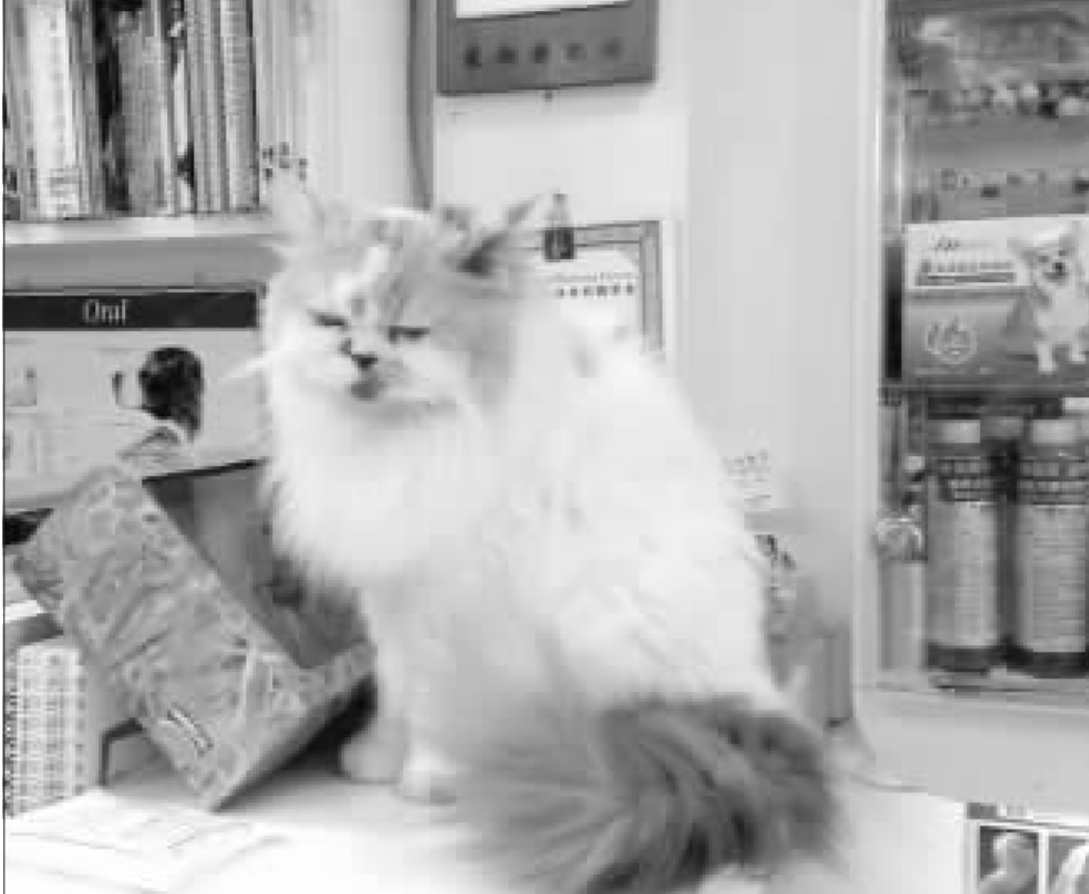
貓常洗澡好嗎？獸醫師表示，貓平常就會自己理毛，所以不必像狗常洗澡，有的貓1至2個月洗一次，有的一生從沒洗過澡，都沒錯。（中央社）

食藥署提醒，民眾若易暈車，服用暈車藥應注意，應提前服用，不要上車才服，以免藥效不彰。 民眾常用暈車藥的成分多為抗組織胺及東莨菪鹼（scopolamine），其中抗組織胺成分也是感冒藥常用成分，服用後可能會有嗜睡、意識不清等副作用。 衛生福利部食品藥物管理署技正邱若鳳表示，民眾服用暈車藥常見錯誤是上車前才吃，但藥物作用需要時間，建議在上車前至少半小時前就要服用。 邱若鳳說，很多民眾服藥時間錯誤，覺得怎麼沒效，又繼續吃藥，就可能導致藥物過量。暈車藥是安全藥物，多服1、2顆不至於有嚴重後遺症，但可能頭暈、意識不制情形。 （中央社）