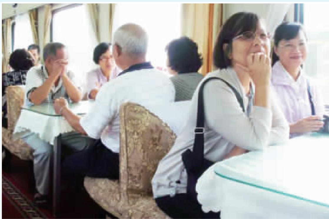
作者(背對者)與母姊相會

親朋好友、同事或同窗等之間能夠經常或久久相約聚會，都是一件非常難得的好事！民國五、六十年代，當我在台北市求學及在屏東市教書時，我唯一的胞姊，三次在末告知我的情形下，帶著不識字的老母親前來北市或屏市跟我聚會，因關心我，她倆才辛苦從老遠的故鄉佳冬坐火車到台北市和屏東市找我！ 此三次我所意想不到的可以跟母姊在異地聚會，並無意間看到我所日夜想念的她們身影時，除了當場讓我感到喜出望外之外，至今，對這幾次聚會所代表的親情可貴仍讓我難以忘懷！ 後來，胞姊偶爾也會請住在故鄉佳冬鄉萬建村附近的小女兒及女婿開車載她跟姊夫一起到距家算是不近的屏東市來探望我，胞姊的子孫共有十幾人，雖僅四人跟我和內人一起聚會聊聊，但我覺得這已是很難得了！ 另外的四次聚會，則是胞姊帶著全家約二十幾人一起到屏東市來找我，第一次是民國八十四年，我生了一場大病，居家經高醫數月治療的期間，胞姊經常私自一人帶著水果來探訪我，並安慰當時仍未婚的我要好好的靜養！ 當我大病初癒時，她還邀約全家大小一起前來寒舍看望我，胞姊還包了一個大紅包祝我身體健康，我高興的只收紅包紙而已！為感謝胞姊全家人的關心，當天我在日式餐廳請她們大夥兒一起用午餐，聚會中大家談些各自在小學、公私幼稚園的教學情況、家鄉老母安養及我生病治療過程等的情形！ 第二、三次是在我結婚後，我跟內人先誠意邀請胞姊全家到寒舍聚會，在屏東市住家附近的餐廳用餐聚會後，後來，住在屏東市的大女兒也在屏東市不同的一間餐廳聚會以回請我跟內人，胞姊全家也全員一起出席此次聚會！