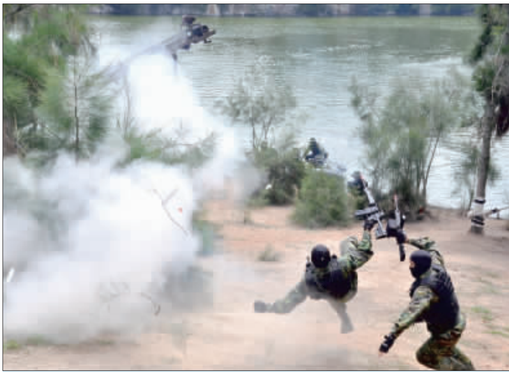
漢光演習實施各種演練，包括水域特攻部隊秘密偵察、陸上特攻隊員正面向下至目標區等，聲光效果十足。

記者陳冠霖／金湖報導 漢光33號演習實兵驗證進入第2天，金防部昨(23)日也在南石滬公園，由兩棲偵察營針對遭挾持人質營救，及破壞敵重要設施進行演練，展現出特種部隊岸際滲透與困難地形潛伏的高超技巧。