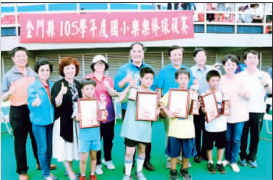
金門縣一〇五學年度國小童樂樂棒球比賽圓滿落幕，教育處處長李文良頒發獎盃嘉勉績優團體。