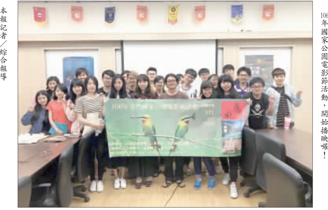
106年國家公園電影節活動，開始播映囉！

本報記者／綜合報導 金門國家公園電影節活動，開始播映囉！ 金門國家公園管理處於106年5月起至10月與金門地區之古寧國小、金城國中、金門大學合作辦理「106年國家公園電影節活動」，走進校園，宣導認識國家公園。日前於金門大學觀光系揭開電影節活動的首映，並邀請導演廖東坤舉辦講座現身說法，希望推廣國家公園相關保育理念。 內政部營建署國家公園組統籌台灣各國家公園管理處，辦理106年國家公園電影節活動，聯合推出10場影展活動，分為營建署主辦及各管理處籌備處(場)二部分。主辦將推出7場次10部超精彩及國際影展大獎得主導演的生態及人文鉅片，帶您上山下海，從台灣最美的春稜山脈、平原、海岸、島嶼一直到海洋叢林，一窺平常難以到達的台灣秘境之美。 金管處配合「106年國家公園電影節活動」，前進金門地區校園辦理影片播放，與金門地區的小學、國中、金門大學合作，共辦理12場次，影片播放內容有：坑道迴響、卜吉地而居、夏日追風—栗喉蜂虎、落蕃、南海指環—東沙環礁、來自南安的明信片、台灣國家公園3D立體影片、野性環山—台灣獼猴生態紀錄、星空上的隱行者等共9片，透過影片播放與映後有獎徵答活動，讓參與的學生深入了解國家公園的生物及文化多樣性，首場活動於金門大學觀光系揭開電影節活動的首映，特別也邀請知名導演廖東坤現身說法，舉辦講座，推廣國家公園相關保育理念，引起相當大的迴響。接續還將於金門大學建築系、都市計畫與景觀系、土木與工程學系、運休系、古寧國小暨金城國中陸續播映以推廣國家公園理念。