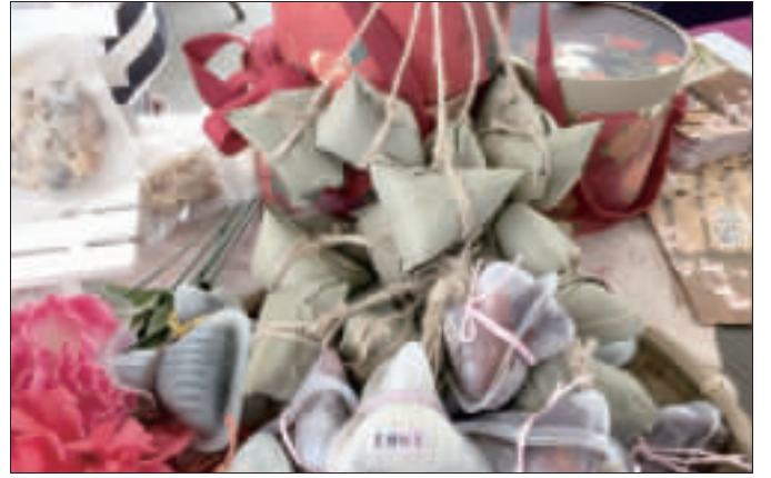
粽子愛怎麼包就怎麼包，創意粽滿足新鮮需求，農糧署網站提供多種粽子食譜，有傳統、養生和創意3單元，也介紹台灣南北粽的不同，農糧署南區分署表示，因做法不同，南粽比北粽熱氣量低。(中央社)

【中央社東京29日電】美國證實北韓今天再度試射彈道飛彈，白宮表示總統川普已聽取相關簡報，日本和南韓政府也都為此召開國家安全會議。 路透社報導，南韓合同參謀本部在聲明中表示，北韓發射1枚飛毛腿(Musam)短程彈道飛彈，飛行距離約450公里。北韓儲存大量原是蘇聯研發的飛毛腿飛彈。飛彈改良版射程可達1000公里。南韓總統文在寅上午7時30分(台灣時間6時30分)召開國安會。而日本首相安倍晉三譴責北韓最新試射行動，誓言聯手其他國家遏阻北韓不斷的挑釁行徑。 日本內閣官房長官菅義偉表示，日本嚴正抗議北韓此舉。北韓試射飛彈落點則是在日本專屬經濟海域。 菅義偉在電視轉播的記者會上說：「從海運和飛航安全角度而言，北韓發射這枚彈道飛彈有重大問題，且明顯違反聯合國安理會決議。」 安倍在簡短電報談話中告訴記者：「我們近日剛在七大工業國集團(G7)會上達成共識，北韓議題是國際社會優先考量。」「我們將與美國合作採取具體行動遏阻北韓。」 安倍說，日本將盡最大努力保護人民，同時與南韓等國家保持密切聯繫。 白宮表示，川普已聽取有關北韓最新試射行動的簡報。根據法新社，美軍太平洋司令部(USACOM)表示，他們追蹤這枚從元山機場附近發射的短程飛彈6分鐘，直到它落入日本海。 美國不認為對北美產生威脅，太平洋司令部表示仍在評估詳情，聲明說「我們持續密切監控北韓動向」，「美軍太平洋司令部對大韓民國(南韓)和日本盟友的安全承諾堅定不移」。