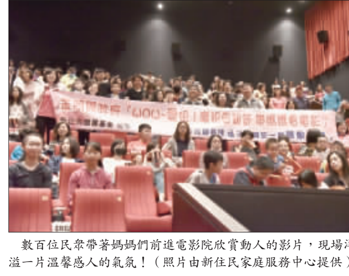
數百位民眾帶著媽媽們前進電影院欣賞動人的影片，現場洋溢一片溫馨感人的氣氛！