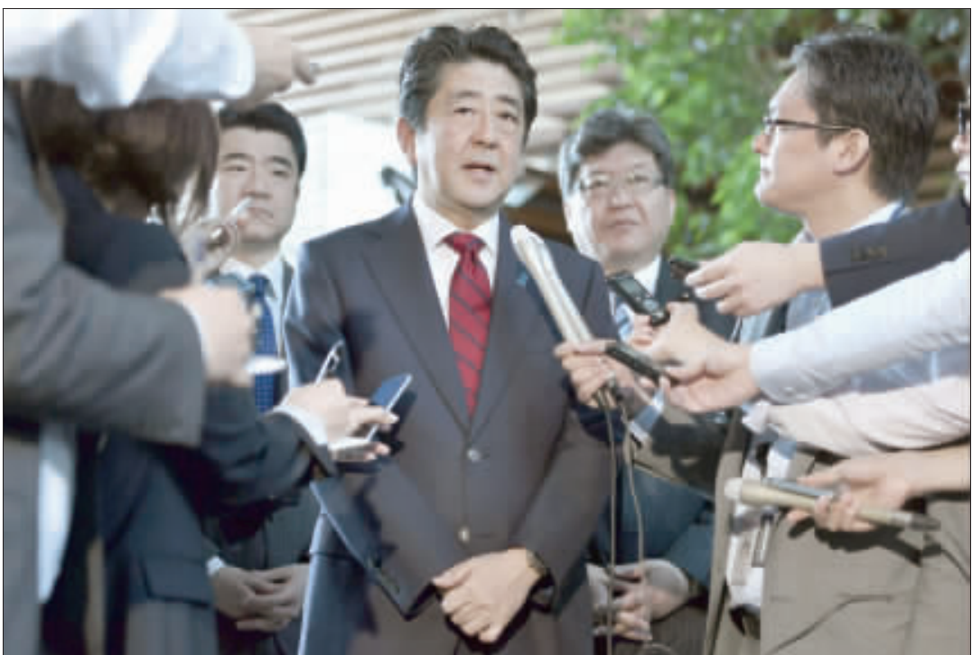
日本首相安倍晉三29日在東京針對北韓稍早試射飛彈一事跟媒體發表談話。北韓飛彈落點據信是在日本專屬海域的日本海。

【中央社東京29日電】美國證實北韓今天再度試射彈道飛彈，白宮表示總統川普已聽取相關簡報，日本和南韓政府也都為此召開國家安全會議。 路透社報導，南韓合同參謀本部在聲明中表示，北韓發射1枚飛毛腿(Musam)短程彈道飛彈，飛行距離約450公里。北韓儲存大量原是蘇聯研發的飛毛腿飛彈。飛彈改良版射程可達1000公里。南韓總統文在寅上午7時30分(台灣時間6時30分)召開國安會。而日本首相安倍晉三譴責北韓最新試射行動，誓言聯手其他國家遏阻北韓不斷的挑釁行徑。 日本內閣官房長官菅義偉表示，日本嚴正抗議北韓此舉。北韓試射飛彈落點則是在日本專屬經濟海域。 菅義偉在電視轉播的記者會上說：「從海運和飛航安全角度而言，北韓發射這枚彈道飛彈有重大問題，且明顯違反聯合國安理會決議。」 安倍在簡短電報談話中告訴記者：「我們近日剛在七大工業國集團(G7)會上達成共識，北韓議題是國際社會優先考量。」「我們將與美國合作採取具體行動遏阻北韓。」 安倍說，日本將盡最大努力保護人民，同時與南韓等國家保持密切聯繫。 白宮表示，川普已聽取有關北韓最新試射行動的簡報。根據法新社，美軍太平洋司令部(USACOM)表示，他們追蹤這枚從元山機場附近發射的短程飛彈6分鐘，直到它落入日本海。 美國不認為對北美產生威脅，太平洋司令部表示仍在評估詳情，聲明說「我們持續密切監控北韓動向」，「美軍太平洋司令部對大韓民國(南韓)和日本盟友的安全承諾堅定不移」。