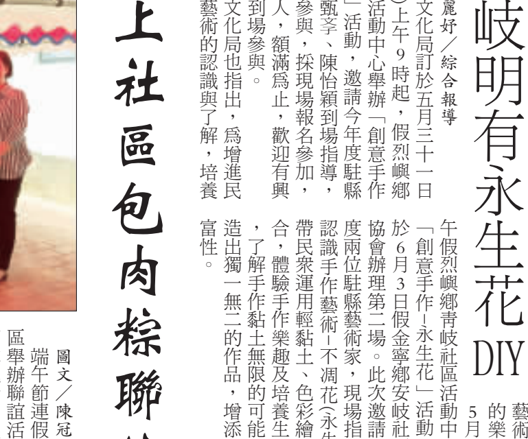
金門縣文化局於五月三十一日(星期三)上午九時起，假烈嶼鄉青岐社區活動中心舉辦「永生花DIY」活動，邀請今年度駐點青岐社區活動中心駐點藝術家、現場指導民衆藝術創作，採現場報名參加，活動免費參與，歡迎有興趣的民衆踴躍參加。