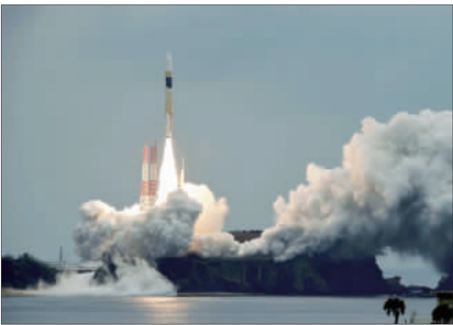
打造日版GPS 引路2號衛星升空

日本1枚H-IIA火箭1日上午自鹿兒島縣的種子島宇宙中心發射升空，搭載著1枚準天頂衛星系統的引路號(Michibiki)2號衛星，以打造一套高度精密定位系統，可以和美國的GPS相輔相成。(中央社)