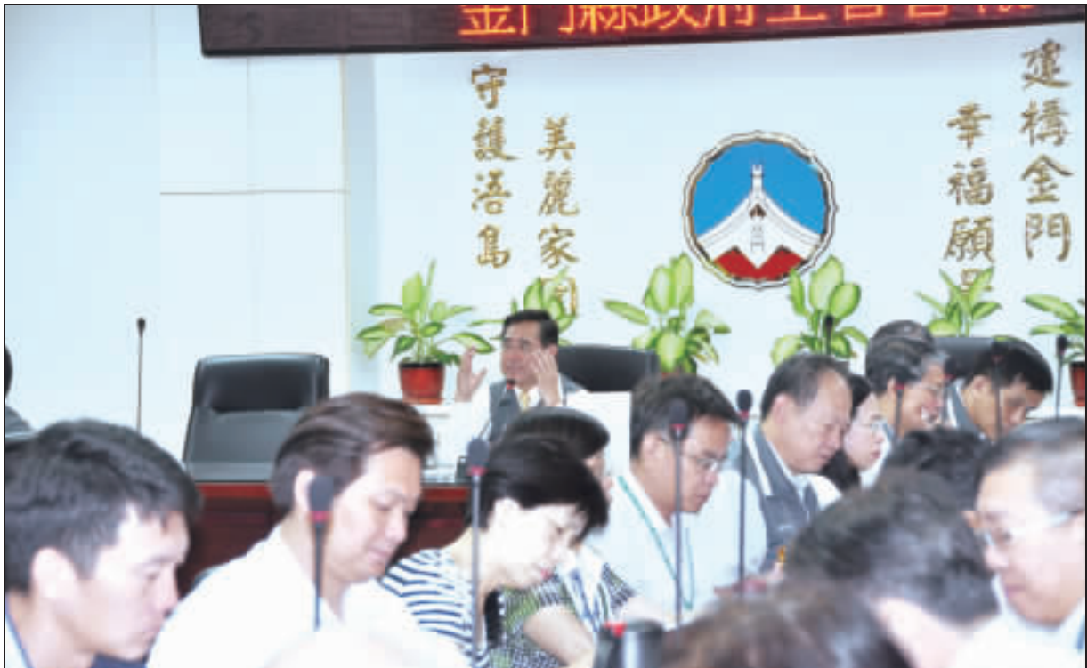
副縣長吳成典昨主持金門縣政府106年第14次主管會報。