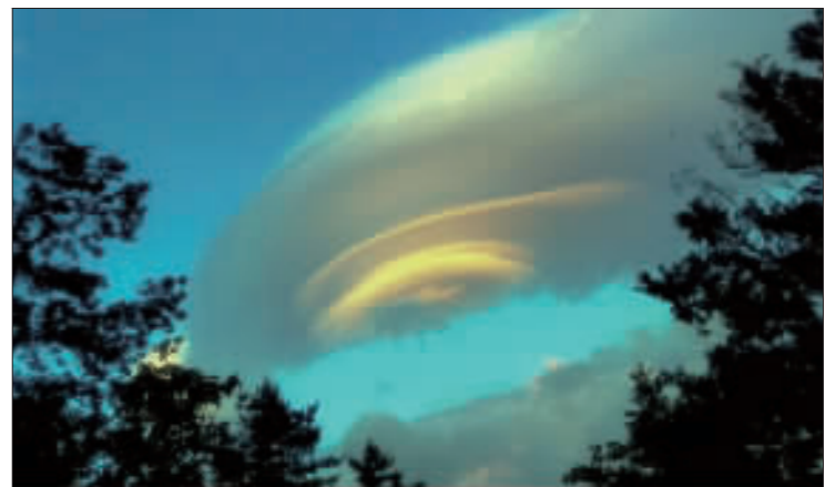
美極了 這雲朵宛若彩色飛碟

【中央社倫敦一日綜合外電報導】今天發表的「2017年和平指數」顯示，美國政治混亂2016年將北推，中東則陷更動盪，台灣在這項年度評比排名第40，在亞太地區中排名第6。根據這項指數，全球最和平的10個國家是冰島、紐西蘭、葡萄牙、奧地利、丹麥、捷克、斯洛維尼亞、加拿大、瑞士和並列第10的愛爾蘭與日本。 亞太地區排名最高的是紐西蘭(2)，接著依序為日本(10)、澳洲(12)、新加坡(21)、馬來西亞(29)，再來就是台灣(40)。 【2017年和平指數】(Global Peace Index)顯示，整體來說，全球去年變得較為和平，但路透社報導說，發表指數的雪梨經濟與和平研究所(Institute for Economic and Peace)創辦人基利亞(Steve Killelea)說，「儘管...趨勢令人寬慰，世界仍深陷中東衝突、美國政治動盪、難民潮及歐洲的恐怖主義等困境。」 而敘國更是連續第5年敬陪末座。敘利亞內戰長久無法獲得解決，加上沙烏地阿拉伯介入葉門衝突，已使中東不穩，沙國和伊朗的敵對讓情勢雪上加霜。這項指數測量23項指標，包括暴力犯罪、軍事化程度、武器進口、難民人數和內部衝突喪生人數等。 敘國6年內戰已奪走約50萬人的性命，區域和全球強權相繼捲入，並造成第二次世界大戰以來最大難民潮。 不過指數同時顯示，中東和北非許多國家2016年變得更加和平，包括摩洛哥和伊朗，這兩地政治穩定程度都有提升。 與此同時，美國總統川普(Donald Trump)的白宮之路凸顯社會嚴重分裂，導致美國政治穩定度下滑。 基利亞聲明：「需要幾年的時間，才能夠完全理解這麼嚴重政治截然對立的真實程度，但其破壞性影響已昭然若揭。」