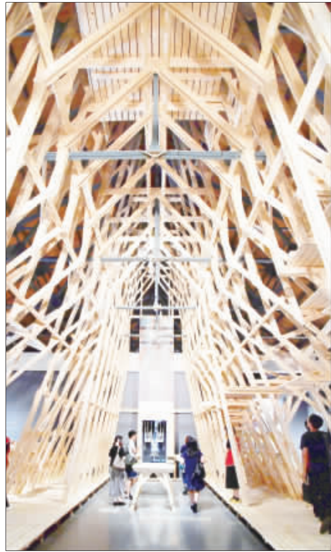
高第誕生165週年大展 「上帝的建築師：高第誕生165週年大展」25日舉行開幕記者會，26日起至9月17日即將在華山1914文化創意園區登場。圖為西班牙建築大師高第的「聖家堂」建築模型。

【中央社記者鍾榮峰25日電】到科技展參觀時，如進入寶山一般，新品琳瑯滿目，仔細觀察時會看到令人驚豔的新應用，等待你發掘及挖寶。 例如平板筆電就有令人驚奇的新花樣。你可以用具備壓力感應的墨水數位筆，在一般紙張書寫或是畫圖，透過數位板可即時傳送到iPad顯示在螢幕上。 還有一款看似平凡的條狀物，其實具有相當酷炫的科技內容。 把條狀物貼在筆電螢幕下方，你也可以用手指或美術筆在螢幕上透過條狀物所提供的觸控功能進一步作畫。 若把條狀物拆卸下來，筆電又回復到原本不具備觸控功能的狀態。 這項產品由瑞典設計，重量只有55公克，USB隨插即用，不用安裝驅動程式，採用磁力可拆卸設計，能夠支援13吋、14吋及15吋的Windows版筆記型電腦，以及13吋的Macbook Air筆記型電腦。 下次若有機會再到科技展逛逛，也不妨花點時間找找看，或許也可以發掘更令人耳目一新的科技應用。