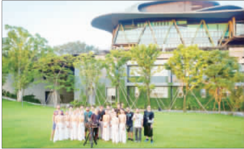
雲門舞集25日發布新聞稿表示，英國Sky Arts藝術電視台遠渡重洋專程來台，拍攝雲門舞集創辦人林懷民專題。圖為Sky Arts拍攝團隊於雲門劇場戶外拍攝。

三大成員國，投票占比提高至6.09%。但10年後會是何等光景，誰也說不準。 無論中國未來十年的發展，技術上來講，IMF想搬家，依照現在在的投票占比，美國一票足以否決拉加德的說法。 IMF規定，一般決策需要85%以上的投票通過，重大決策需要95%，美國實際上確實擁有否決權。 拉加德24日在活動中還被問到，十年後的IMF和現在有何不同？她回答前特別指出，這是預測未來IMF的可能發展，「必須避免(我的談話)變成『IMF想要這麼做』的新聞標題」。 拉加德似乎想透露弦外之音。 這位精明的法國女性指出，她最關注的是IMF得到更多資金支持且能有效運用，以應對未來可能發生的危機，「也許是網路攻擊也說不定」。 她接著提到IMF要能永續獲得資金支持，就必須在機構治理上反映成員國的經濟實力，如果其他重大新興市場國家的成長趨勢持續，「我們這樣的對話……可能不是在華府」。 主持人搶著說，「我們到IMF北京分支機構舉行。」拉加德補充，「我們在北京總部(Head Office)舉行(到時)也許就不是分支機構了。」 IMF和亞洲國家的往來，除了與中國有更多互動，如IMF在北京設有代表處，舉辦區域經濟發展的論壇，最近一次的世界經濟展望報告，選在馬來西亞亞庇，亞太地區辦公室設在東京已多年。