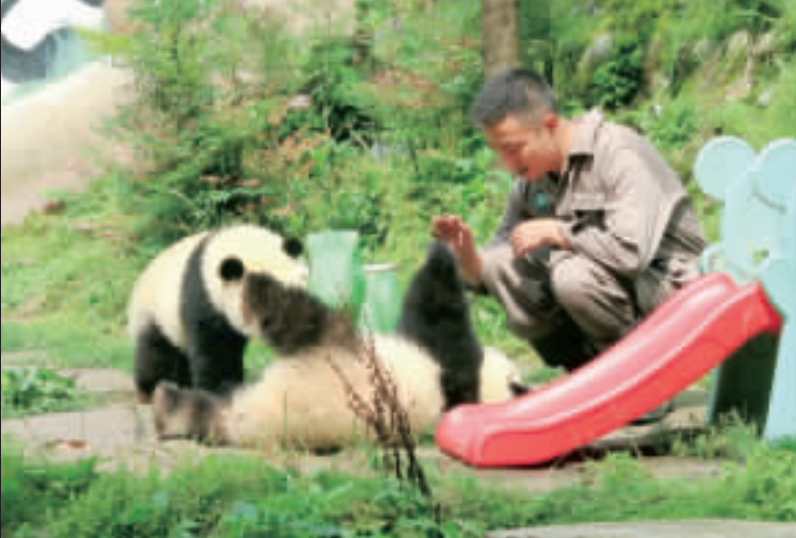
「中國大熊貓保護研究中心」位於四川雅安碧峰峽基地育有47隻圈養大熊貓，展出其中約20隻。圖為熊貓雙胞胎「喬伊」、「喬良」與飼育員玩耍。

幅偏向北京。泰國是美國另一盟友，軍政府已從中國購買潛艇，並按中國要求驅逐境內維吾爾人。中國也邀請馬來西亞參與利潤豐厚的交易，比如高鐵計畫。 而中國能贏得緬甸的好感，最大的原因就是在緬甸民族內戰中擔任調停人。高舉反對和果敢軍的武裝組織瓦邦聯合軍和果敢軍，在與緬甸軍隊作戰的多年時間裡，都得到了中國心照不宣的支持。 瓦邦聯合軍(Untet Wa State Army)據稱有兩萬人。瓦邦在自治區內使用