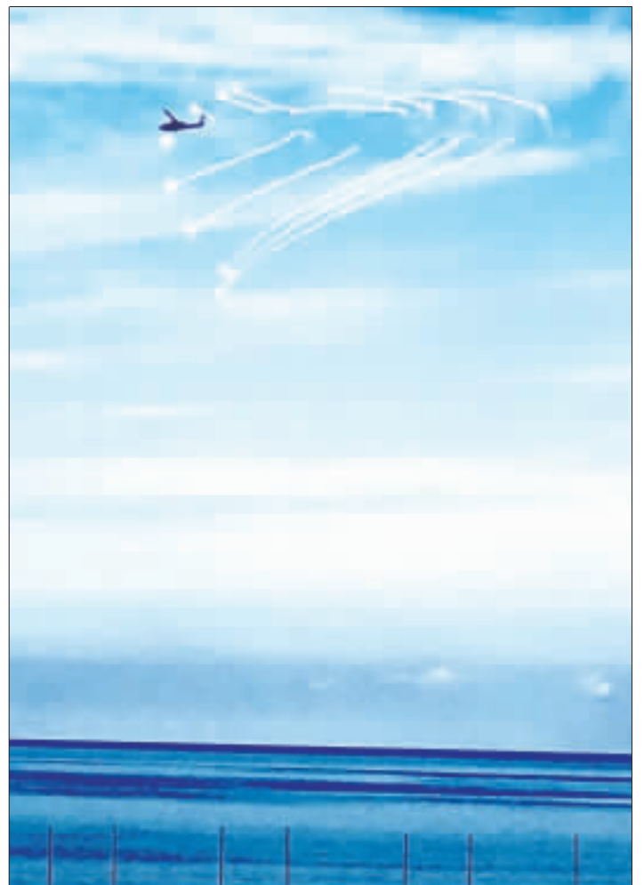
國軍重砲射擊演練 首度結合海空軍 國軍第四作戰區11日在屏東實施年度「重砲射擊」演練，今年首度結合海空軍跟陸航實兵演練。

【中央社巴塞隆納10日電】加泰隆尼亞自治區主席普伊格蒙特今天表示，他的親分離主義政府已為10月1日的獨立公投做好一切準備；不過，西班牙中央政府與法院已認定這項公投為非法。 法新社報導，普伊格蒙特（Carles Puigdemont）於加泰隆尼亞電視台播出的演講中說：「（自治區）政府已做好一切準備，以便加泰隆尼亞人於10月1日能一如過去般，完全正常地投票，讓想投票贊成及反對的選民都能表態。」 為策劃這場公投，加泰隆尼亞自治區政府必須印製選票、編製選舉人名冊、設立投票所及選務機關，相關措施全由自治區政府一手包辦，以避開西班牙中央政府的反對。 西班牙的憲法法庭6日已廢除由加泰隆尼亞區議會所快速通過的公投法；西班牙檢方也祭出法律訴訟鎖定普伊格蒙特與其他自治區政府的成員，包括可能涉嫌煽動、濫用職權及盜用公款等指控，並敦促公職人員與公司行號不要投票。 加泰隆尼亞自治區政府已誓言，若贊成獨立的一方在公投勝出，就會在48小時內宣布獨立。 擁有750萬居民的加泰隆尼亞位於西班牙東北部，面積相當於比利時，是西班牙一個經濟發達的區域，也素以自身的文化和語言為傲。 不過加泰隆尼亞當地對獨立的看法分歧。加泰隆尼亞民意研究中心（Canadian Centre of Opinion Studies）7月所做的調查顯示，41%的受訪者支持獨立，但29%的人反對；不過，約有30%的人希望舉行公投，以便問題能一勞永逸地解決。