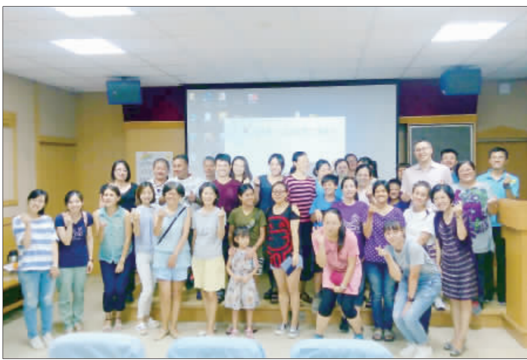
寧中小國小部舉辦親師座談會，藉由面對面的溝通，讓老師和家長更瞭解孩子的狀況。