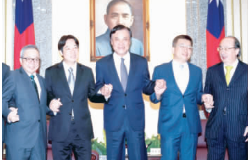
賴清德拜會蘇嘉全 行政院長賴清德（左2）、副院長施俊吉（左）11日到立法院，拜會立法院長蘇嘉全（中），與立法院副院長蔡其昌（右2）、民進黨黨團總召柯建銘（右）等，一同牽手合影。