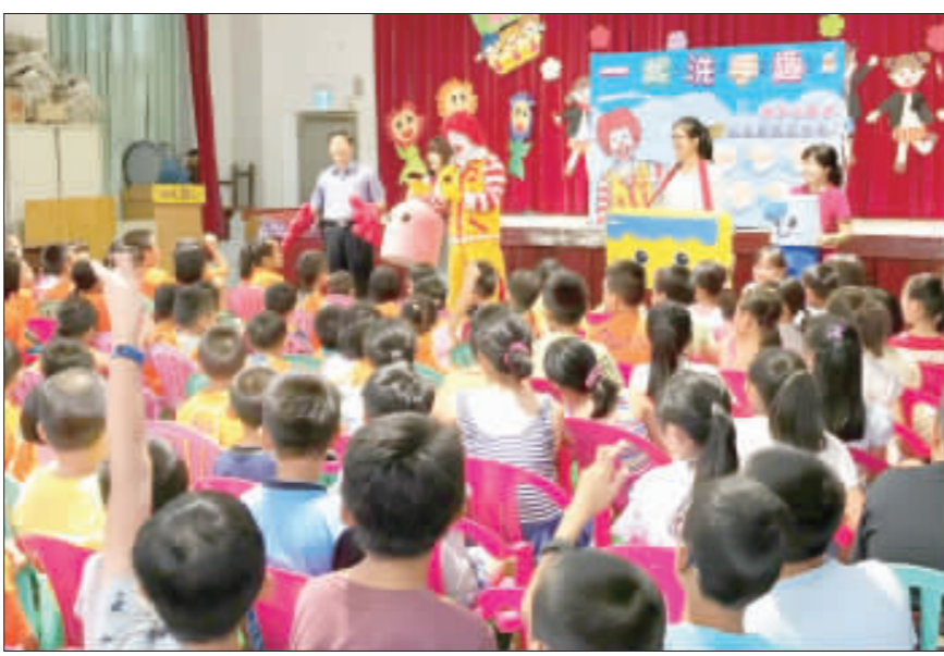
麥當勞叔叔抵金巡迴校園，宣導洗手重要性。(衛生局提供)

記者許峻魁／綜合報導 暑假已過，每當開學之後，腸病毒疫情便有可能會往上攀升，為了落實正確的勤洗手觀念，以低感染腸病毒機會，金門縣衛生局與麥當勞叔叔之家兒童慈善基金會合作辦理「麥當勞叔叔一起洗手趣」，於前日與昨日兩天，先後前往地區六所國小及附設幼兒園進行宣導，讓孩子們了解到洗手與疾病預防的重要性。 每當九月開學之後，衛生防疫相關單位無不緊繫條，細察神經，為的就是預防腸病毒疫情的擴大，而疾病的預防從小處著手，藉由觀念的改變來達到防疫目的。因此衛生局與小朋友們喜愛的麥當勞叔叔，在九月十二日與十三日兩天，先後前往了卓環國小、西口國小、上岐國小、古樓國小、湖埔國小、何浦國小等大小金門共六所國小進行「洗手宣導」。