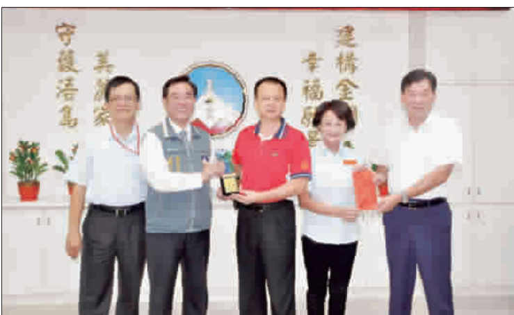
上、中、下：金門縣政府昨召開106年9月份治安會報，副縣長吳成典代表縣長陳福海頒發三獎項予推動社區治安工作績優社區及表揚民防、守望相助隊等協助民力。