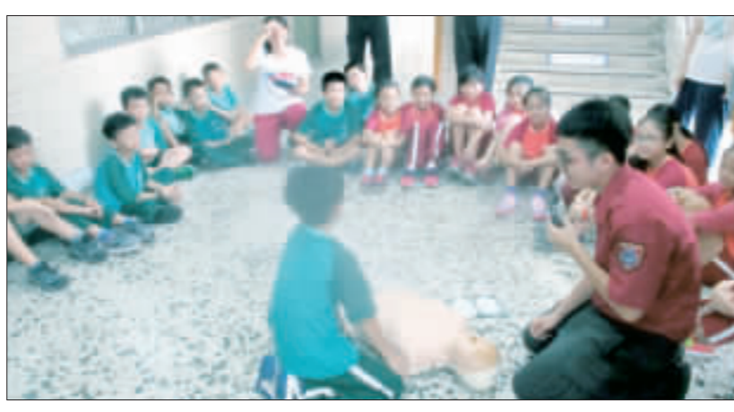
金門縣消防局金沙分隊配合全國救護日活動，特別前往轄內的金沙國小舉行CPR+AED教學及宣導，並邀請該國小學童至金沙分隊參觀。

病患的存活率。金沙消防分隊表示，內政部消防署去年開始，為了增加民眾對緊急救護與急救知識的認識，讓大眾學習更多救護知識，特別訂定「救護日」活動，希望透過過全國各直轄市、縣(市)消防機關共同舉辦「救護日」系列活動，推廣民眾使用緊急救護資源的正確觀念，並熟悉CPR+AED的操作。 金沙分隊指出，近年來隨著金門常住人口的增加，緊急救護的案數也隨之增加，但其中有些案件有濫用救護車的情形，也就是某些民眾的傷病情況並不嚴重，完全不用救護車載送，是可以自行