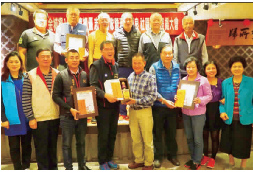
金城鎮志工社區聯合表揚，獲表揚社區合影。

記者許峻魁／金城報導 金城鎮公所昨(二十八)日舉辦「金城鎮一〇六年度績優社區志工團隊暨環保優良社區表揚大會」，由鎮長石兆瑋及副鎮長陳天成一同頒發獎狀，表揚在各社區志工團隊所做出的貢獻，他們也期許各社區的民眾，未來能有更多人加入志工行列，大家一起守護金城鎮。 「金城鎮一〇六年度績優社區志工團隊暨環保優良社區表揚大會」，於昨(二十八)日下午三時三十分左右，在金城鎮的南寧餐廳舉行，金城鎮長石兆瑋、主任秘書黃秋銘、金城鎮