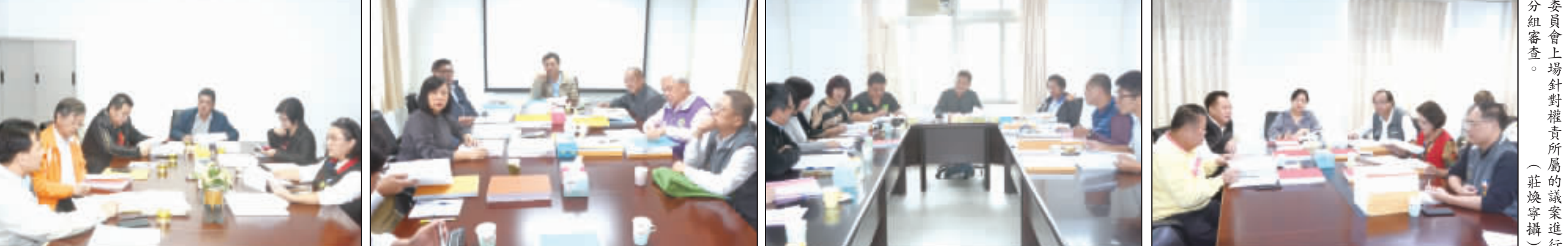
由左至右，第一、二、三、四審查委員會上場針對權責所屬的議案進行分組審查。