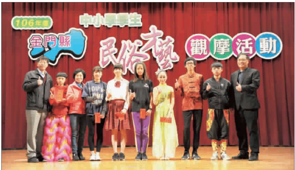
由金門縣政府舉辦的一〇六年中小學學生民俗才藝觀摩活動，昨日在社區發展廳大禮堂舉行。圖為各校學生在表演中展現才藝，贏得滿堂彩。 (董森堡攝)

由金門縣政府舉辦的一〇六年中小學學生民俗才藝觀摩活動，昨日在社區發展廳大禮堂舉行。圖為各校學生在表演中展現才藝，贏得滿堂彩。 這項活動是由金門縣政府主辦，旨在推廣民俗才藝，增進學生對本土文化的認識。活動內容豐富，包括歌仔戲、布袋戲、舞獅、舞龍、陣頭、陣腳、陣頭、陣腳、陣頭、陣腳等。各校學生在表演中展現了精湛的才藝，贏得觀眾的熱烈掌聲。 此外，活動還設有觀摩區，讓家長和老師們可以近距離欣賞學生的表演。主辦單位表示，希望透過這樣的活動，讓學生們在歡樂的氣氛中學習和成長。