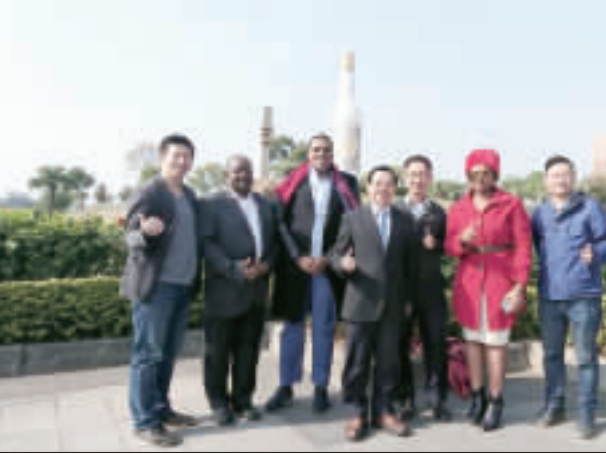
史瓦濟蘭王子一行在金門縣政府官員陪同下，參觀了金門的各項建設。

記者翁維智／綜合報導 在金門縣政府官員、實踐大學陳振貴校長陪同下，我國在非洲重要盟邦史瓦濟蘭國王王子班科希先生日前偕同該國駐台官員走訪金門酒廠、太武山擎天廳、獅山砲陣地、昇恆昌免稅廣場、砲彈鋼刀店等景點。首次參訪的班科希王子，就選擇到金門來，短短一天旋風式訪金，他表示，明年六月將邀請父親史瓦濟三世國王到金門參訪，屆時也希望能夠安排時間至金門參訪，屆時也希望能夠安排時間至金門參訪，屆時也希望能夠安排時間至金門參訪。 班科希王子此行由史瓦濟國駐台官員、實踐大學陳振貴校長陪同，走訪了金門酒廠、太武山擎天廳、獅山砲陣地、昇恆昌免稅廣場、砲彈鋼刀店等景點。王子此行由史瓦濟國駐台官員、實踐大學陳振貴校長陪同，走訪了金門酒廠、太武山擎天廳、獅山砲陣地、昇恆昌免稅廣場、砲彈鋼刀店等景點。