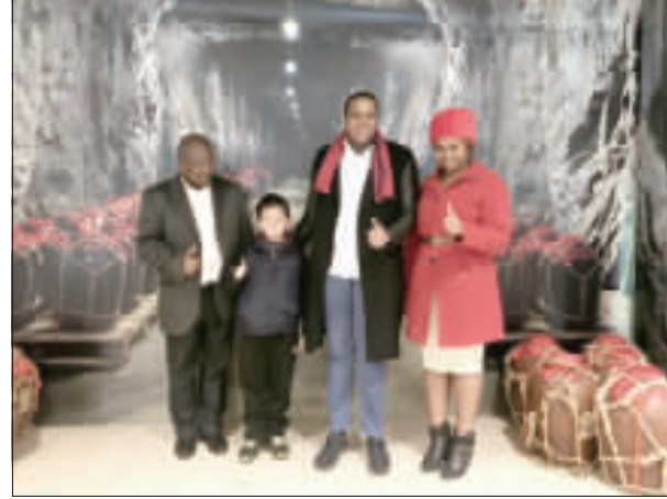
史瓦濟蘭王子一行在金門縣政府官員陪同下，參觀了金門的各項建設。