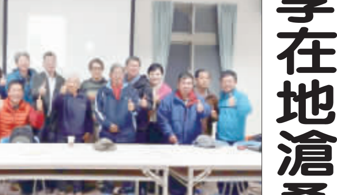
左、右：大家一起來寫村史，由金門文化局主辦的「說·家鄉的故事」系列，本月9日及8日分別在滄江書院朱子祠及金沙后水頭雜糧產銷班第五班各舉辦一場「村史開講」。