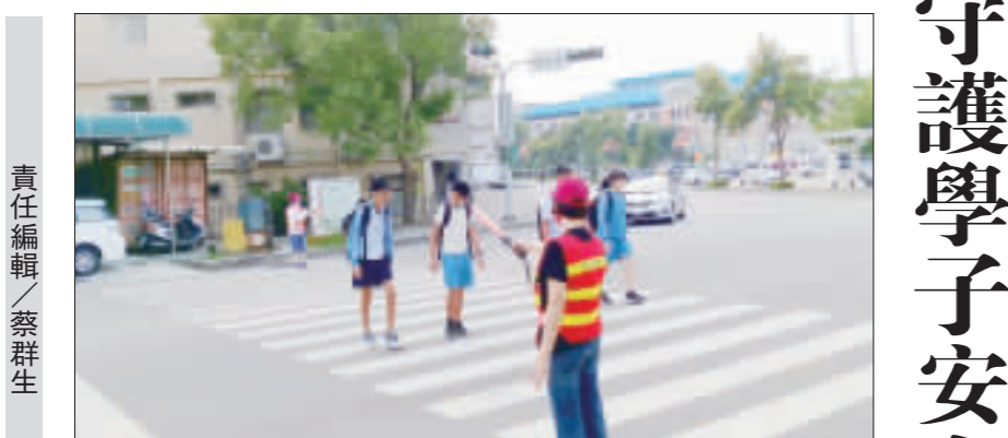
交通導護志工，長年來守護城中學子，提供學生一個上學安全的交通環境。(李金鎰攝)