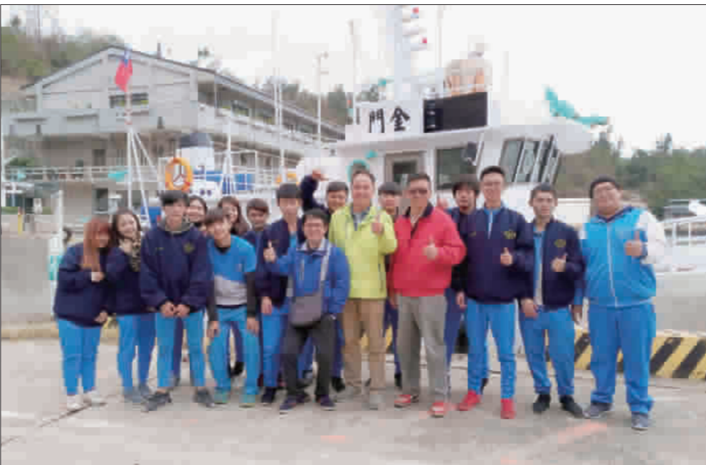
漁業科結合產官單位進行海上見習，讓學子驗證所學知識，增強實務技能。