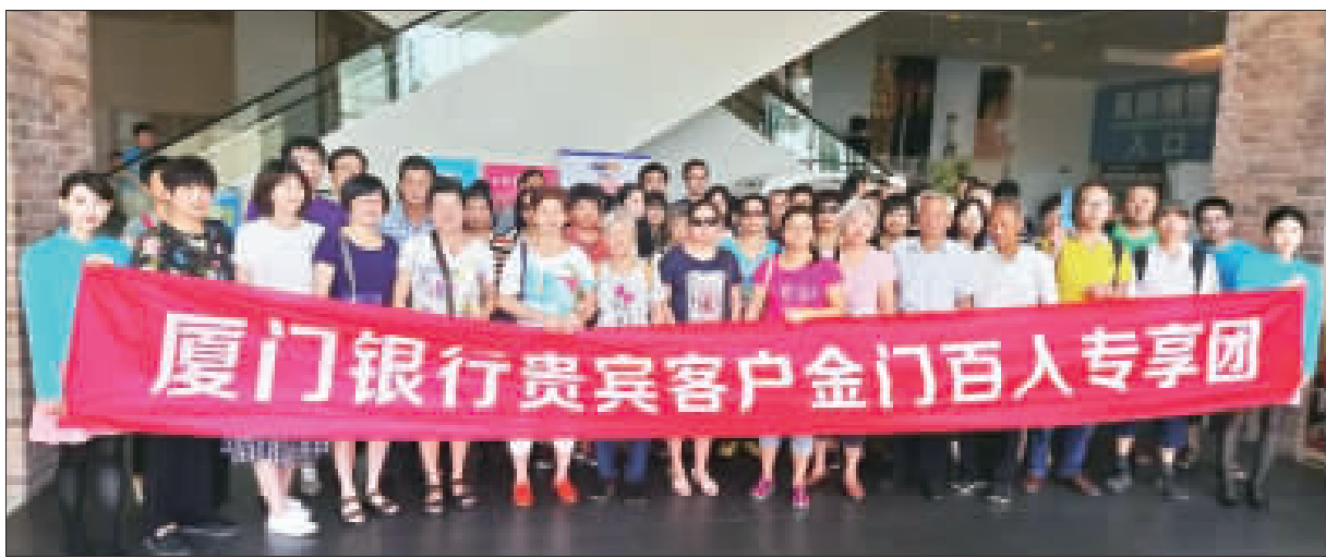
金門最大時尚商團「台開金門風獅爺商店街」卻因廈門陸客人潮湧進，呈現一枝獨秀的亮麗業績。

風獅爺商店街購物，包括廈門相關國企、民間私人企業員工旅遊到風獅爺商店街參觀訪問購物活動，包括昨日贊助廈門銀行組團舉行半程馬拉松賽及員工旅遊購物、十一月在風獅爺商店街舉辦「金廈趣味美展」民俗博覽會、並結合金門縣旅商會、廈門旅商會、廈門旅商會聯合舉辦「2017最美鄉村金門越野跑」古寧頭站一等活動都是為了要帶進購物人潮。 十二月活動尚有12/23第四屆拼圖大賽，由廈門元翔集團、金門縣旅商會同業公會主辦，在風獅爺商店街舉行。