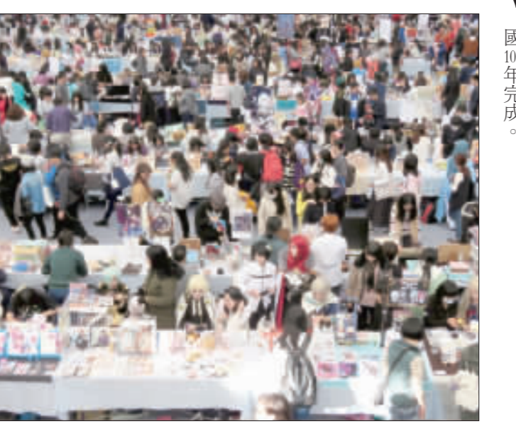
Cosplay界的嘉年華會「台灣同人誌販售會」9、10日在台北綜合體育館舉行，會場約有1300個攤位，2天各吸引逾萬朝聖。

【中央社記者鍾榮峰台北11日電】iPhone X面部辨識功能，但指紋辨識還有機會。外傳報導，蘋果仍持續開發OLED面板整合指紋辨識的技術，看來並沒有放棄螢幕指紋辨識功能。 國外科技網站Patently Appointed報導，儘管iPhone X採用臉部辨識Face ID技術，看來蘋果並未放棄螢幕指紋辨識，仍持續布局相關指紋辨識技術。 報導引述近期一項專利內容顯示，蘋果開發有機發光二極體(OLED)面板可偵測指紋辨識的技術，透過近場光學影像(Near-field optical imaging)和光二極體(Photodiodes)的整合設計，可降低功耗，提升觸控靈敏度，並強化指紋辨識偵測的能力，未來可能應用在新一代OLED螢幕iPhone、iPad或是iPad touch產品。 明年蘋果新款iPhone是否會採用新一代指紋辨識功能，或是全採用臉部辨識功能，市場看法不一。 國外創投公司Leap Ventures分析師孟斯特(Gene Munster)日期研究內容推測，明年秋季蘋果推出的新款iPhone，可能都會採用垂直共振腔面射型雷射陣列(VCSSEL arrays)元件。 國外科技網站AppleInsider推測，若消息屬實，代表明年新款iPhone都將具備TrueDepth相機和臉部辨識Face ID功能。 從另一方面來看，國外科技網站Mark Munster先前引述分析師推測，不排除明年部分新款iPhone採用新一代指紋辨識技術，但需考量2個因素。 首先持續觀察iPhone X的臉部辨識功能Face ID是否能提升使用者體驗；其次還需觀察蘋果能否因應光學式螢幕指紋辨識的技術課題。 凱基投顧分析師郭明錤先前報告預期，全球智慧手機品牌，僅蘋果與三星(Samsung)可能大量採用光學式螢幕指紋辨識(under-display fingerprint recognition)。 從技術來看，報告指出，光學式螢幕指紋辨識技術瓶頸在於穿透(scan-through)效能不佳，易被環境光源與螢幕影響，但可透過客製化OLED面板解決品質問題。