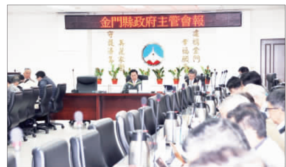
縣長陳福海昨親自主持金門縣政府106年第34次主管會報。

陳福海不諱言，3年來，他對大家的期望很多，也很努力的改變了大家許多施政的思維，從接水、接電、道路拓寬、對外交通、校園硬體友善環境的改善乃至55歲年金等轉型正義議題，他都讓大家都面臨很高難度的挑戰，該做的，我們也都有認真在做，好的，我們一定加以傳承，不足的部分，也願虛心檢討並接受親親的檢驗。