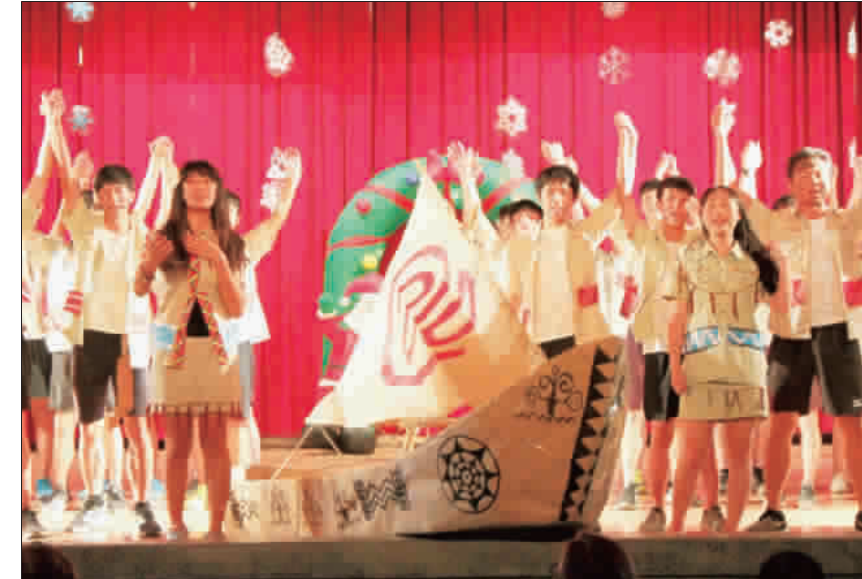
金中一班級英文歌唱比賽，兩個年段各十個班級輪番上台獻唱。活動在金門熱音社表演下揭開熱鬧序幕。

建設處農林科表示，水獺是保育類的貂科野生動物，帶有攻擊性，在圍捕過程中，水獺有隨處咬擊，民眾若遇到類似狀況，切勿隨意靠近捕捉，這次柏村國小處理方式，並無造成學童或水獺其他傷害；另水獺傷口疑似遭流浪犬咬傷，這是金門水獺及其他野生動物共同的問題，提醒民眾切勿隨意餵食流浪犬，這是目前野生動物最大的生存問題之一。