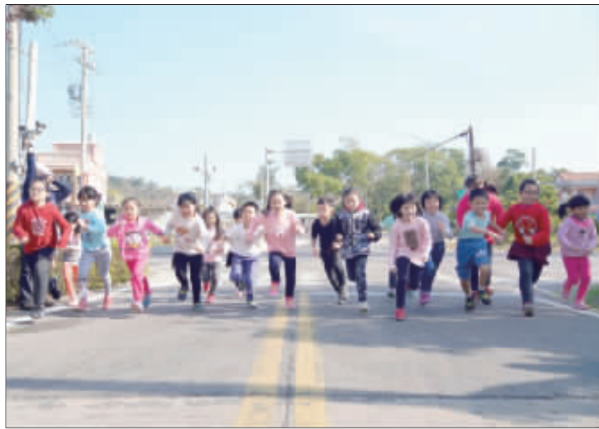
西口國小舉辦「健康活力go，親子越野向前衝」活動，跑出活力與健康。

古寧國小附設幼兒園大樓在師生教學共構中，創作出多元豐富、創意的作品，本學期接近尾聲，特別舉辦「校園之美創作展」，成果發表會，除了欣賞各班主題學習成果影片、幼生唱跳表演、小提琴表演、各班作品展示、列擺設、琳瑯滿目，成果豐碩。許多家長看見孩子半年來的成長，解讀解說、故事繪畫外，還為小朋友創作繪畫、剪紙、手工藝品、朋友親朋好友的賀卡、多件呈現創作的作品，讚譽有加，肯定學校辦學與教師們的用心指導。