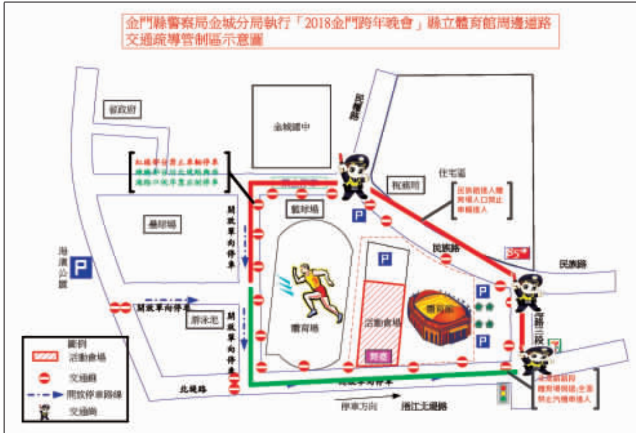
跨晚體育館周邊道路交通疏導管制圖

【本報金門訊】為改善金城鎮公所後方停車困難，金門縣政府於今年(106)年6月完成「金城鎮公所後方停車場」工程發包作業，並經承商於106年8月11日開工，並經趕工，已提前於106年12月26日竣工。該工程雖尚未辦理驗收，惟本府考量金城鎮公所停車不易，故積極協調承商，希望能提前開放停車場供民眾使用，幾經協調後，承商已同意配合提前(107)年1月1日起開放民眾先行使用。 「金城鎮公所後方停車場」工程位於金城鎮公所後方既有停車場的側面，該停車場可提供67格小汽車停車位(含2格身障車位)，盼緩解金城鎮市區停車空間不足問題。 同時，縣府為提升金城鎮公所後方既有停車場的停車便利性，並加強治安死角，另案辦理「金城鎮公所後方停車場周邊設施改善工程」，該工程已於106年11月24日完工，並於106年12月28日完成驗收，案內包括增建26組監視系統(含出入口監控)及停車場進出管制系統(共四組閘門)，盼以維護道路原有交通順暢及安全。