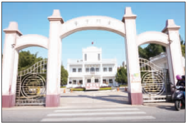
823砲戰金門中學流亡學生60年後重返母校大團圓能成真嗎？