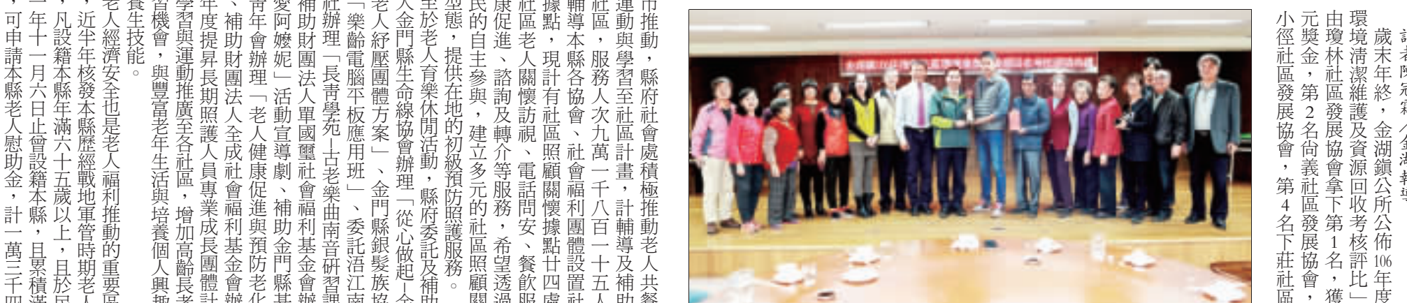
金湖鎮106年度「社區環境清潔維護及資源回收考核評比」，由瓊林社區發展協會拿下第1名。

記者陳冠霖／金湖報導 歲末年終，金湖鎮公所公佈106年度「社區環境清潔維護及資源回收考核評比」結果，由瓊林社區發展協會拿下第1名，獲得3萬元獎金，第2名尚義社區發展協會，第3名小徑社區發展協會，第4名下莊社區發展協會，第5名后園社區發展協會，第6名湖前社區發展協會。30日晚間由縣長陳福海、縣府秘書長林德恭、環保局長呂清富、金湖鎮長蔡西湖、金湖鎮代會副主委李秀華等人親自頒獎。 金湖鎮近期推動「社區環境清潔維護考核評比」計畫，鼓勵社區發展協會投入環境維護工作，對參與之社區，實施輔導並補助購置清潔工具、資源回收等設備，實施成效評選為優良者，給予適當獎勵並列入年度鎮公所對各社區審查舉辦各項活動經費優先補助對象。 金湖鎮公所30日公布評比對象：第1名瓊林社區發展協會，獎金3萬元；第2名，尚義社區發展協會，2萬元；第3名，小徑社區發展協會，1萬元；第4名，下莊社區發展協會，5,000元；第5名，后園社區發展協會，5,000元；第6名，湖前社區發展協會，5,000元。參加獎：山外、溪湖、武德新村、信義新村、正義、料羅、料羅新村、夏興、塔后、峰上、太湖、林兜等社區。另有劉除銀膠菊，第1名后園社區發展協會，第2名正義社區發展協會，第3名瓊林社區發展協會。 縣長陳福海勉勵，「社區環境清潔維護考核評比計畫」，目的為推動社區環境綠美化，營造優質生活環境；鼓勵社區居民，運用社區自有資源，在人力、物力及財力、自動自發遵守環境保護法之規定，推動環境改善，例如清潔環境、美化環境、營造環境特色，呈現合於國民健康、安全、舒適之生活環境品質；加強社區垃圾減量、廚餘回收及資源回收工作，促進資源永續利用；期盼營造「整齊、文明」、「美麗金門」、「海上公園」之良好形象。