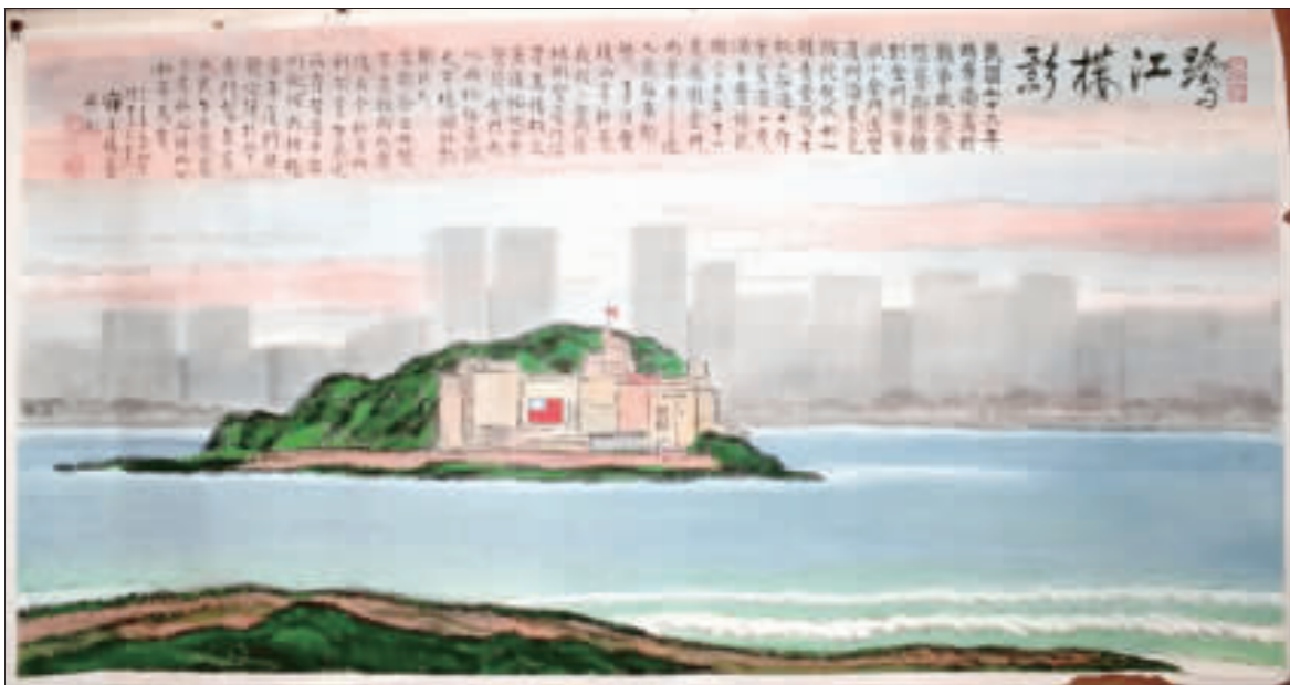
鄭善禧金門情之二「鷺江樓影」。