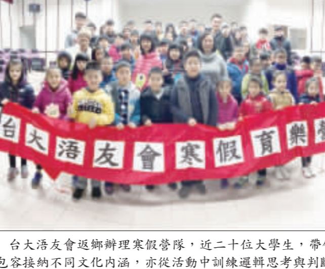
台大活友會返鄉辦理寒假營隊，近二十位大學生，帶領中正國小學童在遊戲中學習，深化家鄉的鄉土文化，語言學習包容接納不同文化內涵，亦從活動中訓練邏輯思考與判斷能力。