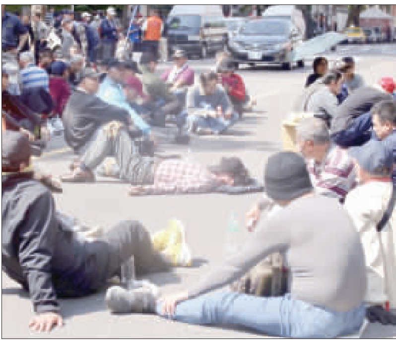
反軍人年改團體27日早上衝撞立法院，並號召群眾聚集在立法院旁的濟南路，有民眾躺在馬路上休息。