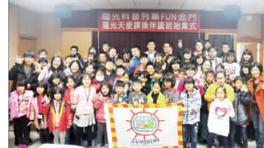
金門大學陽光天使社課後讀班讀班業式昨在金寧中小學視聽教室舉行。