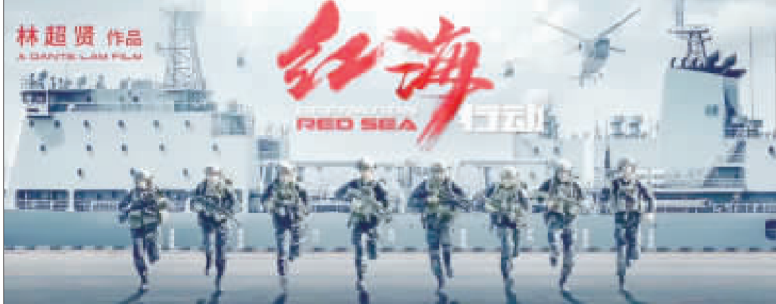
愛國戰爭電影「紅海行動」熱映28天，票房已達人民幣34億元(約新台幣156億元)，躍居中國大陸電影票房總排行榜亞軍，有機會挑戰「戰狼2」保持的56億元紀錄。

愛國戰爭電影「紅海行動」熱映28天，票房已達人民幣34億元(約新台幣156億元)，躍居中國電影票房總排行榜亞軍，有機會挑戰「戰狼2」保持的56億元紀錄。 根據中國電影票房網最新統計，「紅海行動」的票房已經突破34億元，超越周星馳導演的「美人魚」於2016年締造的33.9億元，躍居中國影史總票房亞軍，朝向「戰狼2」的56.7億元紀錄邁進。 吳京自導自演的「戰狼2」去年橫掃大陸票房，掀起愛國電影熱潮後，今年春節上映的「紅海行動」無論類型、背景、故事元素都有幾分相似。兩部愛國片都取材於2015年中國自衛軍撤離的半軍事行動，背景都是非洲國家，同樣都是爆發內戰有叛軍、恐怖分子肆虐。 不過與「戰狼2」藍波式的單打獨鬥相比，「紅海行動」則是中國海軍特種部隊「蛟龍突擊隊」8人小組的團隊作戰，整體呈現更緊湊、貼近真實，獲得大陸影迷好評，票房因此開平走高。 根據大陸豆瓣網影評，「紅海行動」拿到8.5的高分(滿分10)，遠勝「戰狼2」的7.2分。此外，「紅海行動」並非是趕「戰狼2」的熱潮而催生，這部愛國戰爭片是中國海軍於2015年就下令拍攝，並全力動員配合，還調來當年葉門撤離的054A「臨沂艦」原班原班現，並秀出神秘的059A潛艇。當然，片尾也未免俗地出現中國海軍戰艦在南海驅逐「侵入」的外國軍艦畫面。 「紅海行動」雖持續熱映，但目前中國電影票房冠軍卻是另一部愛國片「厲鬼》，中國電影院線已達1.2億元，儘管許多大陸網民指這部紀錄片都是單位包場，被動員去看的。 但即使是愛國片，在中國大陸也不見得就是票房保證。 2017年9月，由大陸影后范冰冰主演，她的男友李晨導演的愛國軍事大片「空天獵」上映