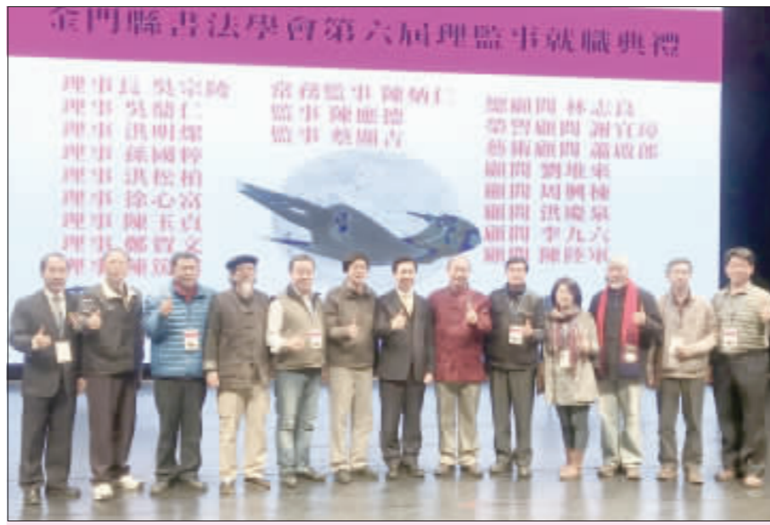
金門縣書法學會辦理「中華書道五千」國際書法交流活動，上、縣長陳福海到場頒發當選證書給第六屆書法學會理事暨監事；右中：會中安排精彩表演節目；左下、50位書法家也上台表演介紹各家書法源流。

記者陳麗好／金城報導 金門縣書法學會辦理「中華書道五千」國際書法交流活動，昨日下午進行的書法演藝活動，會中安排古琴、傀儡戲、現代舞、聲韻、太極拳、古箏等節目，50位書法家也上台表演介紹各家書法源流。縣長陳福海到場頒發當選證書給第六屆書法學會理事暨監事，金門縣書法學會策劃此活動，讓金門透過書法與國際交流，並且將文化傳承及向下扎根，祝願書法學會有更好的發展與未來。 金門縣書法學會第六屆理事暨監事就職典禮暨成立二十週年紀念，舉辦「中華書道五千」國際書法交流活動，昨日下午一時三十分起進行書法演藝活動，會中安排古琴、傀儡戲、現代舞、聲韻、太極拳、古箏等節目，以及來自各地的50位書法家上台表演介紹各家書法源流，縣長陳福海也到場頒發當選證書給第六屆理事暨監事，並頒發當選證書給金門縣書法學會第六屆理事暨監事。 陳福海表示，書法能陶冶心靈，亦能代表金門與國際交流。感謝金門縣書法學會辦理「中華書道五千」國際書法交流活動，讓兩岸三地以及世界各地書法家共聚一堂，透過文化交流，展現金門文化力量。金門早期是戰地，在臺灣方面冷淡處理兩岸交流事務之際，金門與對岸在文化及交流上反而持續地推動，透過文化交流，人與人之間友善交流，建構友善環境，更能夠感受到戰爭無情和平無價之可貴。 陳福海也說，金門文風鼎盛，宋明清以來共出過五十位進士，而縣府致力於文化工作、教育工作的推廣，樂見金門縣書法學會從基層教育出發，帶學生學習書法，讓文化傳承及向下扎根，意義深遠。此外，世界各地書法家齊聚金門，透過文化交流，一一介紹家輪番上台表演，中華文化的書法源流，一一介紹五體書、篆、隸、草、行、楷等中華傳統之誦、古箏、太極拳、聲樂獨唱、舞蹈、古箏等演出，吸引許多學子以及民眾到場參與，欣賞精彩表演之餘亦透過攝影同樂，同時憑入場券兌換由金門縣書法學會精心準備的掛軸小品。