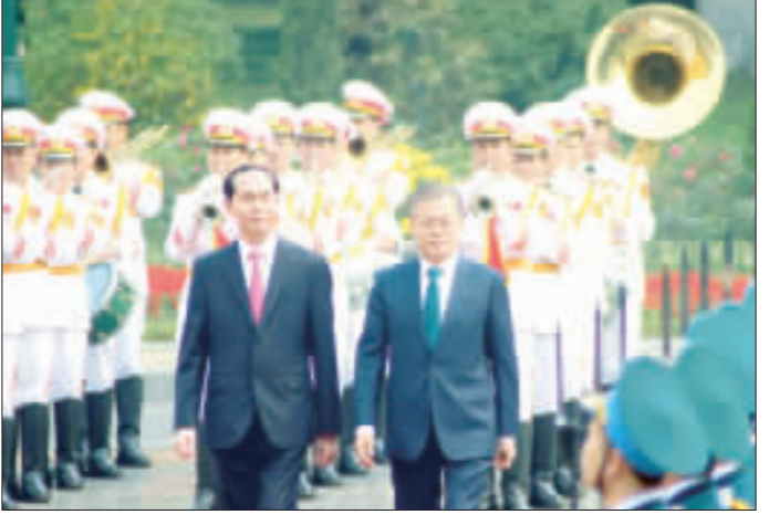
南韓總統文在寅22日至24日訪問越南。越南國家主席陳大光23日在主席府以隆重儀式歡迎文在寅到訪。(中央社)

越南政府新聞網站今天報導，陳大光與文在寅會中就兩國建交以來關係及雙方共同關注的國際和地區問題交換意見。 報導說，雙方同意進一步推動兩國關係發展，增進高層代表團互訪，加強兩國外交、國防與安全等領域的合作與交流，儘早通過雙邊國防部的「防務合作共同願景宣言」。 報導說，雙方同意將努力爭到2020年雙邊貿易總額達到100億美元，朝向平衡貿易發展，鼓勵基礎設施、高科技、能源等領域的投資合作。 報導說，雙方同意加強兩國在各國國際論壇上的密切合作，對維護區域和平、航海與航空自由與安全、促進透過和平且符合國際法的措施解決所有分歧的重要性加以肯定。 陳大光與文在寅會後見證兩國多項合作協議的簽署儀式，包括經貿、投資、科技與勞務等合作文件。 陳大光會後表示，相信越韓戰略合作夥伴關係將繼續向前發展，為兩國人民帶來更多福祉，為區域和世界和平、穩定、合作與發展做出貢獻。 文在寅表示，越南與南韓是彼此重要夥伴，越南也是南韓正在實施「新南方政策」中最重要的國家。兩國密切關係將是雙方推動經貿與投資合作發展的基礎。 越南與南韓於1992年底建交。