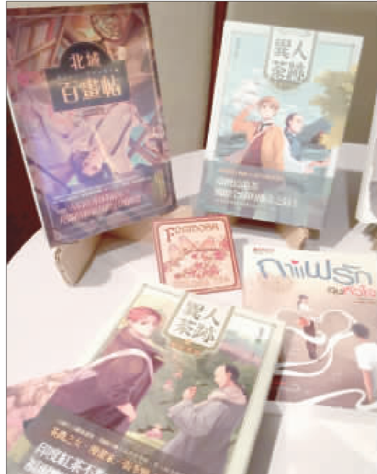
第16屆曼谷國際書展將在29日開幕，除有精彩藝文演出外，泰國出版商準備暢銷書展出。

【中央社記者姜遠珍首爾23日電】首爾中央地方法院22日深夜批准逮捕南韓前總統李明博，檢方前任李明博私寓進行逮捕，使得李明博淪為第4個涉腐被捕的南韓前總統。 南韓「朝鮮日報」今天在頭版頭條以「李明博前總統深夜被拘捕」為標題，「東亞日報」則以「一名被關進鐵窗的前總統」(MB(李明博)因受賄罪嫌遭關押)為標題，報導了李明博被捕的消息。 報導指出，李明博將被關押在首爾東部看守所的單間牢房。因朴槿惠已於去年3月31日被逮捕，南韓在2016年逮捕全斗煥、盧武鉉後，時隔23年重現2名前總統同時被關入獄的罕狀。 負責逮捕李明博的檢察官朴錫錫就逮捕證發理由表示，案件事實基本清楚，案情重大，犯罪嫌疑入位高權重，有毀滅證據之虞。 檢方指控李明博有受賄、侵吞、逃稅、濫用職權等10多項罪名。檢方可在最長達20天的羈押狀態下查辦李明博案，深究餘罪，擴大戰果。 李明博將在4月10日羈押屆滿，檢方已表示將擴大調查，預計屆時將會對李明博提起公訴。檢方也有可能在本月底或6月初起訴，以免影響6月地方選舉。 考慮到前總統的特殊身份，檢方考慮和查辦朴槿惠案一樣，到看守所內訊問李明博。 報導指出，李明博涉嫌在總統任內收受國家情報院院長以「特別活動費」