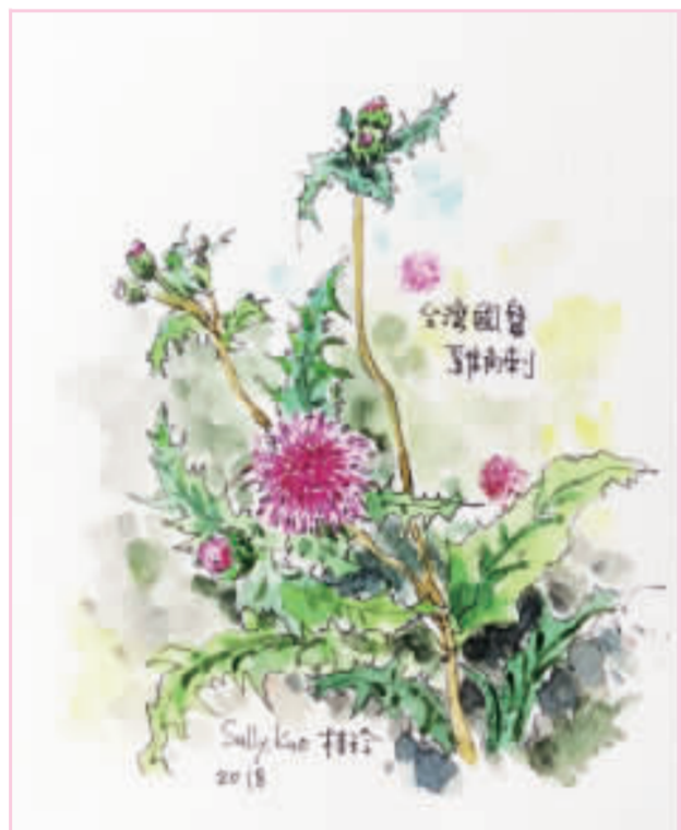
▲日光小林社區裡的雞角刺。