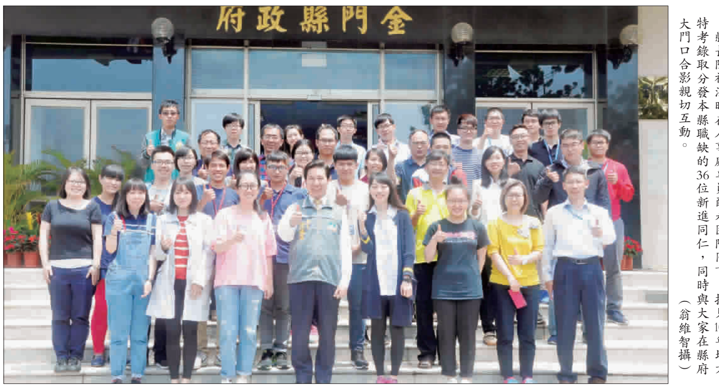
縣長陳福海昨在人事處專員薛永固陪同下，接見106年地方特考錄取分發本縣職缺的36位新進同仁，同時與大家在縣府大門口合影親切互動。

大家更無微不至的照顧，希望大家都能愛上金門、喜歡上金門，他的手機也會24小時開機，不論生活需求或業務上的大小事，他都樂意接受大家建議和反應，更願意做大家的後盾，協助大家解決任何在地適應的問題。 此外，陳福海也感性的說，「有緣到金門來，就是金門的一份子；有緣加入縣府團隊，就是縣府團隊的一家人」，金門是個幸福島嶼，同在這條船上，希望每位同仁在工作上都能有自己的創意發想，同時在各自的工作崗位上產生爲民服務的價值。