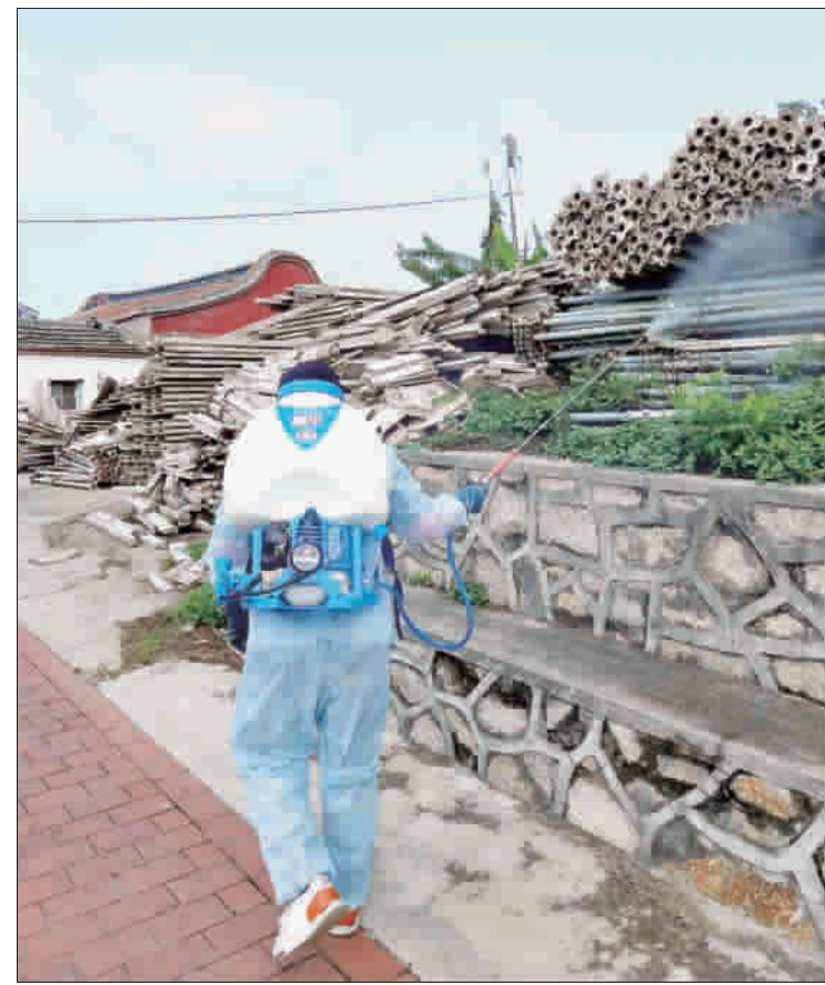
為防治登革熱蔓延，金寧鄉清潔隊進行全鄉大規模消毒病媒蚊噴灑藥劑工作。

除病媒蚊孳生源。近來天氣不穩定，時而陰雨時而放晴，積水容器若不加意清除，則容易孳生蚊蠅，除了有礙環境衛生外，並有可能發生登革熱疫情。清潔隊除按事先排表分赴各社區辦理環境整頓外，於廿三日起巡迴各村各社區辦理環境消毒工作，也請社區民眾、各機關學校應主動進行環境整理，清除積水容器、落實檢查並清除居家周圍花瓶(盆)、水缸、廢棄瓶罐、盆栽墊盤及廢輪胎等容易積水的容器及廢棄物，以免形成蚊蠅孳生的溫床。 金門鄉清潔隊排定預防登革熱病媒蚊孳生源環境消毒作業，消毒地點遍佈金寧鄉轄區內的各個角落，地區各自然