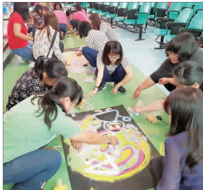
古寧國小舉辦金門縣美感教育初階與進階觀摩工作坊，幼教師實際體驗美的感受與課程。

頭(防空洞)」、「學校旁的水尾塔」等課程，實際帶領研習老師園所共構的學習紀錄與各師團豐富多元的成果作品，並巡迴古寧周邊豐富的教材園，包含巡迴古寧防空洞、觀音亭、觀音亭、觀音亭... 下午為實作課程由宜蘭新嘉坡兒童美術專家蘇莎芬老師蒞臨實作指導增能，除兒童作品藝術賞析外，並運用鹽巴、粉筆在黑色壁報紙上分組創作，展現天馬行空的想像，幻化為一幅幅的藝術創作，色彩豐富多元，創意十足，讓人眼睛為之一亮。從相互討論與合作中看見別人不同的視點，發現創意的教學元素，一整天課程緊湊而精實，讓幼教師師驚喜連連，大呼過癮，收穫滿滿。 「大自然是最佳的藝術師」古寧國小周邊擁有的豐富的自然生態、人文歷史、戰役史蹟，是孩童最佳的美感學習教材，透過在地化課程框架幼兒的美感學習，希望藉由實際分享及實務增能工作坊，每位教師將美的種子向下扎根，讓孩子們接觸觀察周遭環境，感受美、生活美、創造美，落實美感教育向下扎根。