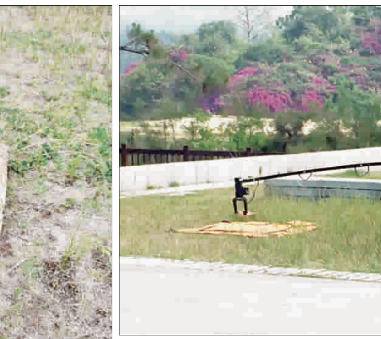
▲乾涸的太湖湖面發現一顆「共軍82迫擊砲彈」。 ▲金防部彈藥連未爆彈小組派員處理。

記者陳冠霖／金湖報導 大湖湖底發現一顆「共軍82迫擊砲彈」，一名清理大湖湖邊環境的工作人員，昨(24)日上午在乾涸的太湖湖底發現一顆疑似砲彈的物體，隨即報警，金防部彈藥連未爆彈小組到場，研判應是82迫擊砲彈的「共軍」砲彈。 金門最近少下雨，大湖湖面乾涸許多，湖底被湖水淹沒，所以一直沒被發現，直到最近湖面乾涸，砲彈才「重見天日」。 金門分駐所獲報後，立即派遺員前往，並同步步通報金防部彈藥連未爆彈小組到場，經彈藥連少校林福生表示，研判是「共軍82迫擊砲彈」，由未爆彈小組人員全副武裝，先以機器手臂將該砲彈夾起來，隨即用軍車載走。