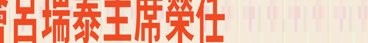
陳福海縣長與開瑄國小師生合影。