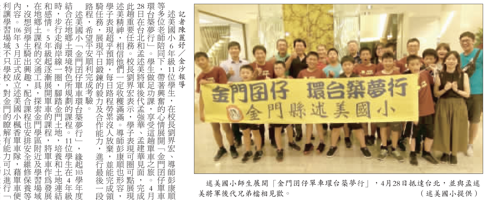
述美國小師生展開「金門囡仔單車環台築夢行」，4月28日抵達台北，並與孟述美將軍後代兄弟檔相見歡。