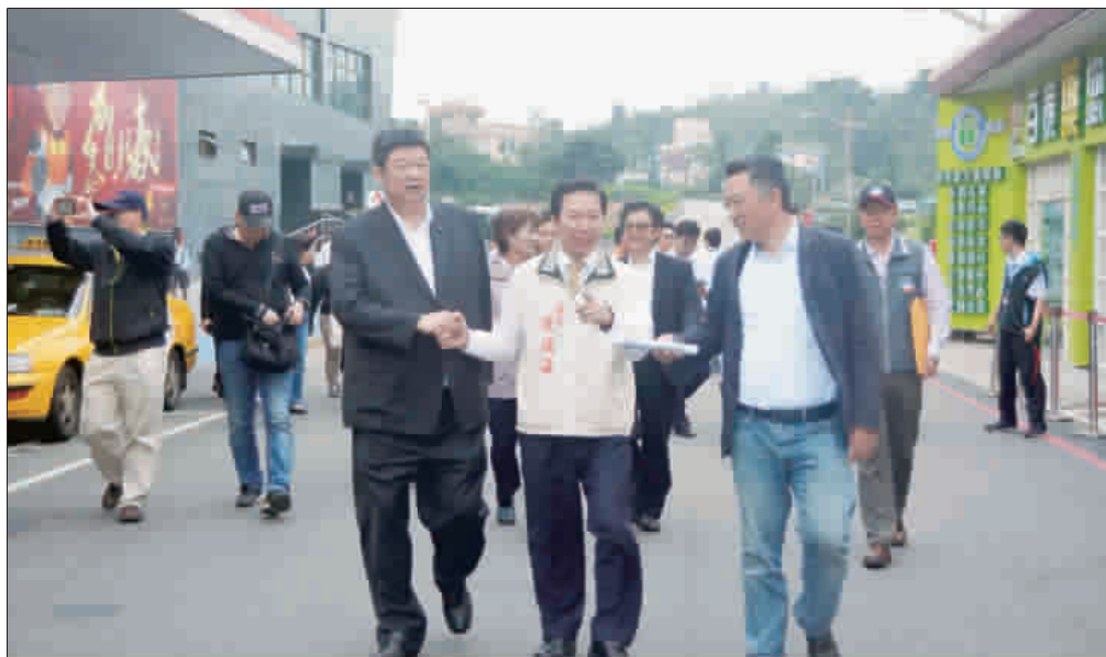
縣長陳福海陪同楊鎮浚、陳雪生等立委了解水頭港埠建設和旅運中心執行情形

記者許加泰／烈嶼報導 立法院內政、交通委員會委員昨日繼續金門考察行程，到水頭碼頭了解港埠建設和旅運中心執行情形。縣長陳福海感謝中央的支持，水頭港埠建設計畫。交通部次長陳文忠希望縣府盡速提出完整的修正報告，並把金門大橋完工後的交通運輸納入。 立委楊鎮浚陪同陳雪生、洪宗熠、徐志榮、劉世芳、陳怡潔等立委前來金門考察，並邀請內政部、交通部、陸委會、海巡署、警政署、消防署、營建署、移民署、水利署、國產署、觀光局、民航局、航港局、高公局等部會首長前來金門，實地瞭解鄉親需求。 內政部長林錫山肯定烈嶼海岸線是難得的自然景觀，允許由營建署結合水利署等單位，在一個