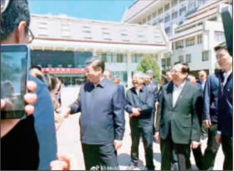
習近平視察北大 5月4日是北京大學120周年校慶，中國國家主席習近平昨日前往北大視察，與師生代表親切交談。

習近平視察北大 5月4日是北京大學120周年校慶，中國國家主席習近平昨日前往北大視察，與師生代表親切交談。習近平在視察過程中，對北大的辦學成就和發展變化表示肯定，並勉勵北大師生要緊抓機遇，勇挑重擔，為實現中華民族的偉大事業貢獻智慧和力量。