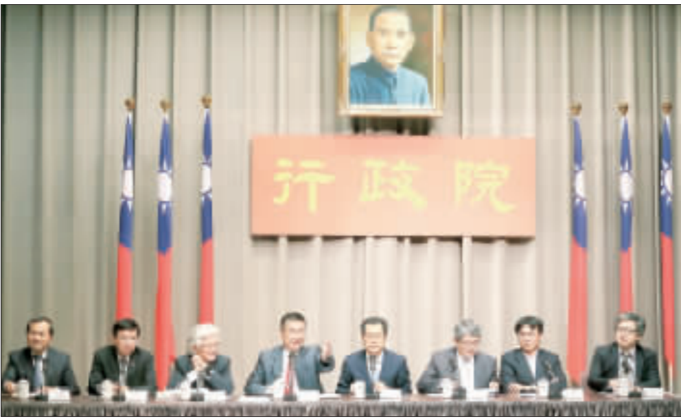
行政院3日舉行院會後記者會，由政務委員兼發言人徐國勇（左4）主持，原主委會副主任委員邱鳴聰（左）、人事行政處處長施能傑（左3）、交通部部長陳水扁（左2）、環保署署長李應元（右4）、內政部長陳水扁（右3）、會次長長敬群（右3）、會次長長敬群（右3）、會次長長敬群（右3）出席與會。圖為行政院會通過組改草案。

【中央社記者顧登台北3日電】行政院今天通過組織改造草案，環保署將升格為環境資源部。行政院會今天通過行政院組織修正草案，將環保署升格為環境資源部，並增加環境部、交通部的中央氣象局等單位，升格環境及資源部，等同於新設部會。行政院組織修正草案於民國99年立法院三讀通過，明訂行政院轄下37個部會將併為29個，並自101年啟動組織改造，目前還有6個部會未完成組改，包括大陸委員會、經濟部改制經濟及能源部、環保署升格為環境資源部、農委會升格為農業部等。行政院人事行政總處人事長施能傑上午在院會後記者會時表示，陸委會組織法去年已送立法院審議，今天院會通過其他43項組織法草案，相當於組改最後一塊拼圖。依據行政院規劃，內政部轄下營建署將改制為國家公園署跟國土管理署，國家公園署將繼續由內政部管理；交通部觀光局將