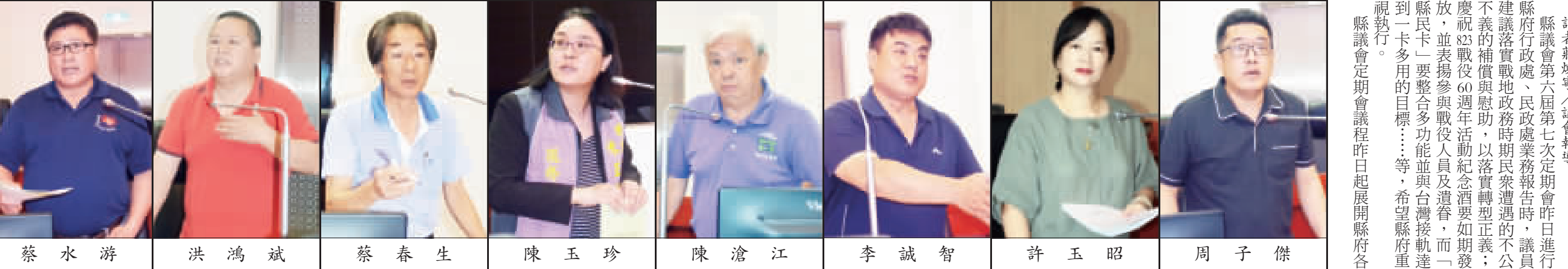
記者莊煥寧/議會報導

記者莊煥寧/議會報導 縣議會第六屆第七次定期會昨日進行縣府行政處、民政處業務報告時，議員建議落實戰地政務時期民眾遭遇的不公不義的補償與慰助，以落實轉型正義。慶祝83戰役60週年活動紀念酒要如期發放，並表揚參與戰役人員及遺眷，而「縣民卡」要整合多項功能並與台灣接軌達到一卡多用的目標……等，希望縣府重視執行。 縣議會定期會議程昨日起展開縣府各