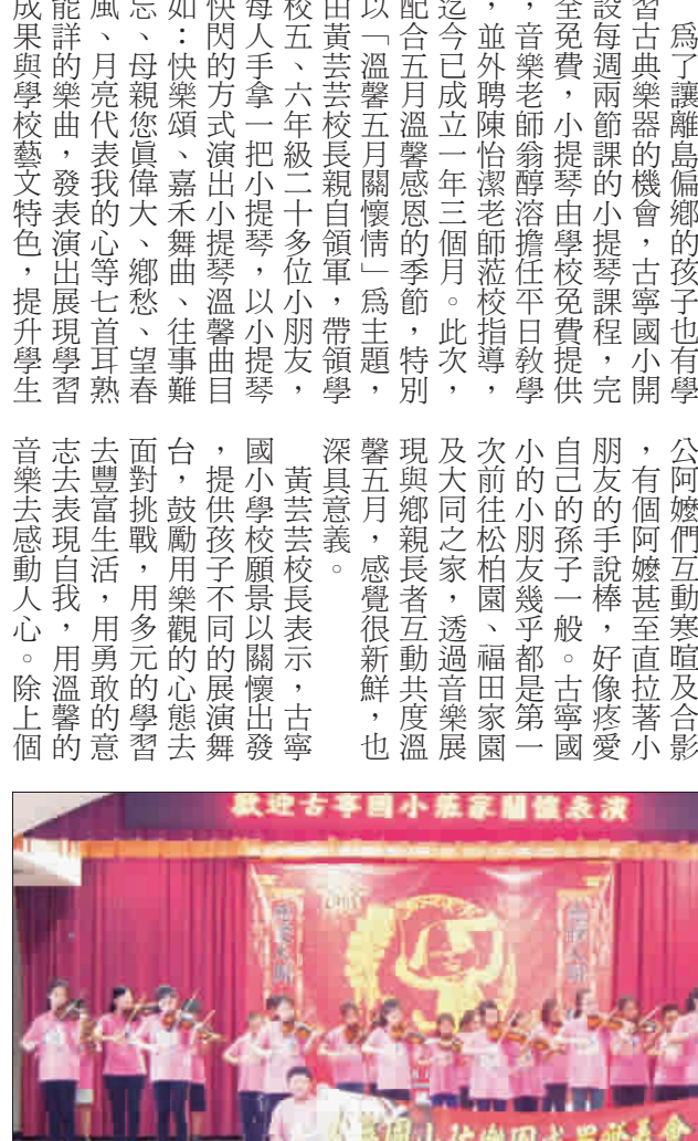
古寧國小小提琴快閃發表快閃活動...