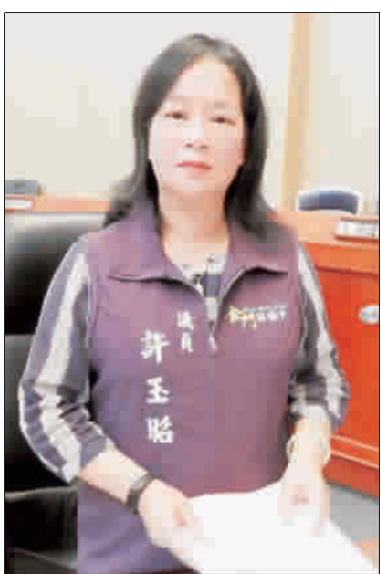
記者莊煥寧/議會報導