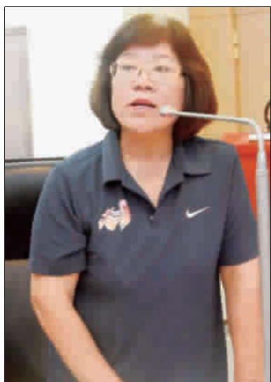
記者楊水珠/議會報導