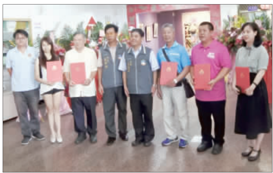
金門縣傑出演藝團隊徵選結果揭曉，昨日下午在縣立體育場舉行頒獎典禮。圖為獲選團隊代表與評審團成員合影。

金門縣文化局辦理傑出演藝團隊徵選，採初審書面審查、複審於4月22日下午兩點假文化局演藝廳演出，現場並邀請國立台灣藝術大學舞蹈系主任曾麗薰、中國文化大學藝術學院院長曾文立、傳統藝術中心主任樊慰慈及文化